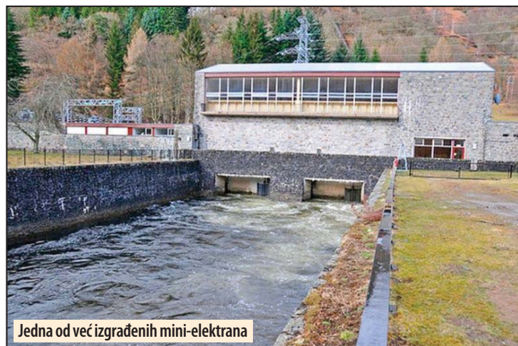
Jedna od već izgrađenih mini-elektrana

Male centrale će se graditi na pritokama Peka