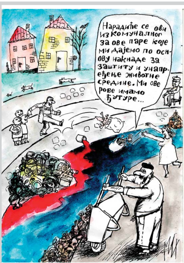
Ilustracija: M. Perlek