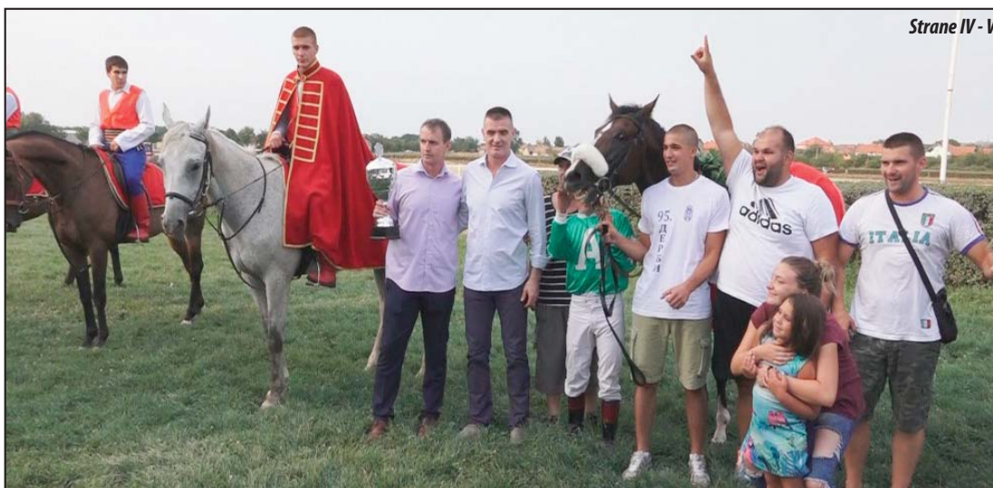
Strane IV - V