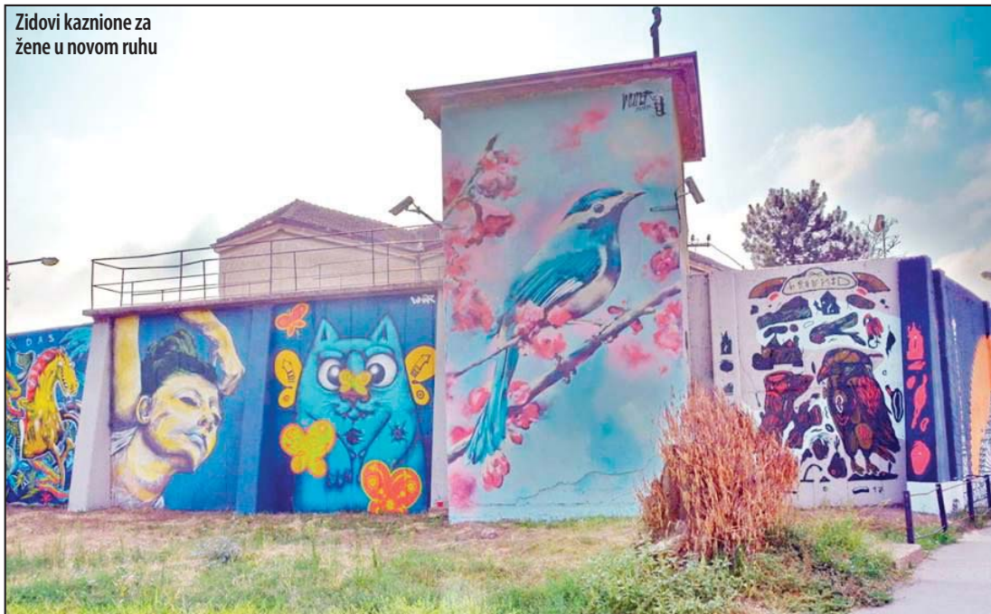
Zidovi kaznionice za žene u novom ruhu

Festival ulične umetnosti oplemenio Požarevac mnogo više od predviđenog