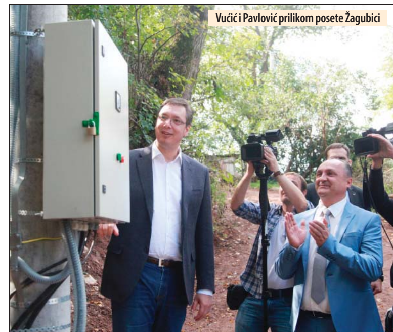
Vučići Pavlović prilikom posete Žagubici

Homoljska „Severna Koreja“ pruža podršku predsedniku Srbije