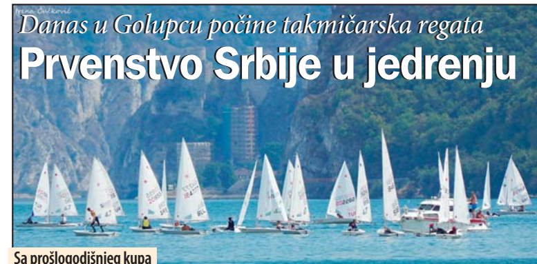
Sa prošlogodišnjeg kupa

- Samo nekoliko dana pošto je to najavio počeli su radovi. Trenutno su u punom jeku i očekuje se da će u predviđenom roku da se i završe. Povodom završetka radova pozivan predsednika Vučića da sa svojim saradnicima dođe da taj poduhvat sa homoljskim stanovništvom zajedno proslavimo i svečano otvori novoizgrađeni put. To je dokaz da ispunjava svoja obećanja, a narod Homoljia zbog toga mnogo ga voli i verujem, da će velika budućim izborima, stoprocentno podržati, zaključio je predsednik Opštine Žagubica. M. V.