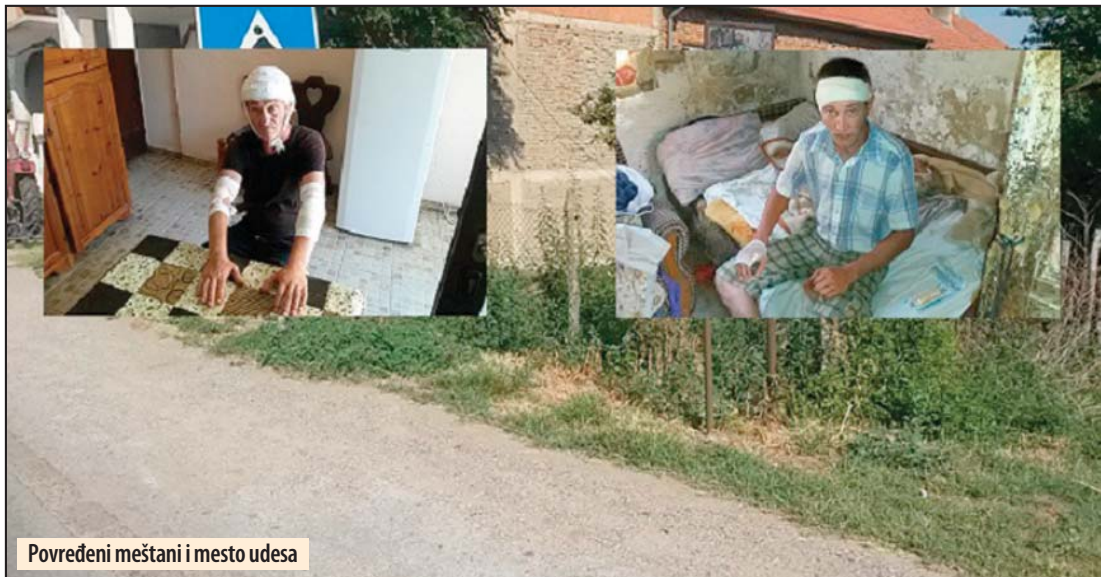
Povređeni meštani i mesto udesa

U udesu u Topolovniku povređeno dvoje meštana