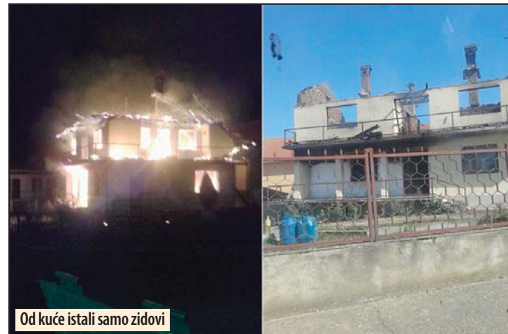
Od kuće istali samo zidovi

Veliko Gradište - Na dan proslave Svetog Ilije u Ljubinjju, opština Veliko Gradište, do temelja je izgorela porodična kuća porodice Živanović. Požar je izbio 2. avgusta, oko deset časova uveče, iz za sada još neutvrđenih razloga.