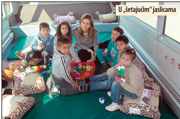
U „šetajućim“ jasicama

Vrtić na točkovima završio ovogodišnje putovanje