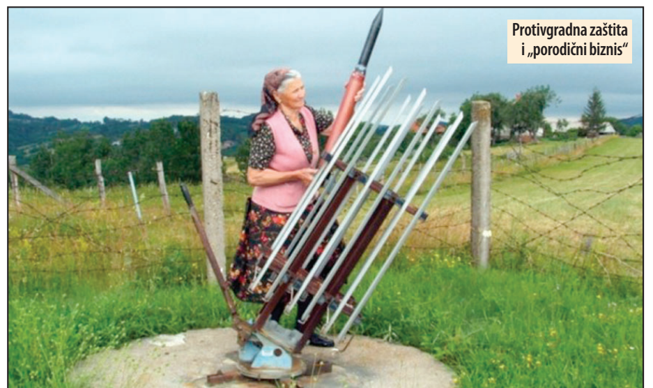
Protivgradna zaštita i „porodični biznis“

Pored opremanja protivgradnih stanica novim raketama, izdvajanjem dodatnih sredstava za strelce Grad Požarevac će znatno unaprediti smanjivanje opasnosti od grada čije posledice mogu biti i fatalne po useve i zasade voća. Protivgradna zaštita je poslednjih