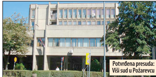
Potvrđena presuda: Viši sud u Požarevcu

Požarevac - Zoran Ristić (31) iz Brankovine, opština Valjevo, koji se nalazio u KPZ „Zabela“ na izdržavanje zatvorske kazne u noći između ponedeljka i utorka izvršio je samoubistvo u zatvorskoj bolnici. On se u zatvorskom stacionaru nalazio na lečenju, ali je iz sebi znanih razloga odlučio da prekрати život vešanjem. On je pomenute noći iskoristio priliku dok su ostali bolesnici osuđenici spavali da izvrši samoubistvo, na taj način što je od čaršava napravio omču, čiji je jedan kraj zakačio za krevet na spratu, a drugi sebi oko vrata. Njegovo telo kako visi otkrili su osuđenici koji su taj slučaj prijavili nadležnima. Kako saznajemo samoubica nije ostavio nikakvo oprostajno pismo, pa se motivi ovog samoubistva ne znaju. Inače, prema rečima našeg izvora bliskog istrazi, Ristić je do sada na razne načine više puta pokušavao da izvrši samoubistvo ali je, do sada, uvek ostajao živ. Njegovo telo predato je porodici radi sahrane. M. V.