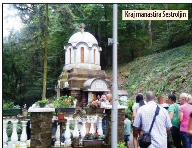
Kraj manastira Sestroljin