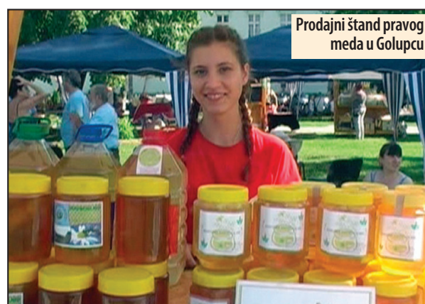
Prodajni štand pravog meda u Golupcu

- Te 2012. godine zacrtali smo određene ciljeve koje smo u ovoj godini i ispunili. Jedan od ciljeva je brendiranje i zaštita geografskog porekla, jer smo dobili rešenje od Zavoda za zaštitu intelektualne svojine gde je brendiranje naš med koji će se proizvoditi u ataru Nacionalnog parka „Đerdap“. Uradene su sve analize u nadležnim laboratorijama i sa ponosom mogu da kažem da med sa ovih prostora u sebi sadrži oko 60 biljaka u sebi, što ne može da se niko pohvali sa takvim kvalitetom proizvoda. Prošle godine na Međunarodnom poljoprivrednom sajmu u Novom Sadu