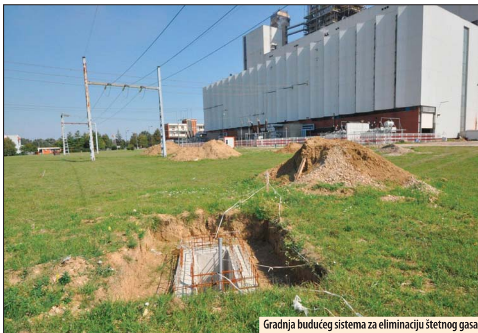
Gradnja budućeg sistema za eliminaciju štetnog gasa

Ovim projektom predviđena su dva transformatora od 25 MVA ili 110/6 kV. Kablovskim trasama će se iz transformatora napajati ventilatori, mlinovi, drobilice, pumpe, transporter i svi oni potrošači koje poseduje ODG postrojenje, kaže Milutin Stanković, rukovodilac projekta. Postrojenje od 110 kV je 1999. godine uništeno u bombardovanju, a nakon rekonstrukcije ostavljeno je samo jedno rezervno polje predviđeno za blok B3. Zbog novih postrojenja u krugu TE „Kostolac B“ morala je da se uključi u rad i nova trafostanica, „Rudnik 4“. Na ograničenom prostoru uradićemo dvostruki