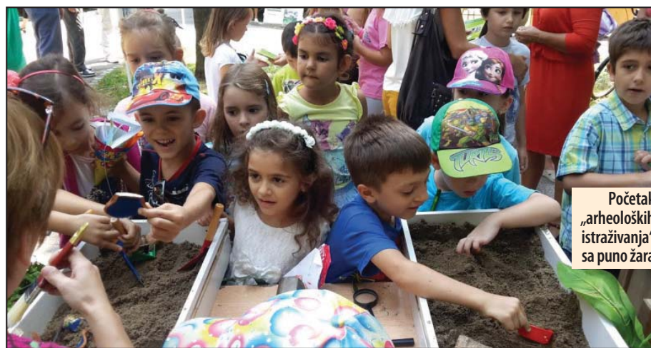
Početak „arheoloških istraživanja“ sa puno žara

Kreativna radionica „Kopanje po prošlosti - arheologija za decu“