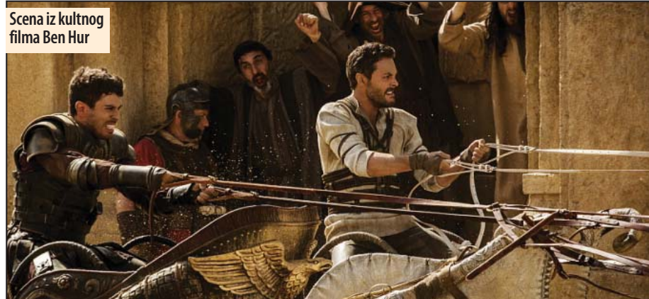
Scena iz kultnog filma Ben Hur

film „Tajne avanture kućnih ljubimaca“ na repertoaru je u subotu 10. i nedelju 11. septembra, u vremenu u 16.30 sati. Kao peti zajednički dugometražni animirani film, Illumination Entertainment i Universal Pictures predstavljaju „Tajne avanture kućnih ljubimaca“, komediju o životima naših kućnih ljubimaca koje vode kad mi odemo na posao ili u školu svakog dana. Ovo je animirana komedija o životima naših