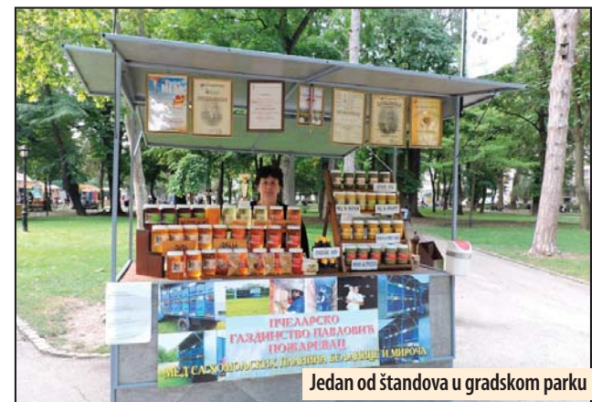
Jedan od štandova u gradskom parku

Plan detaljne regulacije područja vetroparka Krivača izradio je arandelovački Arhiplan, a za izradu Studije o proceni uticaja na životnu sredinu bila je zadužena firma ECO Logica Urbo iz Kragujevca. Prema podacima iz PDR, dozvoljena je gradnja u dve faze. Z. V.