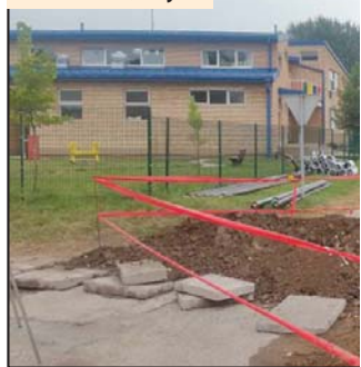
Radovi u MZ „Burjan“

Požarevac - Naselje „Burjan“ u Požarevcu će narednih meseci dobiti dva i po kilometra toplovodne mreže, a radovi su trenutno usredsređeni na ulice kod vrtića „Danica Radosavljević“. Rok za izvođenje radova je tri meseca, a građani priključke na toplovodnu mrežu moći da dobiju oko Nove godine.