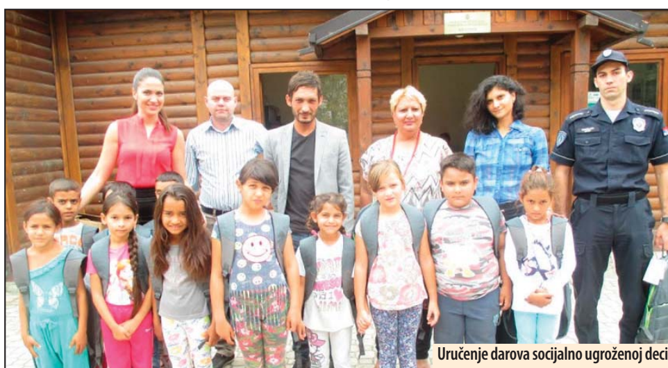
Uručenje darova socijalno ugroženoj deci

Kako se navodi u saopštenju Kancelarije za romska pitanja Gradske opštine Kostolac, cilj projekta je ukazivanje na značaj posedovanja ličnih dokumenata, na ograničenja u ostvarivanju prava za „pravno nevidljive“ osobe, zatim da se objasne pojedine administrativne procedure kao i da se definiše i uspostavi bolja međusektorska saradnja i koordinacija između svih relevantnih institucija, javnih servisa i organizacija civilnog društva. Tim povodom tokom juna je orga-