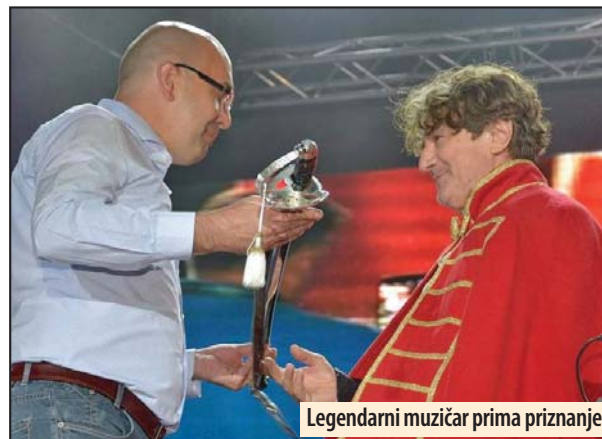
Legendarni muzičar prima priznanje

Sam koncert je bio za pamćenje i sadržao je legendarne hitove ove grupe u nešto drugačijem aranžmanu. Ipak, i oni ljubitelji „dugmeta“ iz sedamdesetih i osamdesetih godina uživali su u nešto drugačijem zvuku svojih omiljenih pesama. Tome u prilog ide i podatak da je, prema nekim podacima, bilo oko 22.000 ljudi na