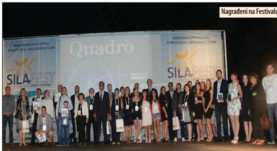
Nagrađeni na Festivalu

- Srbija ima želju da postane turistička velesila. Zato mora da ima ovakav festival da bi ljudi koji se bave turizmom došli, da bi videli šta se novo radi u svetu i da