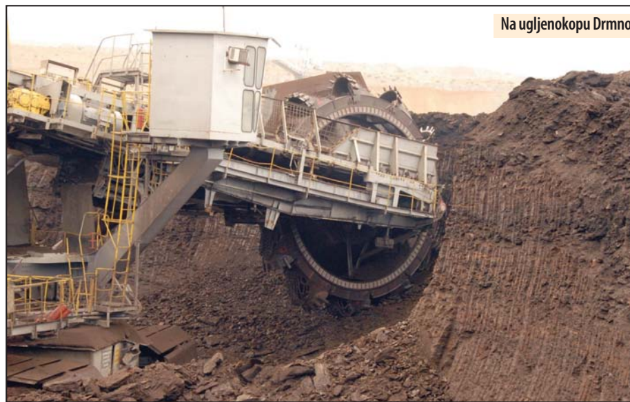
Na ugljenokopu Drmno

- Proizvodnja na kopu „Drmno“ je stabilna i pored problema koji realno opterećuju proizvodni proces. Prema rezultatima rada za sedam me-