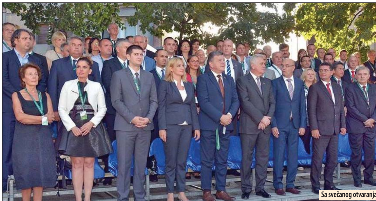
Sa svečanog otvaranja