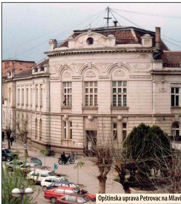
Opštinska uprava Petrovac na Mlavi

je postavljanje 38 vetrogeneratora, a ukupna snaga buduće vetroelektrane biće do 103,32 MW. Električna energija će se isporučivati preko