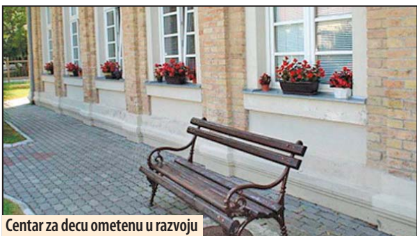
Centar za decu ometenu u razvoju