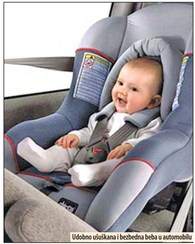
Udobno ušuškana i bezbedna beba u automobilu

Inače, Agencija za bezbednost saobraćaja Srbije sprovela je istraživanje u 2015. godini kojim su utvrđene vrednosti indikatora bezbednosti saobraćaja. Ovim istraživanjem je određena i vrednost indikatora upotrebe zaštitnih sistema za decu do 3 godine. U Požarevcu ova vrednost je niska i iznosi 60 odsto, što znači da se jedno od tri deteta ne prevozi pravilno, odnosno na bezbedan način. Situacija u Požarevcu je još i dobra u odnosu na druge gradove u Srbiji. Područje policijske uprave Su-