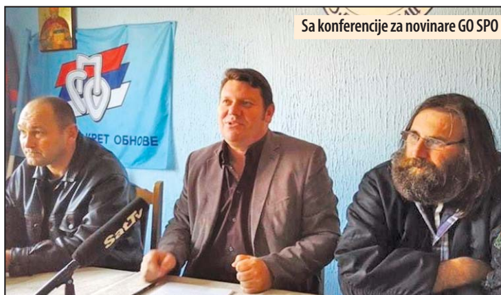
Sa konferencije za novinare GO SPO

tila i temu vodosnabdevanja u Požarevcu kao i otvaranje tajnih dosijea i reforma službi bezbednosti.