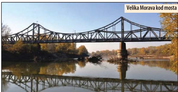
Velika Morava kod mosta