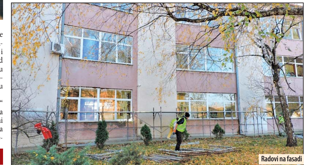
Radovi na fasadi

„Akcija za zdravlje“ u vrtićima na teritoriji Požarevca