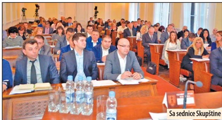
Sa sednice Skupštine

Gradski odbor SPO Požarevac uz inicijativu za promenu Ustava