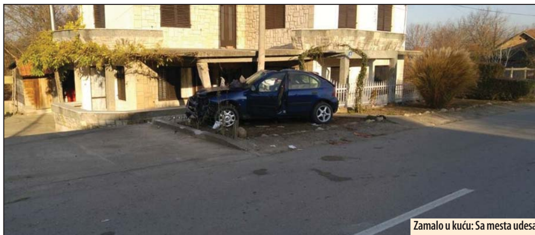
Zamalo u kuću: Sa mesta udesa

krivičnu prijavu zbog teškog dela protiv bezbednosti javnog saobraćaja. Prema nezvaničnim podacima, mladići su, u pripitom stanju, nakon provala u Oreovici, krenuli u Aleksandrovac na doručak. Međutim, pekara je bila zatvorena, pa su produžili za Požarevac i samo par kilometara dalje nastradali. S njima je tokom noći bio još jedan mladić, ali je on izašao iz auta, ne želeći da se vozi s njima jer su bili pod uticajem alkohola. M. V.