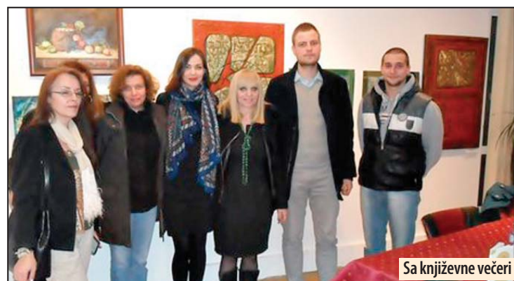
Sa književne večeri