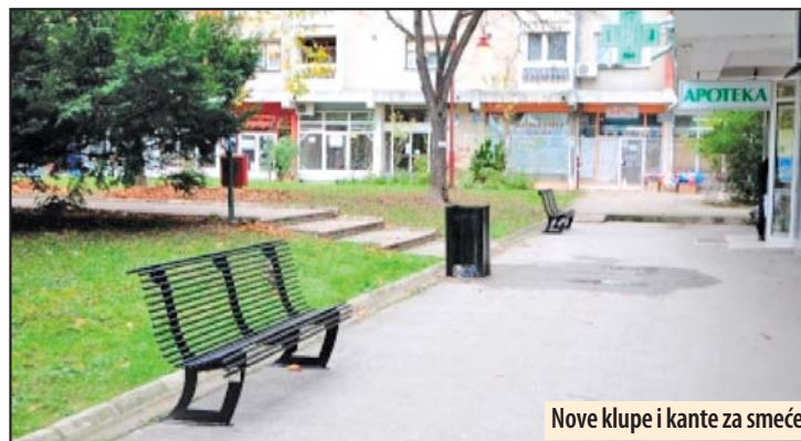
Novo klupe i kante za smeće

Kostolac - Na području grada Kostolca završena je druga faza postavljanja i ugradnje novih klupa i korpi za otpatke. Nove metalne klupe postavljene su na više lokacija u gradu i to na Trgu bratstva i jedinstva, zatim u ulicama: Nikole Tesle, Saveza boraca, Rudarskoj, Stevana Nemanje kao i ispred stambenih zgrada u Jadranskoj ulici.