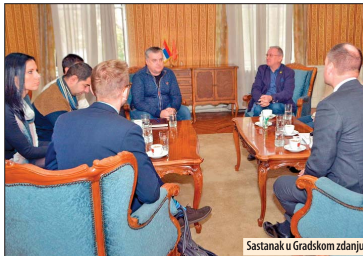
Sastanak u Gradskom zdanju

Zahvaljujući Helpu i švedskoj agenciji za međunarodni razvoj SIDA, u Požarevcu je ove i prošle godine pomoć dobilo 56 nezaposlenih. Njima je