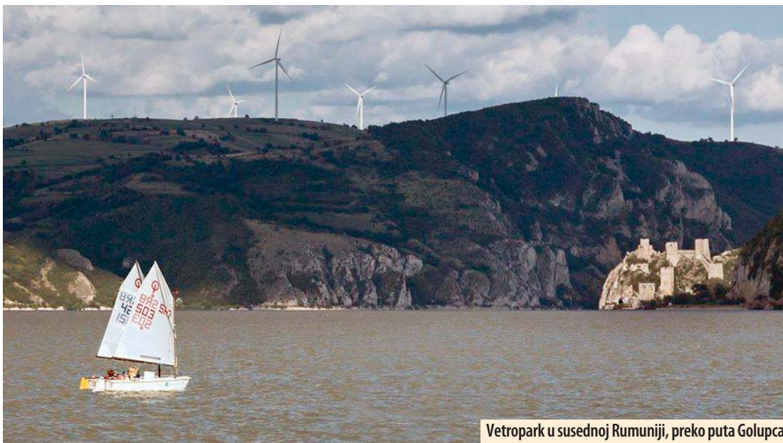
Vetropark u susednoj Rumuniji, preko puta Golupca

Ako govorimo o povećanju zapošljavanja odnosno o smanjenju brojne armije nezaposlenih, eto malog doprinosa kroz program „Zakrpa na zakrpu“.