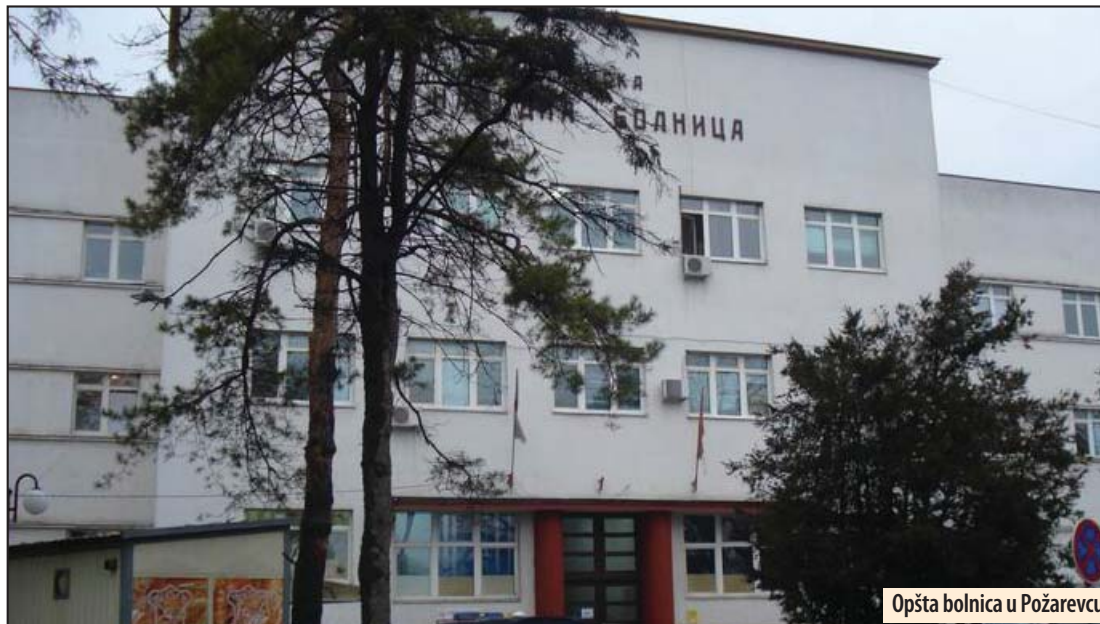
Opšta bolnica u Požarevcu

Požarevac - Požarevačka policija podnela je krivičnu prijavu protiv B. J. (57) lekara iz Kostolca, zbog osnovane sumnje da je izvršio krivična dela nedozvoljene polne radnje i obljuba zloupotrebom položaja. Krivična prijava protiv osumnjičenog podneta je Osnovnom javnom tužilaštvu u Požarevcu. Za ovo krivično delo zaprećena je kazna od jedne do 8 godina zatvora.