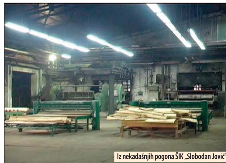
Iz nekadašnjih pogona ŠIK „Slobodan Jović“