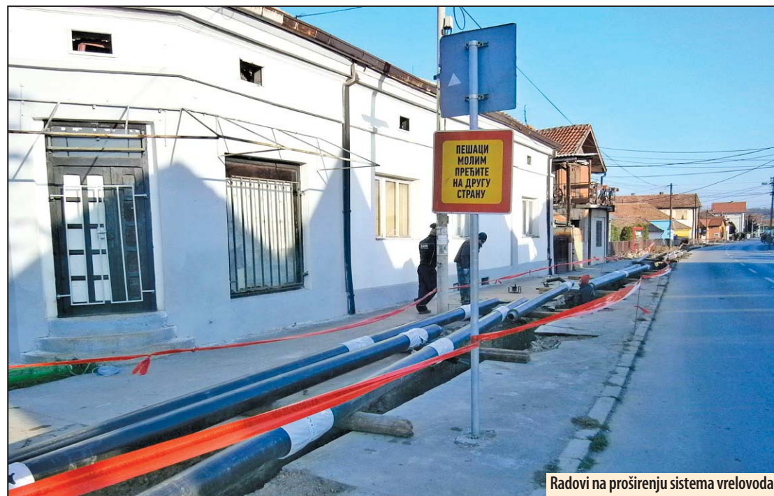
Radovi na proširenju sistema vreloвода

Javno preduzeće „Toplifikacija“ isporučuje svojim korisnicima energiju za grejanje tokom 24 sata dnevno. Nema noćnih prekida u grejanju, a sistem je, nakon početnih problema, u potpunosti stabilizovan i kostolačke termoelektrane konstantno isporučuju dovoljne količine energije. Na sporadične probleme na mreži, ekipe „Toplifikacije“ momentalno reaguju pa se kvarovi otklanjaju, potvrdio je Nenad Mišić rukovodilac sistema za prenos, održavanje i distribuciju u ovom javnom preduzeću.