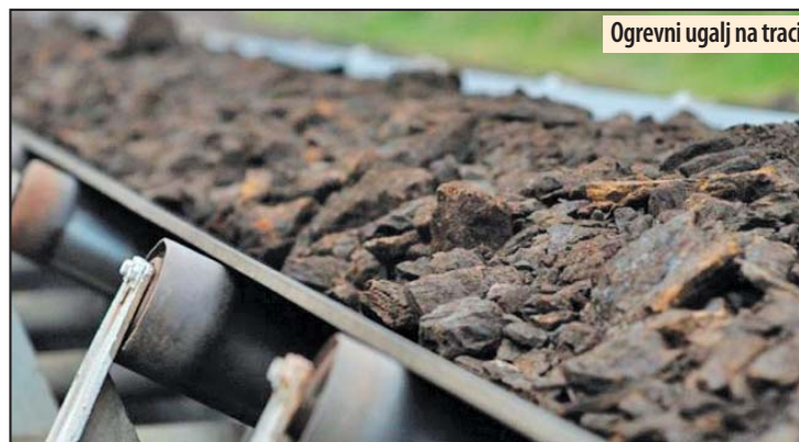
Ogrevni ugalj na traci