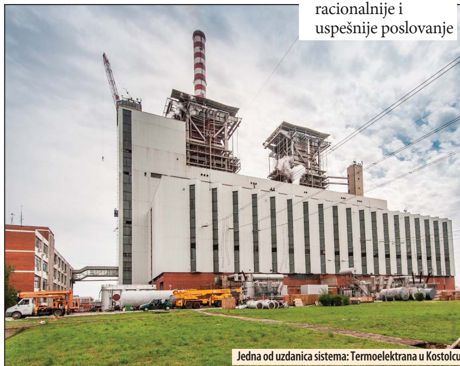
Jedna od uzdanica sistema: Termoelektrana u Kostolcu

Zahvaljujući efikasnijem poslovanju manji su i troškovi goriva, za 28 odsto u odnosu na plan, odnosno za 1,5 milijardi dinara. Za čak 44 odsto umanjeni su poslovni rashodi koji se tiču transporta, reprezentacije, komunalnih i ostalih usluga. Poboljšana je i naplata utrošene električne energije, a ste-