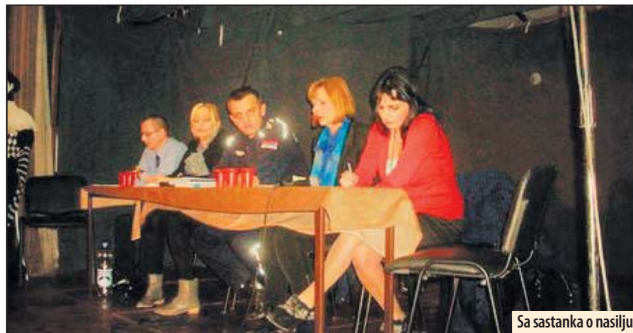
Sa sastanka o nasilju

Požarevac - Nasilje nad ženama je opšti problem društva, a ne samo pojedinaca koji su pogodoeni, istaknuto je na sastanku kojim se Požarevac pridružio obeležavanju Međunarodnog dana protiv nasilja nad ženama. UN su posebnom rezolucijom potvrdile 25. novembar kao Međunarodni dan borbe protiv nasilja nad ženama, u znak sećanja na sestre Mirabel iz Dominikanske Republike, koje je brutalno ubio diktator Rafael Trujillo 1999. godine.