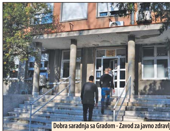
Dobra saradnja sa Gradom - Zavod za javno zdravlje

Što se tiče javnih česmi, one su nestabilni alternativni vodni objekti. Preporuka je koristiti za piće vodu iz gradskog vodovoda, koja je higijenski ispravna i zdravstveno bezbedna. Tokom 2016. godine nije kontrolisan kvalitet vode na javnim česma zato što nije potpisan ugovor sa Gradom Požarevac, ali se potpisivanje očekuje u 2017. godini.