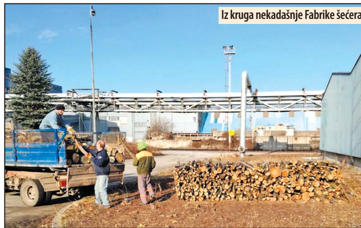
Iz kruga nekadašnje Fabrike šećera

Požarevac - Počela je raspodela drva za ogrev socijalno ugroženim licima na teritoriji grada Požarevca. Ogrev je ovom prilikom obezbeđen za 16 porodica sa spiska požarevačkog Centra za socijalni rad. U pitanju je ukupno 40 kubnih metara drva koja su obezbeđena nakon krčenja dela kruga nekadašnje Šećerane.