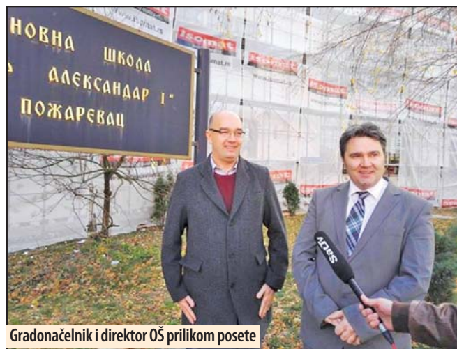
Gradonačelnik i direktor OŠ prilikom posete

- Svi direktori i menadžeri javnih ustanova koji su pametnim rukovođenjem novca iz našeg budžeta uspeali da obezbede uštede gradskoj kasi, taj ušteđeni novac, uz nova sred-