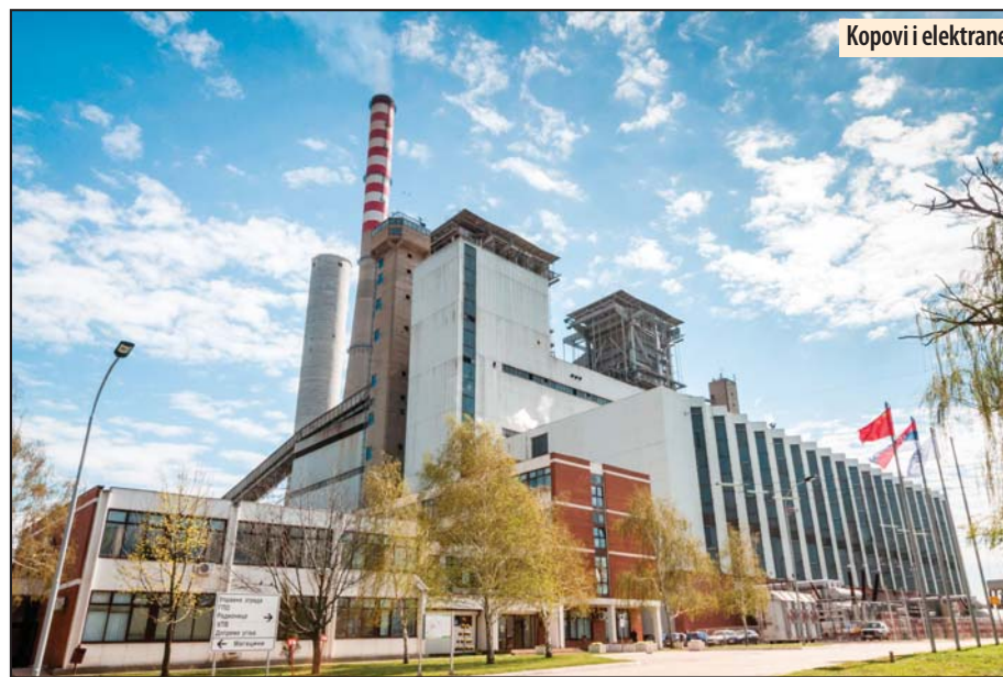
Kopovi i elektrane

Kostolac - Ogranak „TE - KO Kostolac“ uspešno je prošao kontrole sistema menadžmenta kvalitetom ISO 9001:2008 i sistema upravljanja energijom EnMS/ISO 50001 i dokazao da primenjuje najviše međunarodne standarde upravljanja, izveštava list „EPS Energija“.