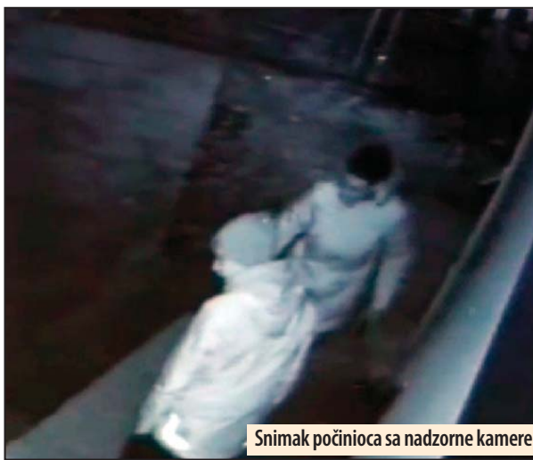
Snimak počinioca sa nadzorne kamere