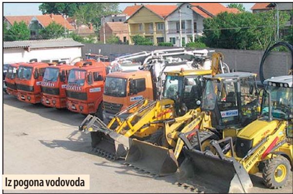
Iz pogona vodovoda

šnih, navodi se u saopštenju požarevačke policije. „Realizujući radove, radnici „Vodovoda“ unosili su znatno veće količine utroška šljunka i peska, koji prethodno nije nabavljen, već je iskorišćen od ranijih iskopa. Nadzorni organi terete se za propuštanje dužnog nadzora i nesavesno postup-