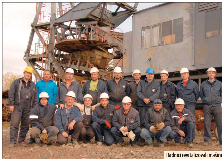
Radnici revitalizovali mašinu

su angažovani na zameni reduktora radnog točka na bageru „SRs 2000/28/3“ na kopu „Drmno“. Posao je završen nedelju dana pre dogovorenog roka, a bager, za sada ostvaruje dobre proizvodne rezultate. Z. V.