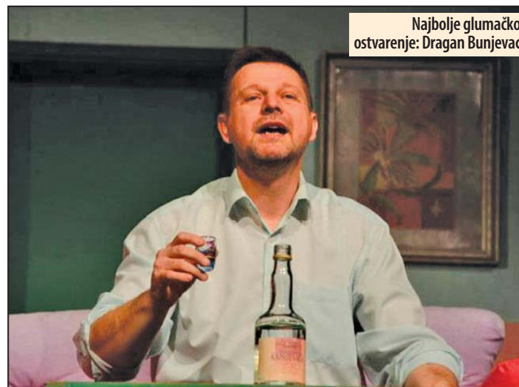
Najbolje glumačko ostvarenje: Dragan Bunjevac

Kao hroničar svog vremena, Đaković je uspeo je da za trenutak zaustavi prolaznost starog i ugradi fluid prošlosti u drveni ram. Umetnik Lazar Đaković je takođe održao i kratki kurs o izradi slika na furniru i izrazio želju da dobije učenike, koji bi nastavili ovu interesantnu umetnost. Intarzija je umetničko ukrašavanje predmeta od drveta umetanjem parčića drveta i drugih materijala u raznim bojama, tako da budu u istoj ravni sa podlogom. Najčešće korišćeni materijal je furnir (tanki listovi od drveta) u debljini 0,6-0,8 milimetara. Furnir se dobija obradom trupaca raznih vrsta drveta. Sama reč intarzija je arapskog porekla, u prevodu znači umetanje. Od 16. veka upotrebljavao se još i sedef, slova kost i metal za ukrašavanje (inkrustacija) nameštaja, poslužavnika... Z. V.