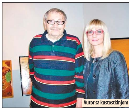
Autor sa kustostkinjom