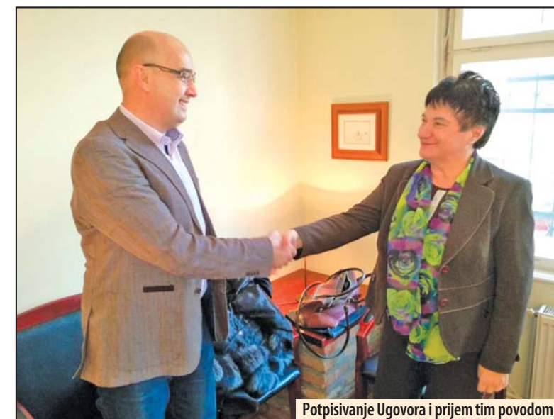
Potpisivanje Ugovora i prijem tim povodom

Potpisan Ugovor o prenosu javne svojine bez naknade