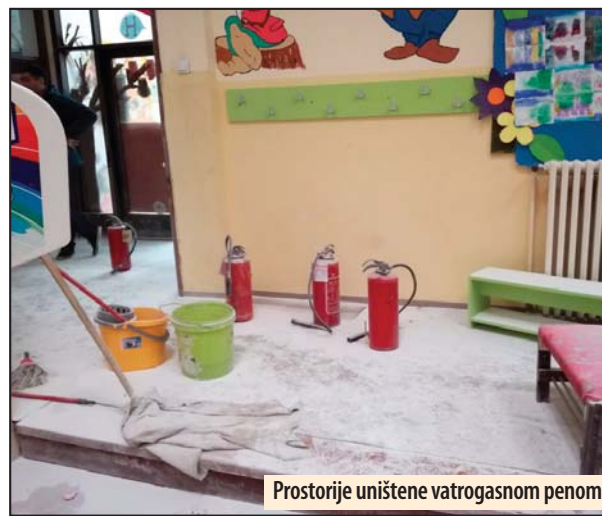
Prostorije uništene vatrogasnom penom

Otkriveni huligani koji su devastirali objekat Predškolske ustanove „Ljubica Vrebalov“