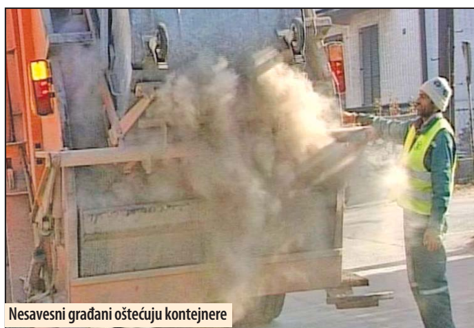
Nesavesni građani oštećuju kontejnere

Komunalno preduzeće ima obavezu da iznosi pepeo, iako nije komunalni otpad, ali pojedini građani bacaju ga dok je još vruć, pa dolazi do paljenja kontejnera čak dva, tri puta nedeljno, kažu zaposleni. Iz Komunalne službe apeluju na građane da čuvaju ono što imaju, jer uskoro stiže 280 novih kontejnera za Požarevac i Kostolac u vrednosti od 12 miliona dinara. U zajed-