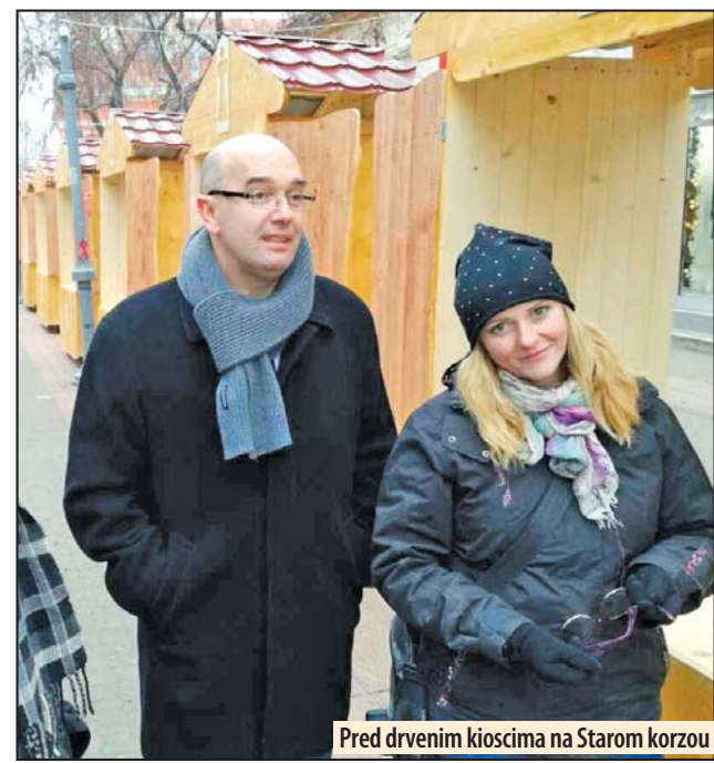
Pred drvenim kioscima na Starom korzou

ovih glavnih i veoma značajnih saobraćajnica u gradu. Žao mu je što je u prethodnom periodu bilo problema u saobraćaju zbog radova na ovim lokacijama, ali je bilo od velike važnosti da se ove saobraćajnice završe.