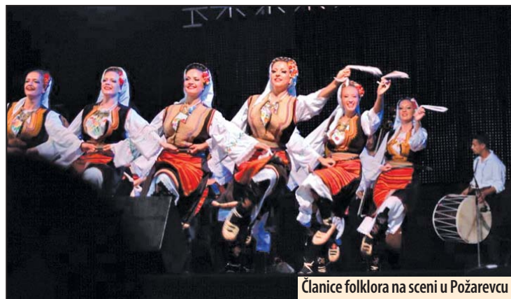
Članice folkloru na sceni u Požarevcu

OŠ „Kralj Aleksandar I“ obeležava svoj dan čitave nedelje