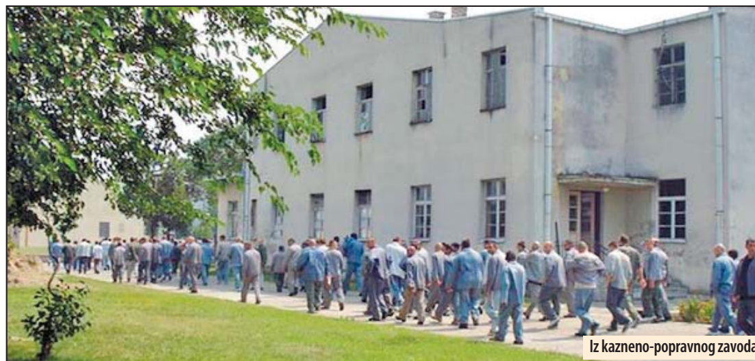
Iz kazneno-popravnog zavoda

■ Uprava ima rok od 90 dana da postupi po nalogima i o tome sačini izveštaj