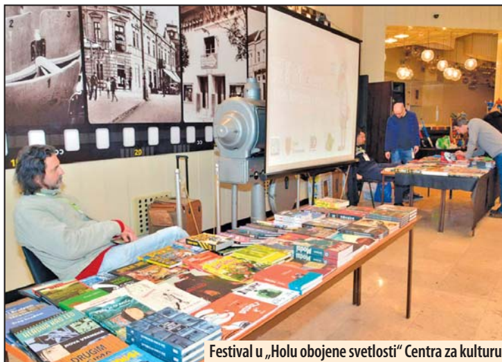
Festival u „Holu obojene svetlosti“ Centra za kulturu