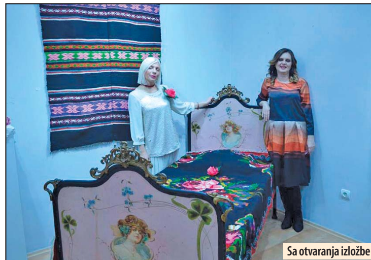
Sa otvaranja izložbe

Nesvakidašnja etnografska izložba u galeriji Zavičajnog muzeja u Petrovcu