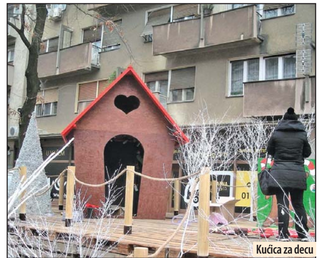
Kućica za decu

Ona je bila autor i prošlogodišnje dekoracije, kada su na Trgu oslobođenja, umesto skupe jelke, kao što je bio slučaj ranijih godina, postavljeni irvasi i novogodišnji paketići izrađeni od otpadnog metala i svetlećih gumenih creva. Novogodišnja dekoracija u vidu du jelki od metalnih cevi i novogodišnjih paketića, postavljena je i u Sunčanom parku, a svetlećom dekoracijom ukrašen je i Trg Radomira Vujovića. U Tabakoj čaršiji, iznad ulice, okačeni su unikatni svetleći ukrasi u vidu Sneška Belića, bomba, lilihipa, zvezde, kape, kišobrana, izrađeni po zamisli i po nacrtima savetnice gradonačelnika. Ukrašavanje centra grada nastaviće se i narednih dana. Kod gradske fontane postavice se i drvene kućice za decu, koje su izradili osuđenici Kazneno-popravnog zavoda „Zabela“, u svom proizvodnom pogonu „Preporod“.