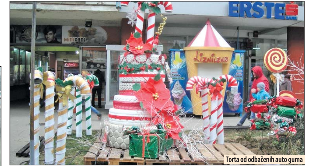
Torta od odbačenih auto guma

Gradska uprava dokazuje da novogodišnje ukrašavanje grada ne mora da bude skupo