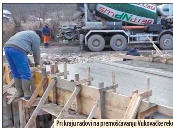
Pri kraju radovi na premošćavanju Vukovačke reke

Poučeni iskustvom iz ostalih naselja u vreme poplava, odlučili smo da i meštanima Vukovca izađemo u susret i trajno rešimo višedecenijski problem. Na inicijativu Mesne zajednice „Borac“ Vukovac, finansirana je gradnja propusta koji ima višestruku funkciju kako za građane koji žive sa druge strane reke, tako i za ostale stanovnike koji imaju imanja i parcele. Nastavićemo i dalje da ulažemo u infrastrukturu svih naselja na teritoriji opštine, istakao je prilikom