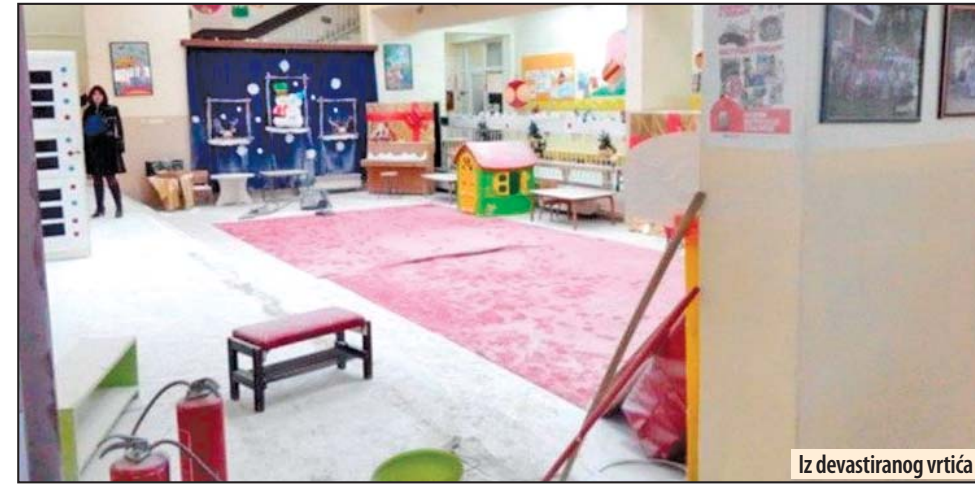
Iz devastiranog vrtića

Povodom nedavnog demoliranja vrtića u Požarevcu