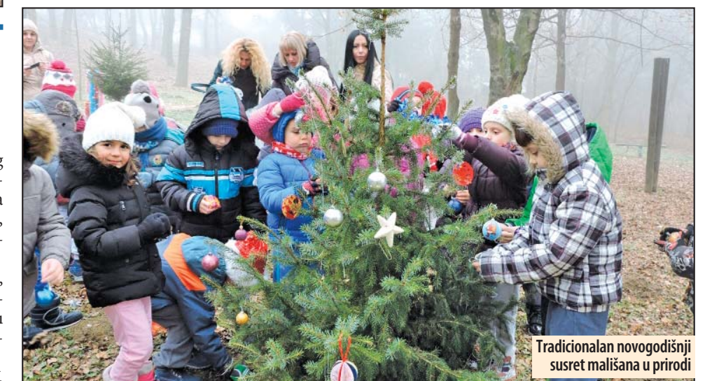
Tradicionalan novogodišnji susret mališana u prirodi