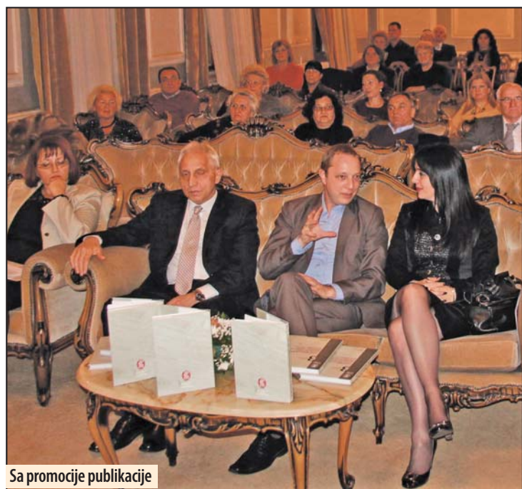
Sa promocije publikacije

naslova „Dvor i porodica knjaza Miloša u Požarevcu, 1825 - 1839. godine“, nastavljena je publikovanjem naslova „Nahijski sud Požarevac, 1821 - 1839.“ i „Zapisnici sa sednica organa Okružnog Narodnooslobodilačkog i Narodnog odbora Požarevac, 1944 - 1947.“ Objavljivanjem dela sadržaja ovog fonda naučnoj, stručnoj i široj javnosti omogućeno je istraživanje događaja iz savremene zavičajne istorije.