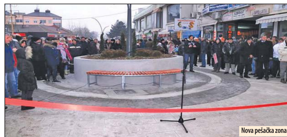
Nova pešačka zona

Ove priloge je sufinansirala Opština Petrovac na Mlavi