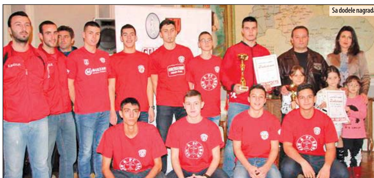
Sa dodele nagrada

- Partnerstvo između Sportskog saveza grada Požarevca i lista „Reč naroda“ u ovoj akciji sasvim je prirodno. Sportski savez