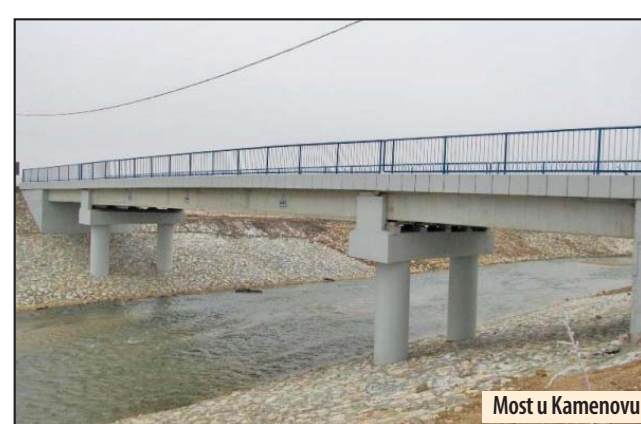
Most u Kamenovu

- Projekat rekonstruisanja pešačke zone bio je veliki izazov, počevši od ideja, preko finansija pa do samog izvođenja radova. Mnogi nisu verovali u nas, ali to što smo danas ovde u prilici da je svečano otvorimo, dokaz je da smo uspešli i pored loših vremenskih uslova, koji su nam