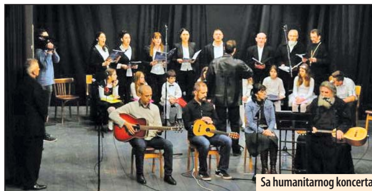
Sa humanitarnog koncerta