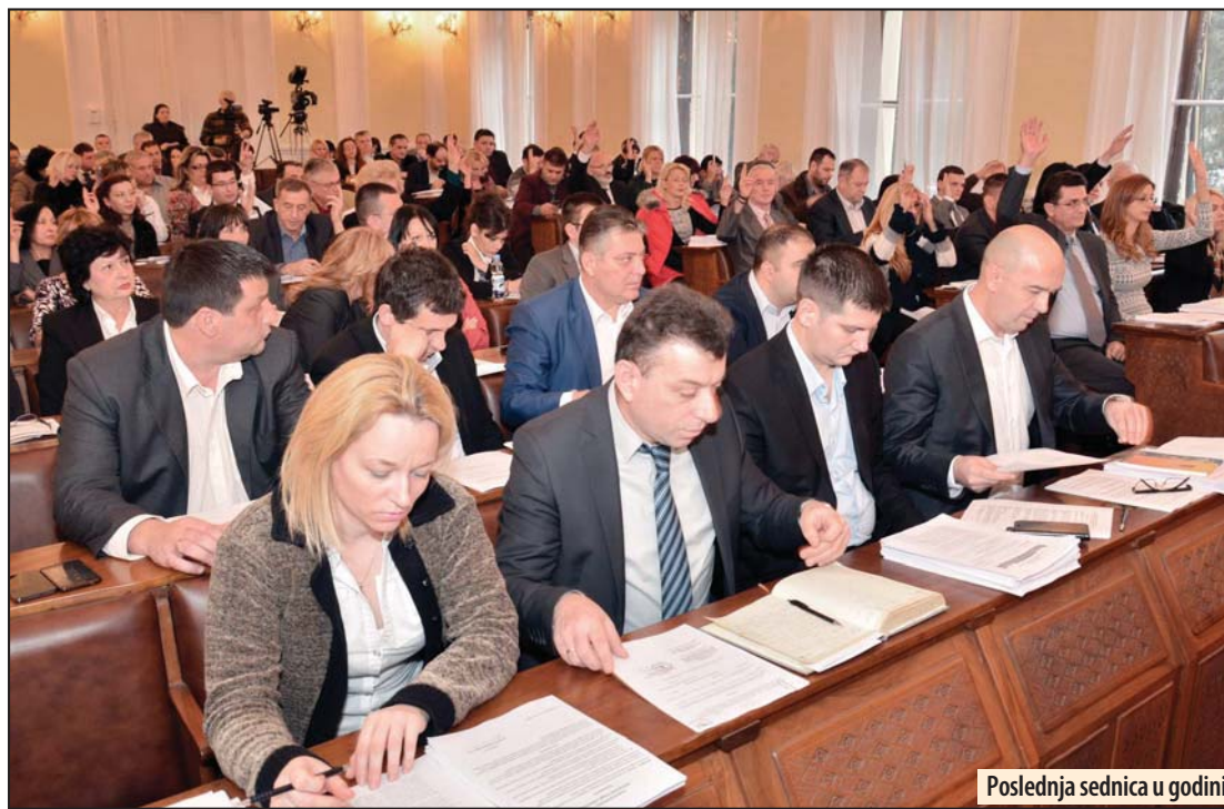
Poslednja sednica u godini

Prilično polemike izazvala je tačka koja se odnosila na davanje saglasnosti na cenovnike javnih preduzeća čiji je osnivač grad i to: JKP „Komunalne službe“, JKP „Vodovod i Kanalizacija“ i JKP „Parking servis“. Nekoliko odbornika iz redova opozicije pokušalo je da nametne zaključak da bi povećanje cena komunalnih usluga bilo udar na budžet građana, u isto vreme navodeći nekoliko gradova u Srbiji gde su cene ko-