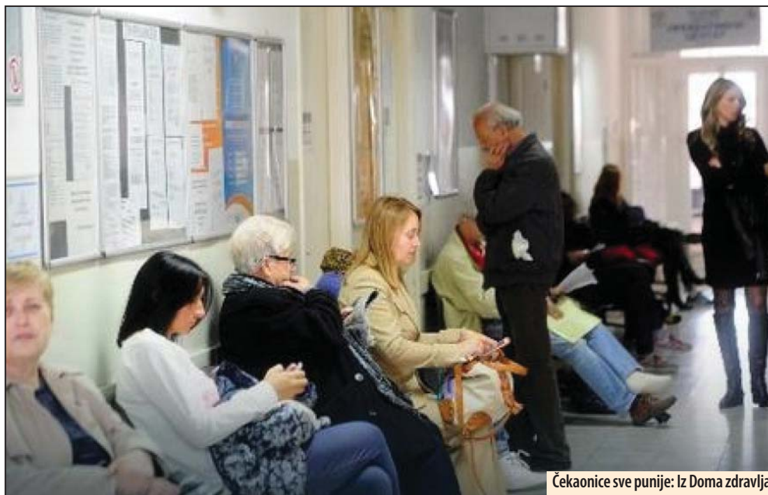
Čekaonice sve punije: Iz Doma zdravlja

U Opštoj Bolnici Požarevac zabranjene posete