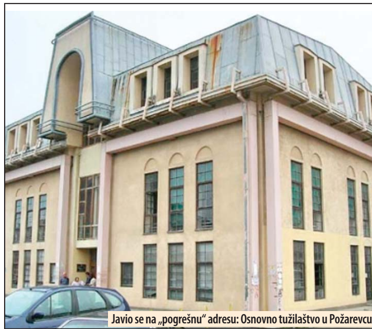
Javio se na „pogrešnu“ adresu: Osnovno tužilaštvo u Požarevcu