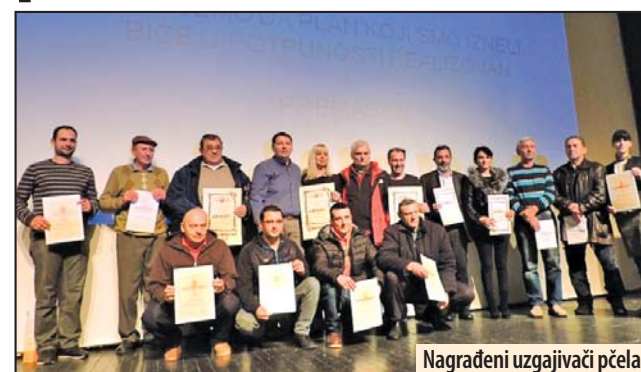
Nagrađeni uzgajivači pčela

Požarevac - Požarevac je postao istinski centar srpskog pčelarstva, što je proisteklo i sa sastankom proizvođača meda i pčelinjih proizvoda u Velikoj sali Centra za kulturu. Održana je 49. Skupština Udruženja pčelara Požarevac, kada su uručene su zahvalnice i povelje najzaslužnijim pojedincima i ustanovama sa kojima je udruženje ostvarilo saradnju.