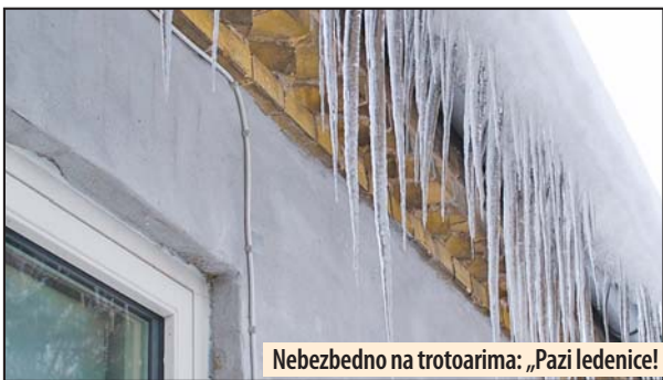
Nebezbedno na trotoarima: „Pazi ledenice!“

Za razliku od trotoara, kolo vozi su dobro očišćeni, pa nema opasnosti od proklizavanja automobila, niti udesa u centru grada. Hladno vreme u Požarevcu nije izazvalo ni poremećaj u radu komunalaca, jer se smeće redovno odvozi, ali je uočena prevelika potrošnja vode, koja