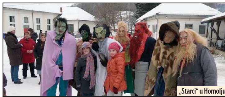
„Starci“ u Homolju

Vukovac - Tradicionalna manifestacija koja okuplja veliki broj posetilaca organizovana je šestu godinu zaredom u homoljskom selu Vukovac nadomak Žagubice, pod nazivom „Starci iz Vukovca“. Turistička organizacija opštine Žagubica uvrstila je ovu manifestaciju u turističku ponudu ovog područja. Starci iz Vukovca ili Maškare nose maske, sakrivaju njima svoj identitet, izvode razne igre, a sve u cilju „teranja“ zlih sila i očekivanju proleća. Ova manifestacija je predhrišćanskog karaktera, obeležava se u različitim krajevima Srbije, i predstavlja nasleđe starih Rimljana.