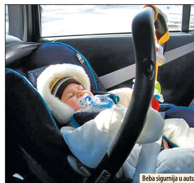
Beba sigurnija u autu

ko milion predmeta, ukupne vrednosti od 159,4 miliona EUR. Tako, tri kategorije u kojima je prodan najveći broj artikala su mobilni telefoni, kompjuterska oprema i kućni aparati i elektronika. Pored toga, značajan broj proizvoda prodan je u kategoriji auto opreme, kao i obuće i odeće. Razmenjeno je čak 21,68 miliona poruka tokom 2016. na ovom sajtu. Gledajući ukupnu vrednost prodane robe po kategorijama, najviše novca (643.790.165,82) je