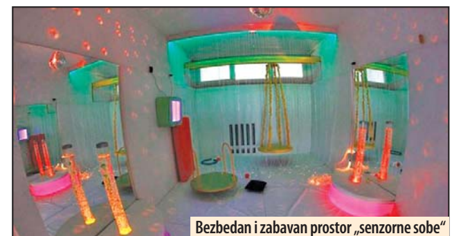
Bezbedan i zabavan prostor „senzorne sobe“

To su deca sa poremećajima iz autističnog spektra, deca sa ADD i ADHD, deca sa mentalnom nedovoljnom razvijenošću, sa senzornim oštećenjima, govornim poteškoćama, smetnjama u učenju, problemima u ponašanju. Efekti koje donosi rad u senzornoj sobi su poboljšanje pažnje, selekcija i učenje o raznovrsnim dražima, poboljšanje komunikacije, smanjenje stereotipnih ponašanja. Z. V.