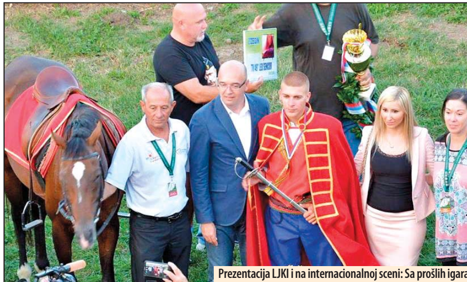
Prezentacija LJKI i na internacionalnoj sceni: Sa prošlih igara

U Berlinu se do sada uspešno predstavljao Beograd, u koji je proteklih godina sve više turista dolazilo upravo iz Nemačke. Požarevac će svakako prikazati Ljubičevske konjičke igre, a direktorka Turističke organizacije, kaže da će mnoge stvari zavistiti i od budžeta.