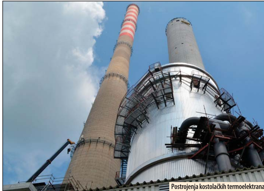
Postrojenja kostolačkih termoelektrana

Služba za upravljanje životnom sredinom u kostolačkom ogranaku EPS-a radi i zbrinjavanje otpada. Jedan deo prodaje se ovlašćenim operaterima koji imaju rešenje ministarstva da se bave zbrinjavanjem, reciklažom i drugim vidovima tretmana otpada. Ostatak, koji se ne proda, zbrinjava se po osnovu ugovora o poslovno-tehničkoj saradnji, a za jedan deo otpada ogranak „TE-KO Kostolac“ plaća operaterima da ga odnesu sa lokacije.