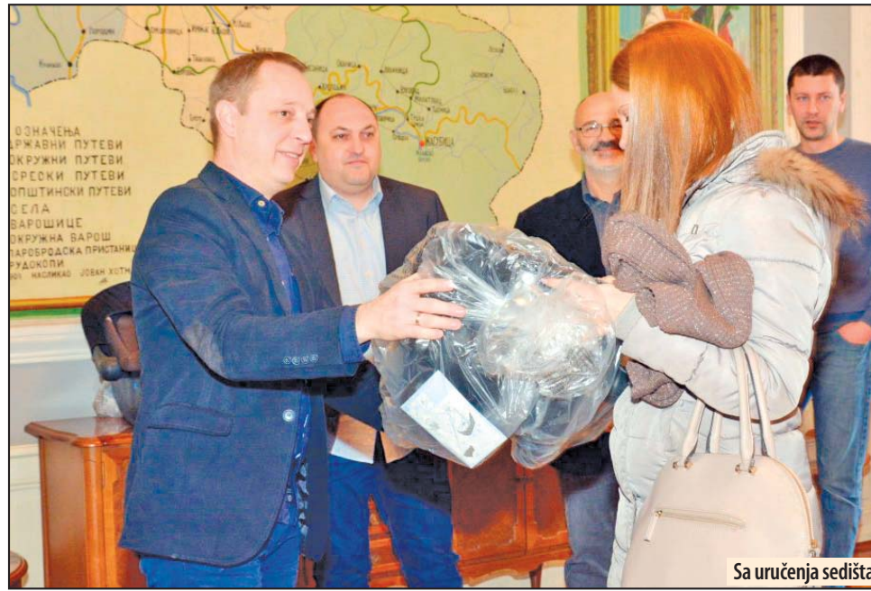
Sa uručivanja sedišta