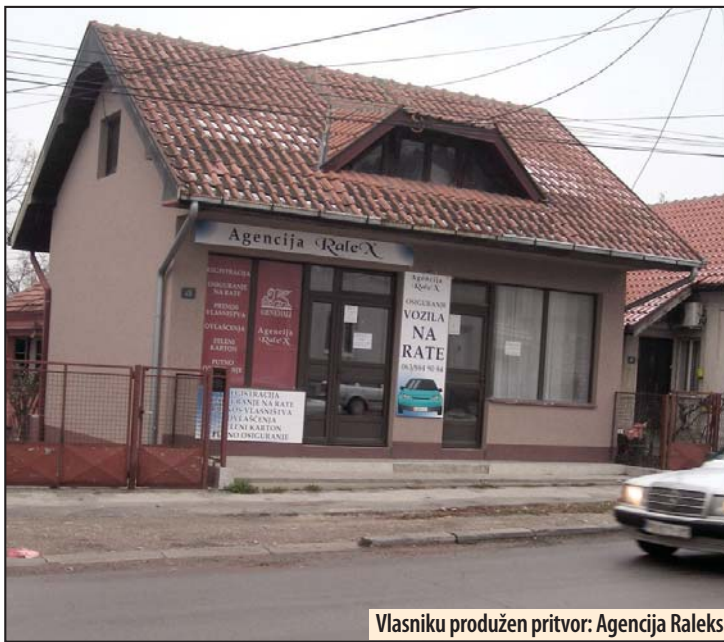
Vlasniku produžen pritvor: Agencija Raleks

Ukoliko se na kraju istrage ispostavi da je budžet Srbije oštećen za veliku sumu, slučaj će preuzeti Više javno tužilaštvo. Ako se utvrdi da je ovaj recept prevare primenljiv i u drugim mestima u Srbiji, to će značiti da se radi o organizovanom kriminalu, pa će tada biti nadležan Specijalni sud.