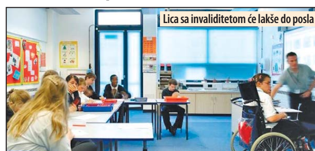
Lica sa invaliditetom će lakše do posla

Neke od mera i aktivnosti za realizaciju akcionog plana su prik-