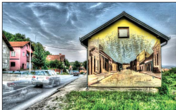
Neki od murala u gradiću na reci Pek