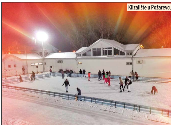
Klizalište u Požarevcu

- Drugog dana rada klizališta, pod reflektorima je u jednom