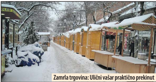
Zamrla trgovina: Ulični vašar praktično prekinut

Najteža je situacija sa grejanjem, zbog gotovo svakodnevnih intervencija na toplovodu, pa pojedini delovi grada ostaju hladni od pet do osam sati. Korisnici se nadaju da će im i računi biti smanjeni, kao što se dogodilo na početku grejne se-