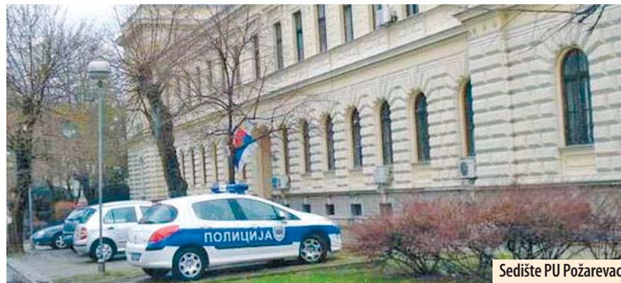
Sedište PU Požarevac

Požarevac - U kontroli saobraćaja sprovedenoj prethodne sedmice na području Braničevskog okruga, policija je izrekla novčane kazne za 626 vozača, uglavnom zbog prebrze vožnje i nekorisćenja sigurnosnog pojasa. U istom periodu podneto je i 95 prekršajnih prijavi, od kojih je većina, takođe, zbog prebrze vožnje. Iz saobraćaja su isključena tri alkoholisana vozača, od kojih je najviše alkohola u krvi - 1,74 promila, imao D.S. iz Pečanice. Prethodne sedmice vozači su izazvali 10 udesa, u kojima je jedna osoba poginula, tri su zadobile teže, a pet lakše povrede. Uzrok ovih udesa bili su prebrza vožnja, nedržanje odstojanja među vozilima i vožnja pod dejstvom alkohola. M. V.