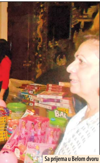
Sa prijema u Belom dvoru

jedno divno druženje sa decom iz cele Srbije. Princeza je izrazila simpatije prema našem Udruženju i biće nam drago da nas i ubuduće pozivaju na ovakve i slične događaje.