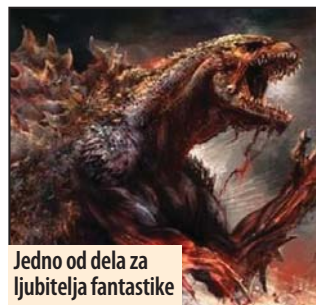
Jedno od dela za ljubitelja fantastike

Kostolac – Večeras možete naučiti kako se pišu priče na temu fantastike ako posetite biblioteku u Kostolcu gde se održava novo druženje „fantastičara“. Zadatak tema su prve dve rečenice priče koje učesnici treba da nastave, dok ne uobličie čitavu priču. Rečenice su: Probudio/la sam se u šumi, ležeći u pidžami... Ne znam kako sam se tu stvorio/la, ali bilo mi je čudno, jer iznad mene je upravo proleteo zmaj sa jahačem na njemu.. Knjige, serije i filmovi koji se trenutno čitaju i gledaju. „Ljubitelji fantastike – dođite!“ - poručuju iz kostolačkog odeljenja Narodne biblioteke „Ilija M. Petrović“. Druženje počinje 3. februara u 18 i 30 sati.