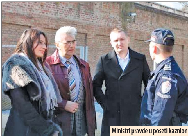
Ministri pravde u poseti kaznionici

Kuburović je napomenula da tome svedoči i to što je jedan od najvećih projekata koje je ministarstvo započelo u 2016. godini upravo izgradnja novog zatvora u Pančevu, koji bi trebalo da bude završen do kraja ove godine. Ona je ukazala da se neće stati samo na tom projektu, s obzirom da će se raditi i na rekonstrukciji