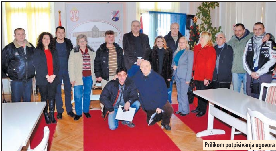
Prilikom potpisivanja ugovora

Ugovore, kojima su za ove po- rodice obezbeđena trajna stam- bena rešenja, potpisalo je sedmo- ro korisnika, na osnovu Sporazu- ma o donaciji, zaključenog izme- đu Banke za razvoj Saveta Evrope i Republike Srbije. Ova dona- cija se odvija u okviru Regional- nog stambenog programa, odno- sno Potprojekta, zaključenog 2015. godine između Komesari- jata za izbeglice, JUP-a Istraživa- nje i razvoj d.o.o. i opštine Veliko Gradište. Po odluci o dodeli ugo-