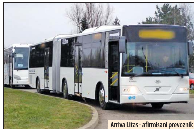
Arriva Litas - afirmisani prevoznik

Novac u budžetu obezbeđen je za plaćanje prevoza u 2017. godini, dok bi troškovi u delu 2018. godine trebalo da se takođe namiruju iz gradske kase, ali to pre svega, zavisi od toga šta će biti predviđeno odlukom o budžetu za narednu godinu. Neki od uslova za ponuđače - prevoznike, koji učestvuju u ovoj javnoj nabavci je da su od 2012. do 2016. godine bili angažovani za usluge prevoza učenika u najmanje pet različitih gradova, opština ili gradskih opština, da raspolažu sa najmanje 20 solo autobusa koji nisu stariji od 10 godina, kao i da u radnom odnosu ima najmanje 30 vozača sa položenom „D“ kategorijom i minimumom od 5 godina iskustva. Z. V.