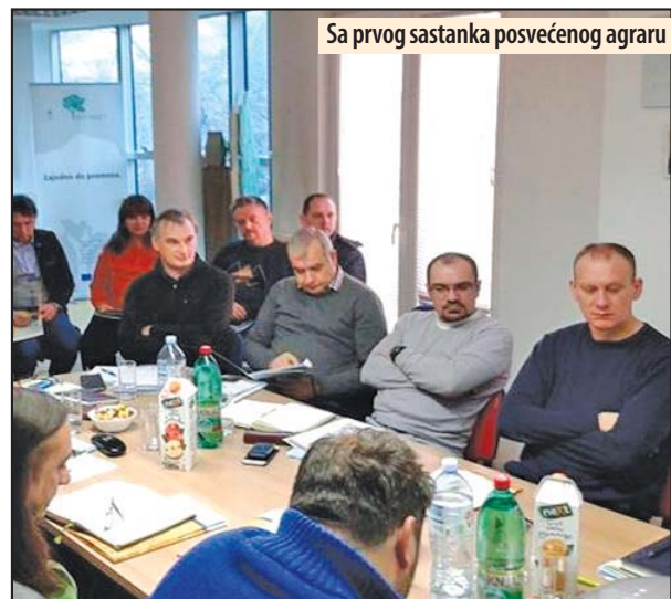
Sa prvog sastanka posvećenog agraru

Želja nam je da Rome uključimo u sve tokove života na području Kostolca, da ih motiviše da se obrazuju, opismenjavaju, da završavaju ne samo osnovnu već i srednju školu, pa i fakultete. Takođe nastojimo da pomognemo svuda tamo gde je moguće uposliti Rome, što ide teško, jer je uopšte zapošljavanje veliki problem u našoj društvenoj zajednici. Prema evidenciji naše Kancelarije, preko 60 mladih Roma u okviru našeg Udruženja sa završenom srednjom školom je bez posla. I ove godine, realizacijom raznovrsnih projekata sa kojima ćemo konkurisati, angažovaćemo se na uređenju naselja, poboljšanju uslova života romske populacije u Kostolcu i uopšte na integraciji Roma u sve tokove društvenog života u našoj lokalnoj zajednici, kaže Alijević. Z. V.