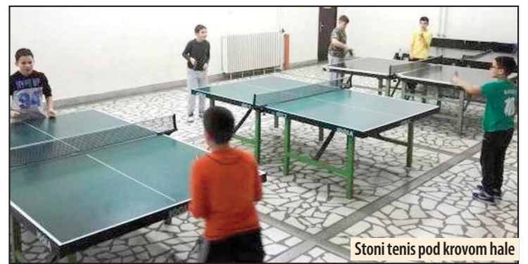
Stoni tenis pod krovom hale

KSC Požarevac predstavio niz programa za vreme zimskih ferija