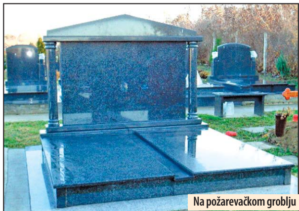
Na požarevačkom groblju

- Od strane Fondacije princeze Katarine pozvani smo da prisustvujemo božićnom prijemu u Belom dvoru što smo sa zadovoljstvom prihvatili. Uspešni smo da obezbedimo prevoz za 30 mališana iz Kostolca kojima smo na taj način upriličili