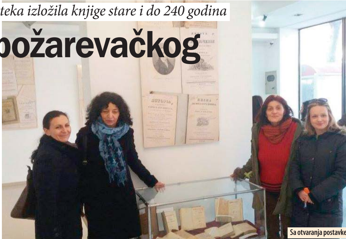
Sa otvaranja postavke