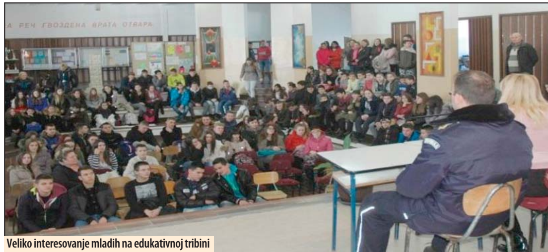
Veliko interesovanje mladih na edukativnoj tribini

Cilj projekta je zaštita i bezbednost dece na Internetu, odnosno upoznavanje korisnika sa opasnostima koje ih vrebaju na društvenim mrežama. Pro-