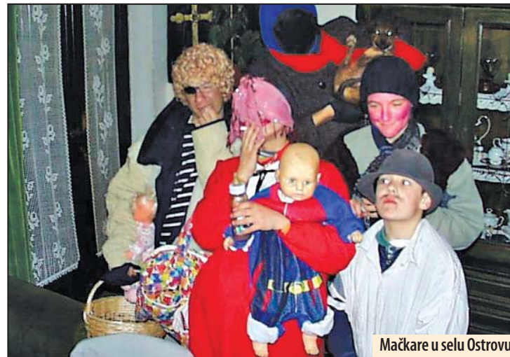
Mačkare u selu Ostrovu

Ranije se kraj zgarista ostajalo čitavu noć, pekli su se krompiri, igralo i pevalo.