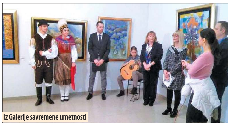
Iz Galerije savremene umetnosti