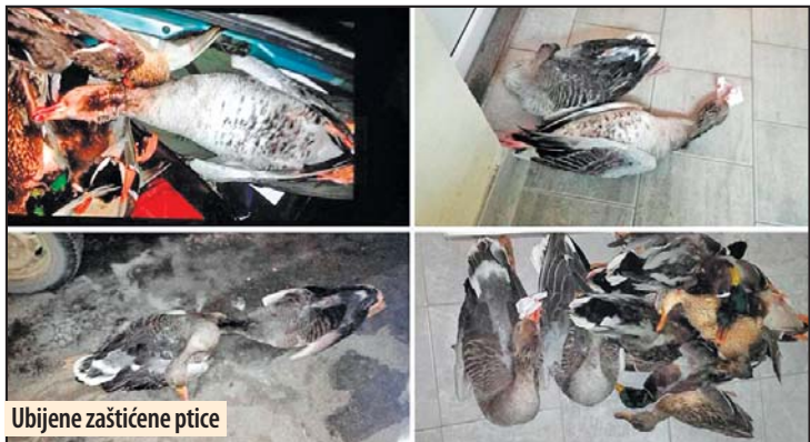
Ubijene zaštićene ptice

U slučaju krivolova u Velikom Gradištu kažnjena samo jedna osoba