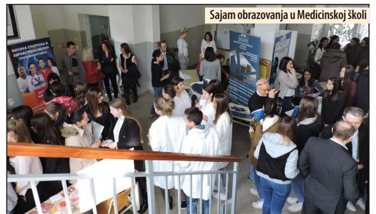
Sajam obrazovanja u Medicinskoj školi

Na sajmu obrazovanja učestvovali su Biološki fakultet Univerziteta u Beogradu, Matematički fakultet Univerziteta u Beogradu, Učiteljski, Stomatološki, Far-