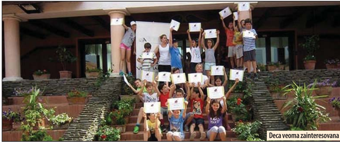
Deca veoma zainteresovana

■ Prostor na kome se kamp odvija predstavlja otvorenu knjigu geologije, arheologije, kulture, umetnosti i istorije