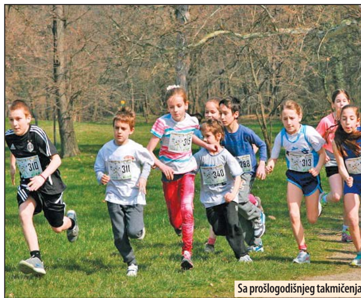
Sa prošlogodišnjeg takmičenja

Prekosutra tradicionalni atletski skup na Srebrnom jezeru