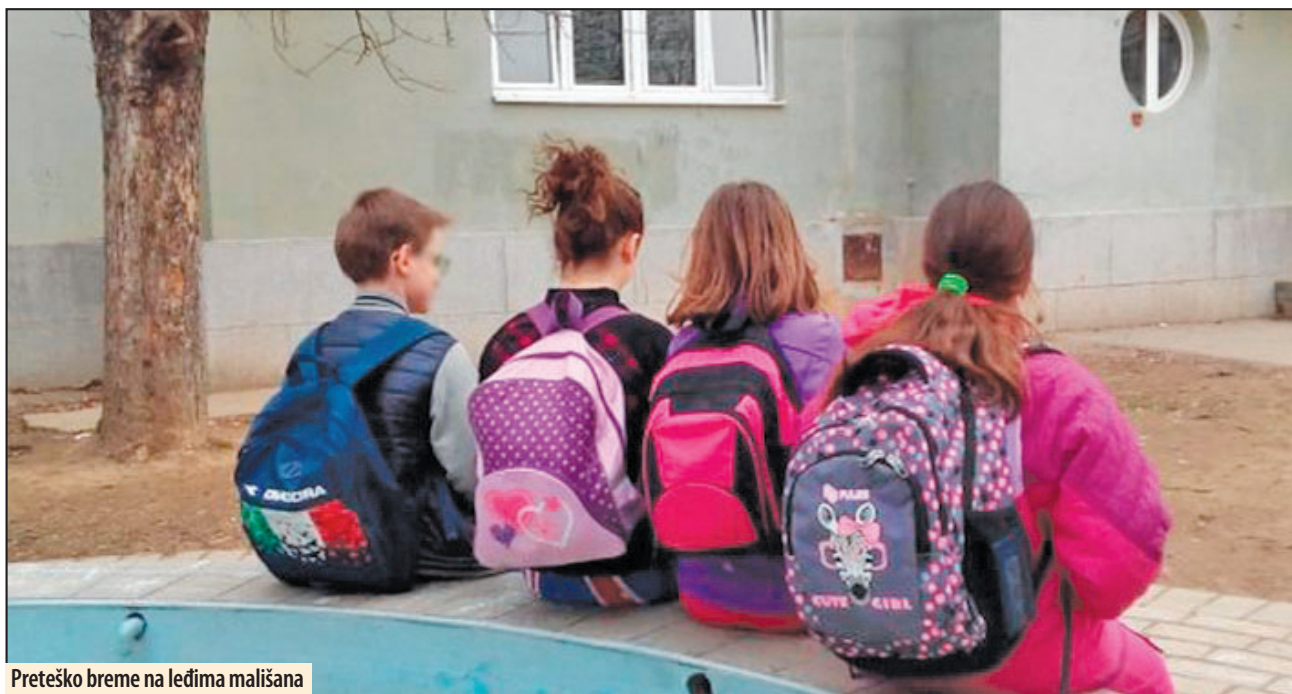
Preteško breme na leđima mališana