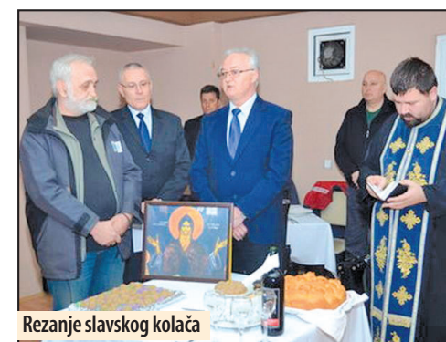
Rezanje slavskog kolača

Prvi put od osnivanja Nacionalni savet Vlaha obeležio svoju slavu