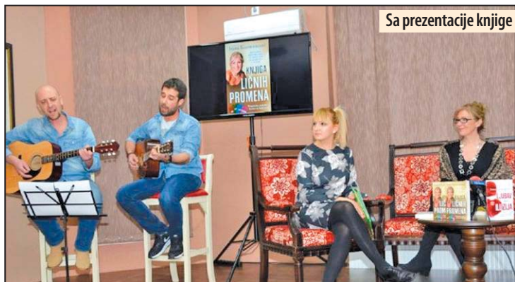
Sa prezentacije knjige

Poklade, priveg i maskirane povorke u Braničevu