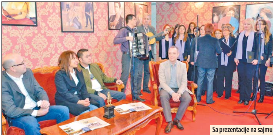
Sa prezentacije na sajmu