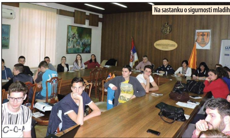
Na sastanku o sigurnosti mladih

Od početka septembra prošle godine je u radionicama učestvovalo više od 600 mladih, sa namerom da se poboljšaju uslovi za njihovu bezbednost na ulici, u provodu, na internetu, u školi. Analizirano je nasilje kao jedna od gorućih tema za koju se starosna granica iz godine u godinu spušta. Pažnja je posvećena i problemima rizičnog seksualnog ponašanja, zloupotrebi psihoaktivnih supstanci