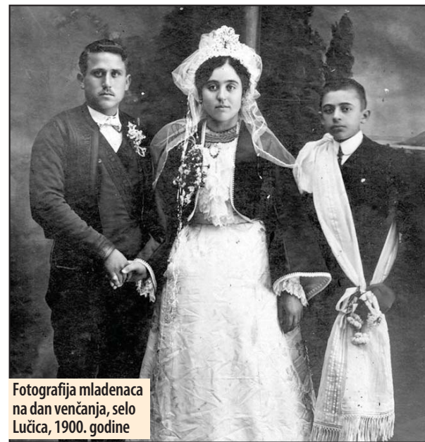
Fotografija mladenaca na dan venčanja, selo Lučica, 1900. godine

Osim preduzimanja određenih mera zaštite od zmijske kao realne i mitološke opasnosti,