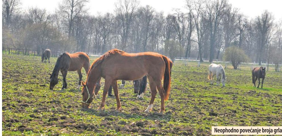
Neophodno povećanje broja grla

Požarevac - Najstarija ergela u Srbiji „Ljubičevo“, zadužbina kneza Miloša Obrenovića, na putu je potpunog oporavka i posle dužeg vremena, u poslednje dve godine ostvarila je uspešno poslovanje sa finansijskim dobitkom. Ova ergela početkom novog milenijuma bila je na putu da se, zbog ogromnih dugovanja koja su nastala u prethodnom periodu, mahom zbog političkih pogrešnih odluka, kao i mnogo druge državne ergela, potpuno ugasi. Međutim, malo-pomalo, uz pomoć lokalne samouprave i nadležnih ministarstva, to se nije desilo, već su ogromni dugovi sanirani, a od kada je pre dve godine na mestu direktora postavljen dr vet. med. Mirko Stojanović ergela posluje „u plusu“.