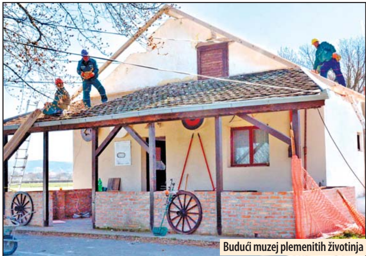
Budući muzej plemenitih životinja

- Pohvalio bih sadašnji Upravni odbor KD „Knez Mihajlo“, koji kada je postavljen zatekao je dug od četiri miliona dinara a sada je u plusu od 1.400.000 dinara, što govori da se odgovornim poslovanjem mogu ostvariti dobri rezultati. Ako nastave sa dobrim poslovanjem biće u mogućnosti da i sami sprovedu investicije, a grad će im pomoći još više. Grad je kao je-