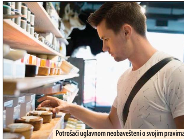
Potrošači uglavnom neobavešteni o svojim pravima

rafu nema ili se ona ne poklapa sa cenom koja kupca dočeka na kasi. Trgovac po zakonu ne sme da da garanciju kraću od zakonske (dve godine), niti da šalje SMS poruke i kataloge na ime potrošača bez njegove prethodne saglasnosti. Građani imaju pravo da prijave i kada vide da trgovac detetu ili maloletniku prodaje cigarete i alkoholna pića, ali u praksi na to gotovo niko ne obraća pažnju, a trgovci retko traže legitimaciju od nekoga za koga posumnjaju da je maloletan. Prodavac je obavezan da na reklamaciju odgovori u roku od osam dana i reši je u roku od 15