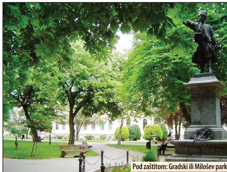
Pod zaštitom: Gradski ili Milošev park

Gradski park je, inače, poznat i kao Milošev jer se u njegovom središtu nalazi spomenik ovom knezu iz dinastije Obrenović, rad vajara Đorđa Jovanovića. Spomenik je 1898. godine, u prisustvu svog oca Milana, otkrio kralj