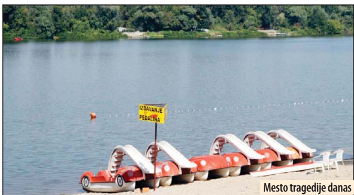
Mesto tragedije danas

Prilikom saslušanja, vlasnici pedaline rekli su da nisu bili upoznati sa načinom registracije pedalina, kao i da su samo površno upoznati s tim da moraju da imaju spasilačke prsluke. Rekli su