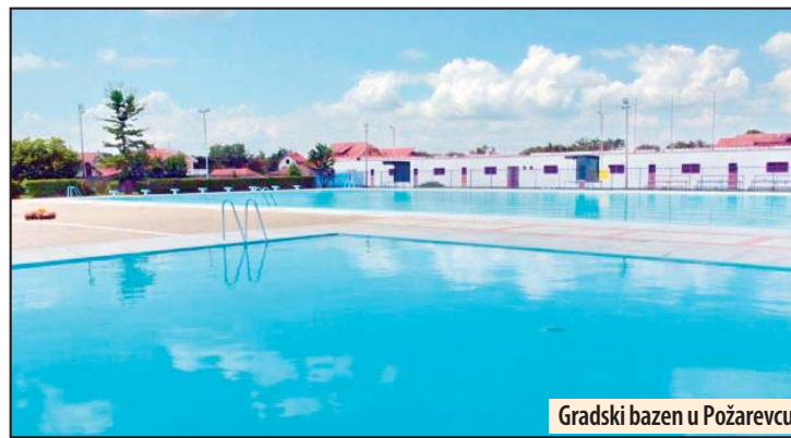
Gradski bazen u Požarevcu