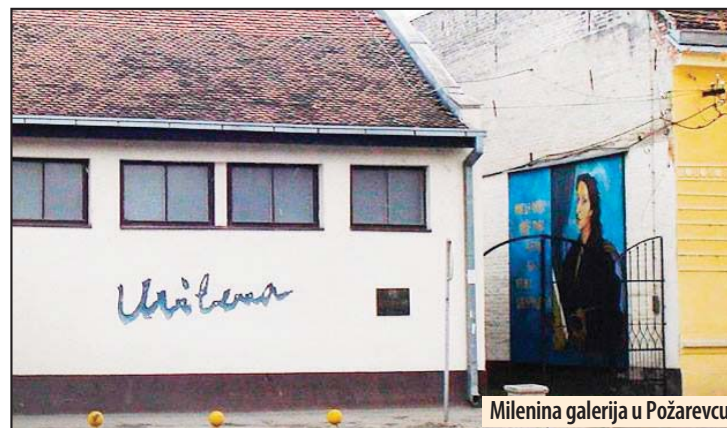
Milena galerija u Požarevcu

Raspisan nagradni konkurs za galeriju Milene Pavlović Barili