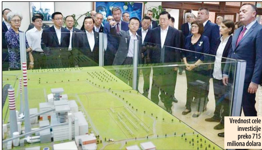
Vrednost cele investicije preko 715 miliona dolara