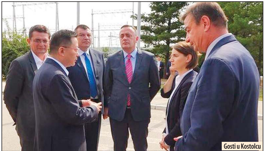
Gosti u Kostolcu

Kostolac - Zahvaljujući saradnji Elektroprivrede Srbije sa partnerima iz Kine, u energetskom kompleksu kod Kostolca postignut je evidentan napredak pri čemu se posebno ističu: smanjenje emisije štetnih gasova i stvaranje uslova za izgradnju novog Bloka B koji bi trebalo da bude završen do 2020. godine.