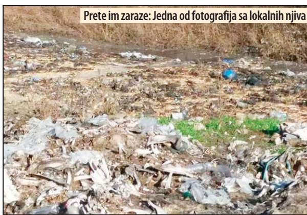
Prete im zaraze: Jedna od fotografija sa lokalnih njiva

Oni su o tome izvestili lokalnu samoupravu u Žabarima, načelnika Braničevskog okruga, komunalnu policiju i nadležne inspekcije, ali rešenje nije nađeno, niti su dobili ikakve odgovore. Zbog toga su se obratili UG „Zavetnici“ iz Žabara, koji su medijima predložili fotografije sa terena, na kojima se