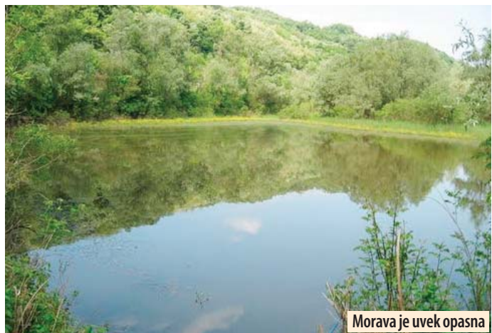
Morava je uvek opasna

Nakon davljenja meštana Aleksandrovca u Moravi