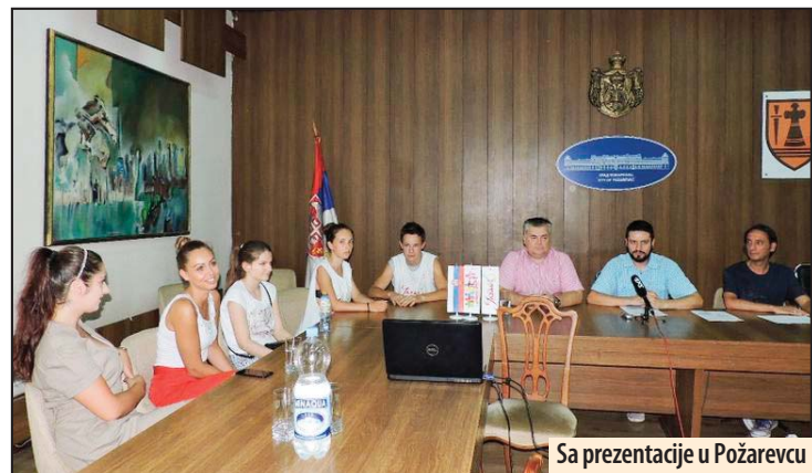
Sa prezentacije u Požarevcu

■ Zainteresovani ideje mogu slati do 18. jula, a trebalo bi da budu sprovedene u periodu od 12. avgusta do 31. oktobra tekuće godine