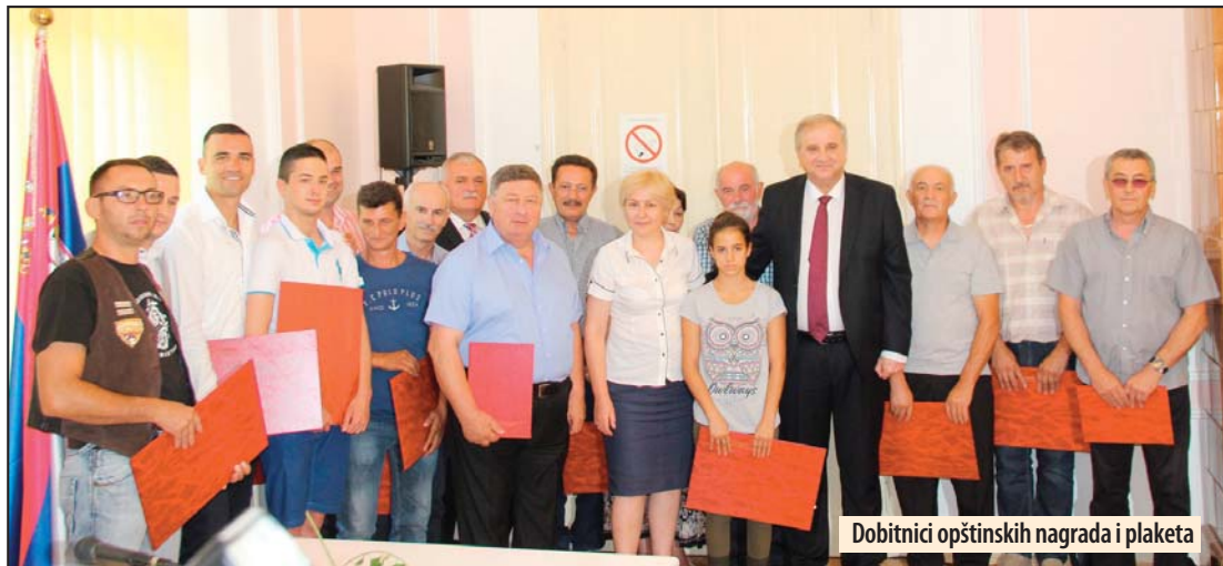
Dobitnici opštinskih nagrada i plaketa

U prošloj godini završeno vodoizvorište „Ostrovo“ u vrednosti od oko 4,5 miliona evra i sada predstoji druga faza, tokom koje voda treba da bude dovedena do svih naselja u Opštini