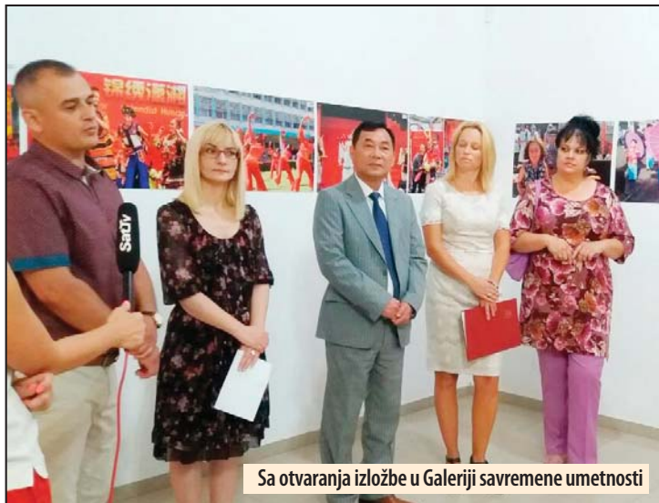
Sa otvaranja izložbe u Galeriji savremene umetnosti

Savetnik za kulturu Ambasade NR Kine u Srbiji, gospodin Sju Hung je istakao da su Kina i Srbija dve tradicionalno prijateljske zemlje, te imamo veoma dobre odnose ne samo u politici već i u privredi i kulturi. Kulturna saradnja naše dve zemlje u po-