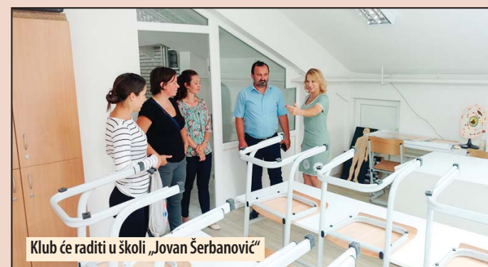
Klub će raditi u školi „Jovan Šerbanović“

Predsednik Skupštine izrazio je zadovoljstvo povodom početka izgradnje Parka nauke i obećao svaku vrstu pomoći u vezi sa obezbeđivanjem i uređenjem prostora kao i svih neophodnih infrastrukturnih radova. Z. V.