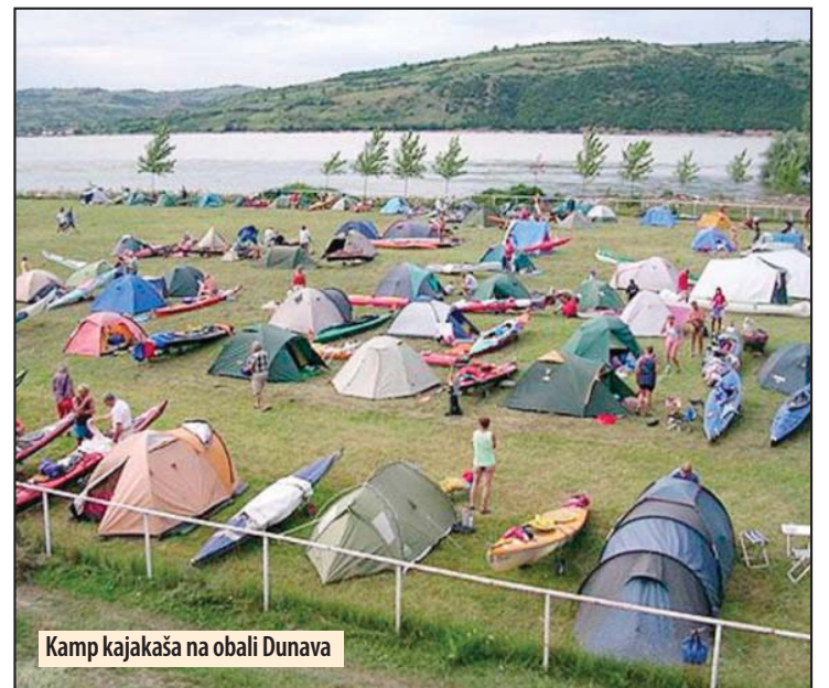
Kamp kajakaša na obali Dunava

Na regati učestvuju veliki broj mladih ljudi iz različitih zemalja koji žele da upoznaju nove predele, kulture, običaje, tradiciju i ljude. Princip regate je dnevno veslanje i noćenje. Kajakaši se mogu priključiti ili isključiti gde žele, u zavisnosti od svoje fizičke