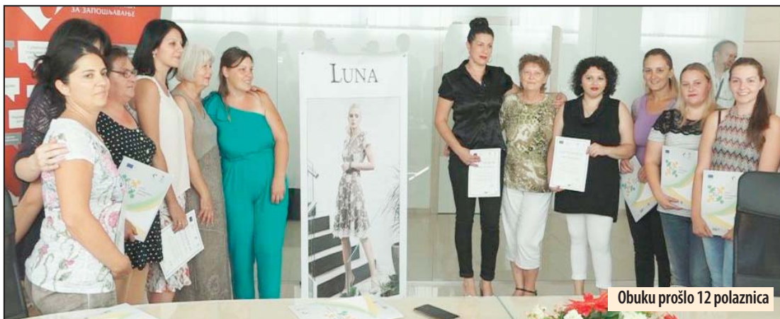
Obuku prošlo 12 polaznica

Požarevac - U prostorijama afirmisane Modne kuće „Luna“ iz Požarevca svečano su uručeni sertifikati polaznicama obuke za krojenje i šivenje koju je, u saradnji sa Nacionalnom službom za zapošljavanje, organizovala ova firma. Intenzivnu obuku za krojenje i šivenje u proizvodnom pogonu t. „Lune“ prošlo je 12 polaznica a od toga je 5 polaznica dobilo i posao. Ovaj projekat je finansirala evropska unija u saradnji sa Nacionalnom službom za zapošljavanje po projektu IPA 2012, u cilju zapošljavanja teže zapošljivih lica.