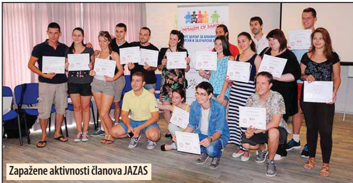
Zapažene aktivnosti članova JAZAS

Najviše novčanih sredstava odobrena je za projekat „Izrada, zamena, popravka u Crkvi Sv. Nikole u Požarevcu“. Ovom projektu je odobreno milion dinara. Za projekat priključka Crkve Sv. Petke u naselju „Busije“ na toplifikacionu mrežu odobreno je 450.000 dinara. Takođe komisija je odobrila proje-