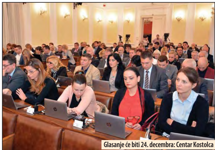
Glasanje će biti 24. decembra: Centar Kostolca

inicijative koju je na referendumu podržalo oko 98 posto njegovih žitelja, čime je povratilo status koji mu je oduzet 54 godine ranije. M. V.