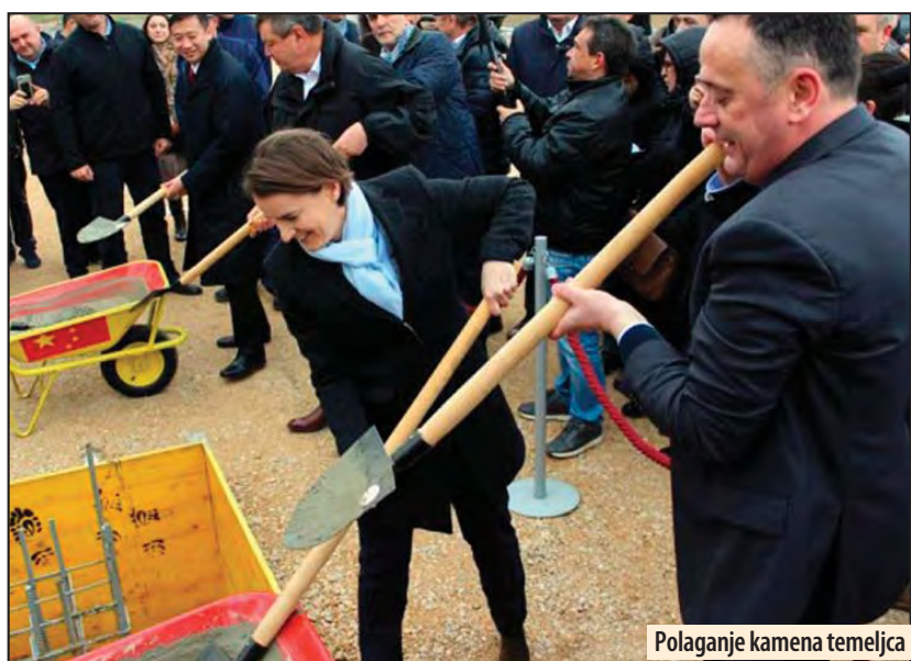
Polaganje kamena temeljca

Projekat u Kostolcu realizuje se na osnovu međudržavnog sporazuma Srbije i Kine o ekonomskoj i tehničkoj saradnji u oblasti infrastrukture, koji je potpisan 21. avgusta 2009. Z. V.