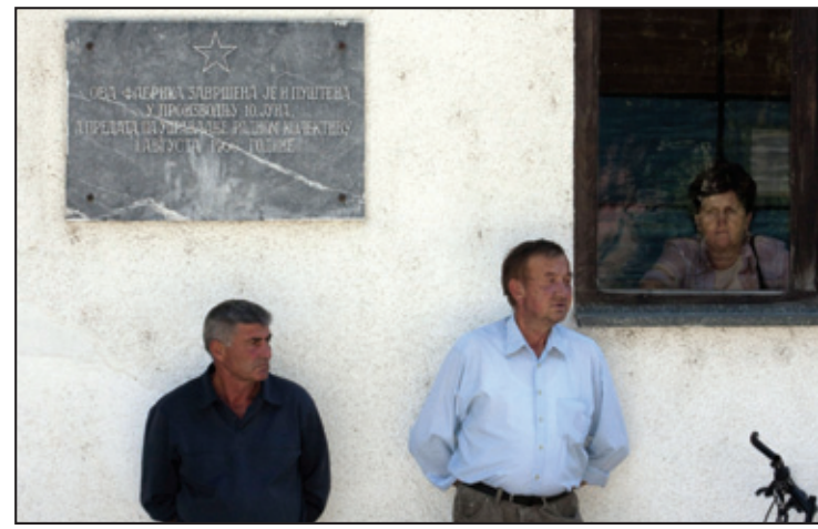
Ponovo prete radikalizacijom štrajka: Radnici TK Raška u svom preduzeću

vedena kraju i izraden je Predlog programa restrukturiranja. Privatizacija te fabrike ovog puta trebalo bi da bude uspešna, jer smo u sklopu kreditne podrške privredi, preko Fonda za razvoj, obezbedili veoma povoljne kredite i očekujemo da će investitori pronaći svoj interes i za ulaganje u TK Raška, rekla je Nikolićeva.