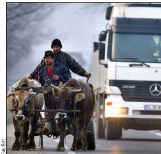
U očekivanju pomoći EU: Prizor iz Rumunije

Početkom nedelje osvanula je i vest da je Bugarska jedina zemlja sa pozitivnim kreditnim rejtingom u Evropi. Ta-