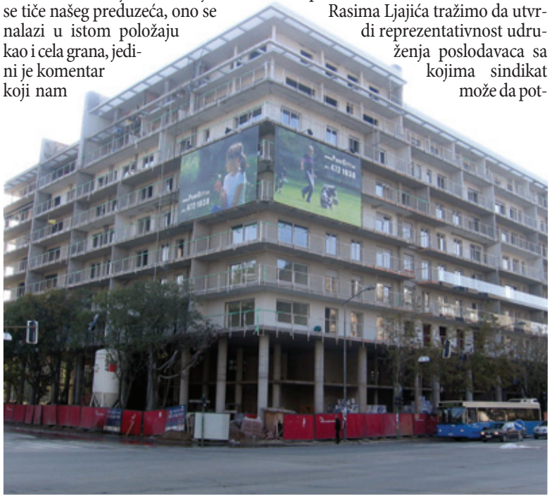
Mnogo hoteli, malo učinili: Gradilište kompleksa Park siti

Rasima Ljajića tražimo da utvrdi reprezentativnost udruženja poslodavaca sa kojima sindikat može da pot-