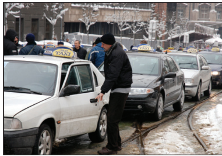
Štrajk nekoliko meseci pretnje i pregovori: Štrajk u decembru prošle godine

Vlada je u ponedeljak donela odluku o odlaganju uvođenja fiskalnih kasa za taksiste do decembra 2011. godine pa smo odustali od generalnog štrajka koji smo najavili. Dobili smo obećanje