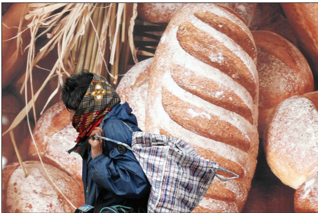
Socijalna politika kaska za krizom: Prizor sa beogradske ulica

politika. Članovi Vlade nemaju jedinstvene stavove o ovom problemu, a rešenja koja se nude nisu uopšte efikasna, tvrdi Savićeva. Prema njenim rečima i regionalizacija koja je sprovedena jeste politička, a ne ekonomska mera koja bi mogla da doprinese cilju da se broj siromašnih u Srbiji zaista smanji.