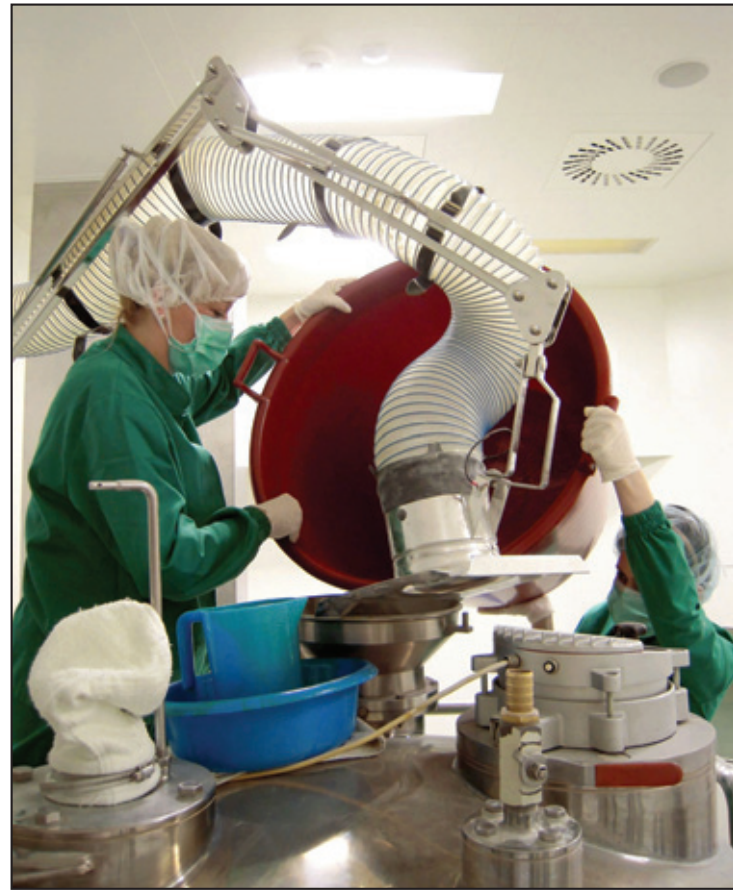
Ekonomsku krizu dočekali relativno spremni: Iz pogona Jugoremedije

Nismo kao sindikat bili pripremljeni za privatizaciju, malo smo zna-