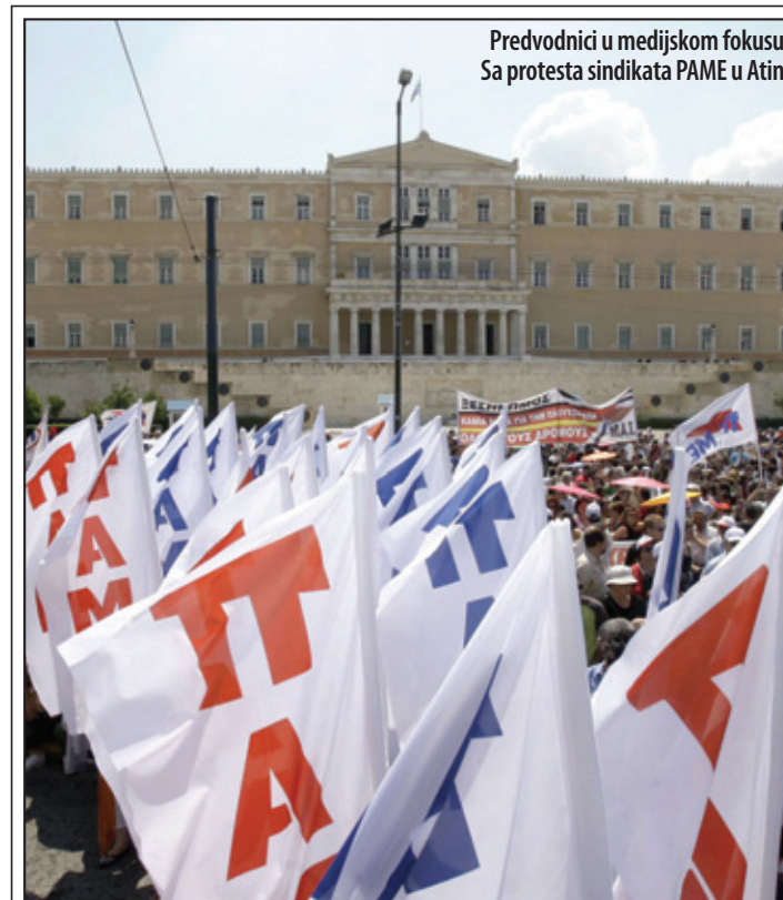
Svetska federacija sindikata, pozvala na proteste širom planete

Za razliku od očekivanog daljeg prištavanja pada u Rumuniji, poslednja istraživanja javnog mnjenja govore da optimizam biznis zajednice u Bugarskoj raste. Poslovna očekivanja u narednih tri do šest meseci mnogo su veća nego pre nekoliko meseci, kaže direktorka Nacionalnog statističkog in-