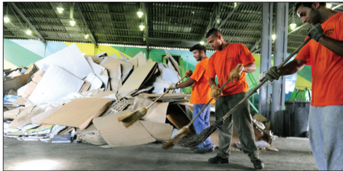
Spremaju ih za prodaju, a ne znaju se kriterijumi: Radnici jednog od komunalnih preduzeća na poslu

groblja jesu preduzeća koja ne mogu biti privatizovana, ali trebalo je u zakonu odrediti šta je čije. Osim toga, ova strategija je morala da odredi šta može da se privatizuje i kako da se to uradi. Da nešto ne štima dokaz je i to što je čak i Ministarstvo ekonomije izrazilo rezerve i reklo da ne prihvata rešenja koja se u ovom nacrtu zakona nalaze, ističe Grujić.