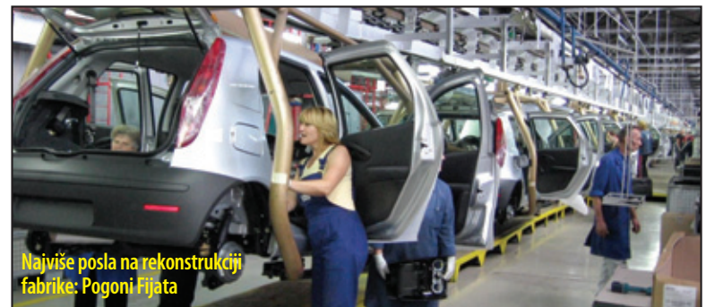
Najviše posla na rekonstrukciji fabrike: Pogoni Fijata

rativa nije spremna za velike poduhvate, pa se, otuda, uglavnom zadovoljava ulogom podizvođača. Iz gradske uprave poručuju ovdajšnjim formama da osnuju konzorcijum i tako da konkuriraju za značajnije poslove u Kragujevcu i okruženju. U Sindikatu građevinskih radnika Šumadijskog i raškog okruga oštro demantuju ocene kragujevačkih čelnika, tvrdeći