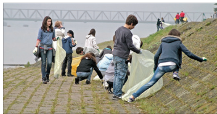
Prioritet sprovođenje zakona i usklađivanje sa praksom EU: Jedna od akcija „Očistimo Srbiju“

vanje. Sledi trening za pisanje predloga praktične politike, koji je koncipiran tako da omogući upoznavanje sa svim fazama ciklusa pisanja predloga praktične politike i prenos znanja o najboljim praksama zemalja članica EU, koje se tiču aktivnog učešća organizacija civilnog društva u kreiranju i primeni