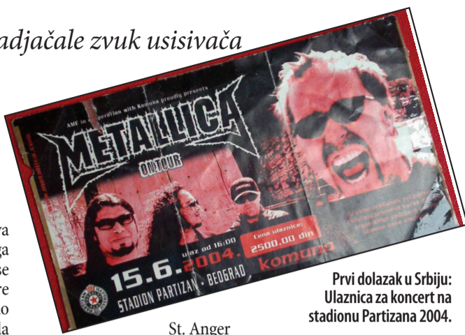
Prvi dolazak u Srbiju: Ulaznica za koncert na stadionu Partizana 2004.

pejzažu ne bi pomogla ni sva protivgradna artiljerija ovoga sveta. Ni Nikola Tesla ne bi se postideo Fight Fire With Fire iluminacije, kao što bi i rat bio sigurno manje obesmišljen da nije onog geometrijski zlokobnog vojničkog groblja iza koga se razliva uljano nebo kao u filmu Top Gan, sa omota trećeg albuma Master of Puppets (1986) kojim smo u školi plašili cure zaljubljene u Halida Muslimovića