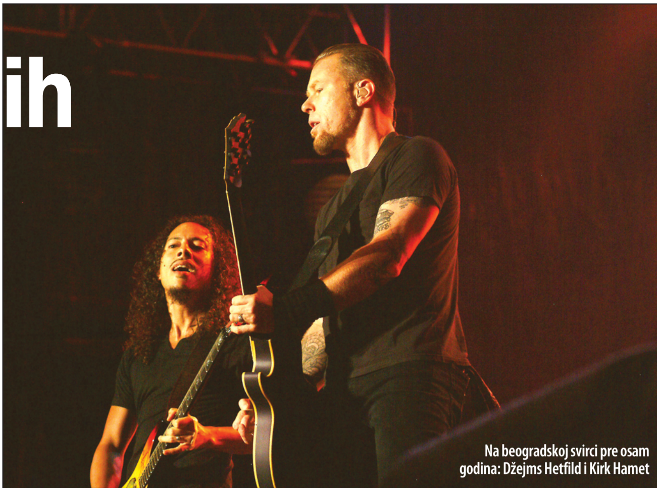
Na beogradskoj svirci pre osam godina: Džejs Hetfild i Kirk Hamet

bokerski džak, inače bi razbije-nih noseva bilo na sve strane! Kako je Ulrich posle objašnjavao, „bili smo prilično smoreni pravcem kojim smo do tada išli“, a koji je predstavljao „klasičan bunt prema komercijali“. „Sada shvatam da je bunt bio tu samo zato što nismo umeli da sviramo“. Ali, bend je bio svestan da je izlaz „u pravljenju oštrog zaokreta“, odnosno komponovanju kraćih, efektnijih i široj publici prihvatljivih melodija. Međutim, postojao je „mali“ problem: nisu znali kako se to radi! Najviše je morao da uči i menja se glavni tekstopisac Hetfild, koji je inspiraciju za ranije stihove o razaranju, besu, krvarenju za publiku i sl. nalazio na CNN-u, a sada se trudio da pesmama prenese i „nežna“ osećanja (npr. koliko mu je devojka nedostajala - „Nothing Else Matters“) ili se kroz stihove suoči sa tragičnim događajima iz privatnog života (mučna smrt majke uzrokovana verskom zatucanošću - „The God That Failed“). I njegovo pevanje doživelo je kompletan „remont“, za koji je najzaslužniji Rok - danima mu je objašnjavao da je bolje da upotrebi jedan stih tamo gde je, inače, koristio nekoliko, te da se reči mogu i razvlačiti da bi se dobila melodija: „En-