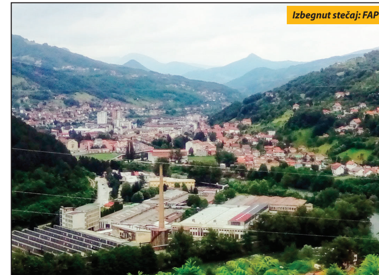
Izbegnut stečaj: FAP

Udruženje za zaštitu radnika Fabrike automobila Priboj, „Radnik nije rob“ je inicijator osnivanja zadruge u koju će