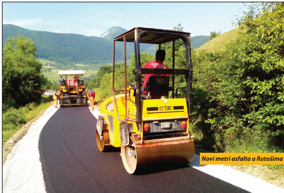
Novi metri asfalta u Rutošima

Nova Varoš - Novovaroški putari su pre nekoliko dana započeli radove na izgradnji 11 putnih pravaca na području sedam mesnih zajednica. Poslovi su ukupno vredni oko 25.000.000 dinara, a u najvećem obimu se finansiraju iz opštinske kase. Novih oko 6,2 kilometra asfalta uskoro će dobiti meštani Rutoša, Radoinje, Negbine, Akmačića, Draževića, Bistrice i Vionika, a u toku je procedura za izbor izvođača radova i na izgradnju putne mreže u mesnim zajednicama Jasenovu, Božetići, Bela Reka i Vraneša. Opštinskim budžetom za ovu godinu planirano je, inače, oko 40 miliona dinara za unapređenje putne mreže po selima, dok će tridesetak miliona dinara biti investirano u rehabilitaciju i izgradnju ulica u gradu.