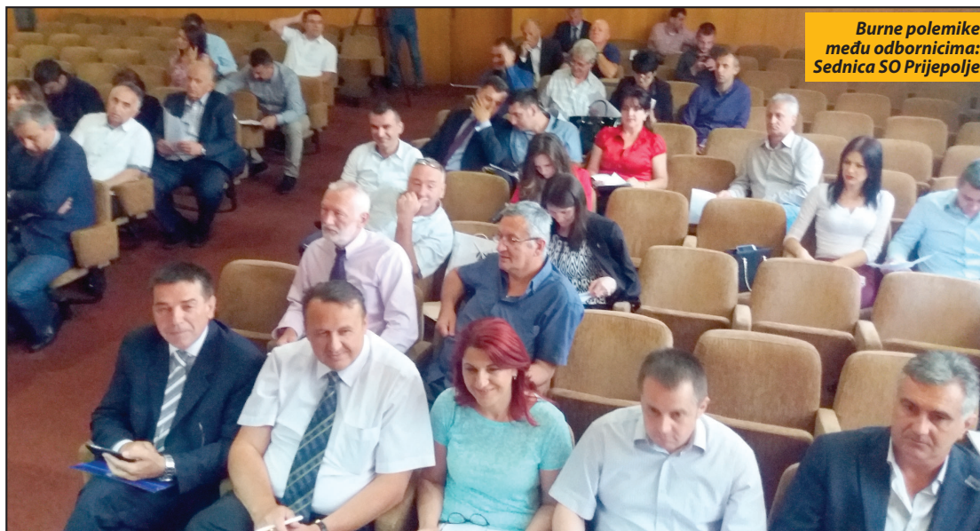
Burne polemike među odbornicima: Sednica SO Prijepolje

● Pokrenut postupak likvidacije JP za održavanje lokalnih puteva i javnih površina formirano samo pre sedam meseci ● Usvojen završni račun budžeta za 2016. godinu, JKP „Lim“ odobreno kreditno zaduženje od 10 miliona dinara