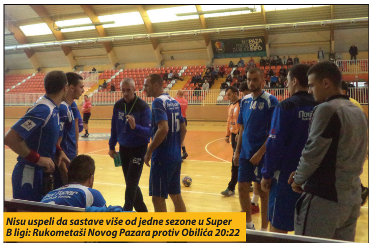
Nisu uspeali da sastave više od jedne sezone u Super B ligi: Rukometaši Novog Pazara protiv Obilića 20:22