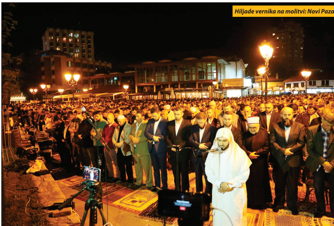
Hiljade vernika na molitvi: Novi Pazar