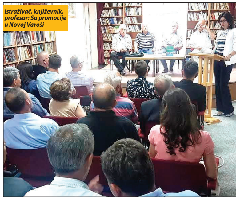
Istraživač, književnik, profesor: Sa promocije u Novoj Varoši

U knjizi su, inače, posebno zanimljivi podaci o kretanju i mestima gde su se naseljavali i selili pravoslavci i muslimanski žitelji. Kako su, recimo, svoja gnezda svi li Vasojevići, Kući, Piperi, Moračani, ali i