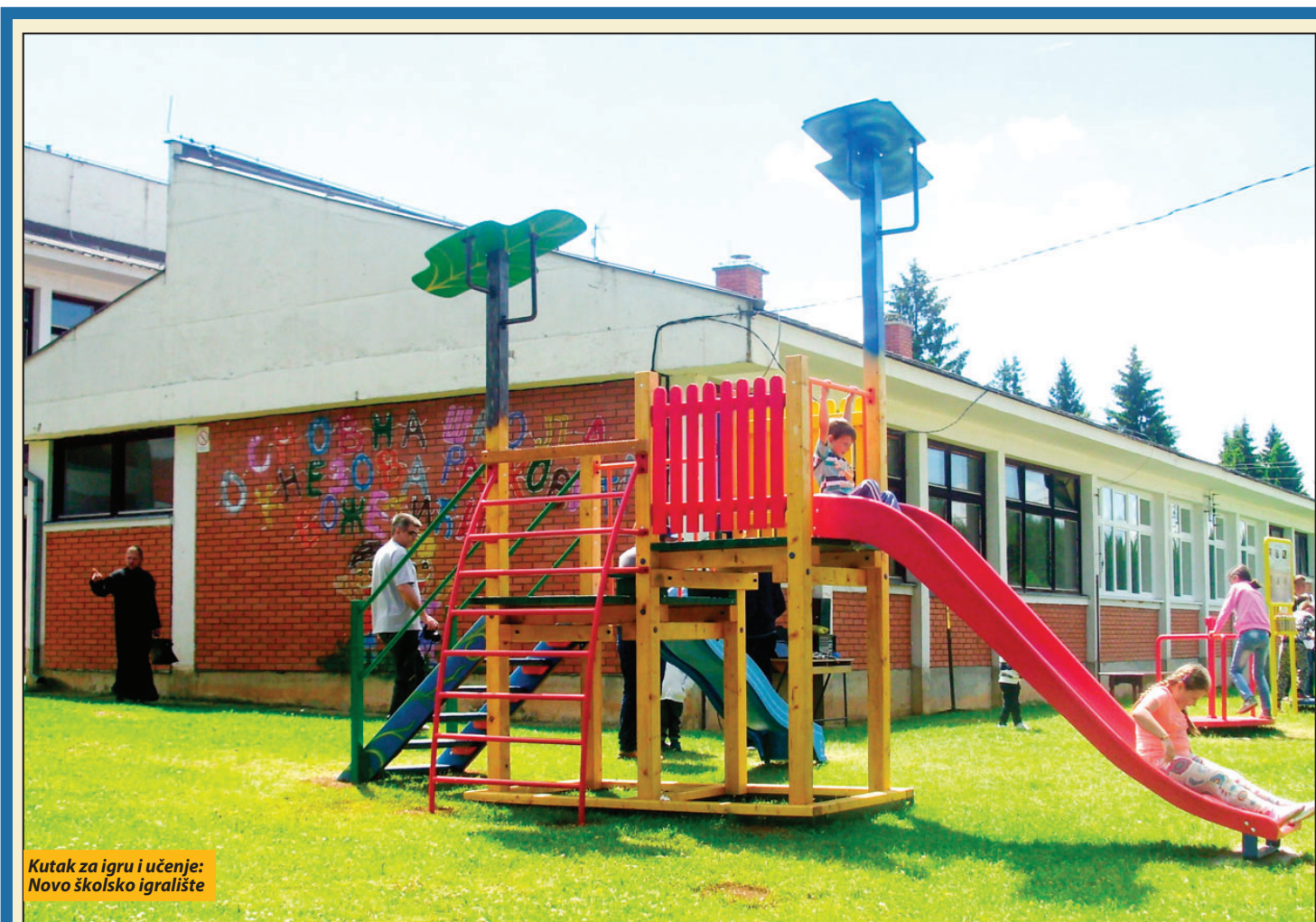
Kutak za igru i učenje: Novo školsko igralište

Humanitarna organizacija „Stvar srca“ iz Švajcarske darivala školu u Božetićima