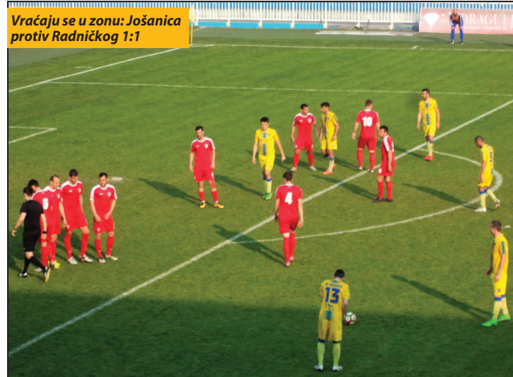
Vraćaju se u zonu: Jošanica protiv Radničkog 1:1

U rukometnim krugovima često se u poslednje vreme govori o novoj reorganizaciji rukometnih ligi. To je i razlog što se u Novom Pazaru nadaju da bi u sledećoj sezoni mogli da se zadrže u Super B ligi. Ostaje da se vidi u narednim mesecima da li je više zagovornika ili protivnika te ideje.