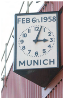
Tri sata i četiri minuta: Spomen-sat na Old Trafrodu

isticali sa da nije važno da li će se utakmica izgubiti, nego da je važno da li će biti borbe. Ako nije bude, poraz nije strašan.