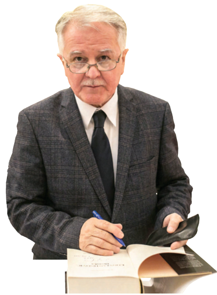
Piše: Radivoj Cvetičanin

Već na večeri, dva sata posle utakmice, nije bilo ni traga od napetosti. Rezultat je napravio katarzu, i sad su do izražaja mogli da dođu karakteri. Beri se izvinjavao Kostiću za jedan faul. Zvezdini fudbaleri setili su se kako su ih mančesterovci tamo u Mančesteru, posle utakmice, u špaliru, aplauzom ispratili u svlačionicu. Sad je aplauz vraćen Mančesteru za plasman u polufinale. Šef Zvezdinog štaba, legendarni dr Aca Obradović, kuvao je Bezbija da dodu na otvaranje novog Zvezdinog stadiona (Marakana!), koje se upravo spremalo. Dogovor je lako pao, dolazak bi bio gratis, niko nije sanjao katastrofu. Još kad su konobari kroz lajt-šou uneli sladoled, zapevana je i stara škotska – Bezbi je bio Škot – Let's meet again („Da se sretnemo ponovo“)