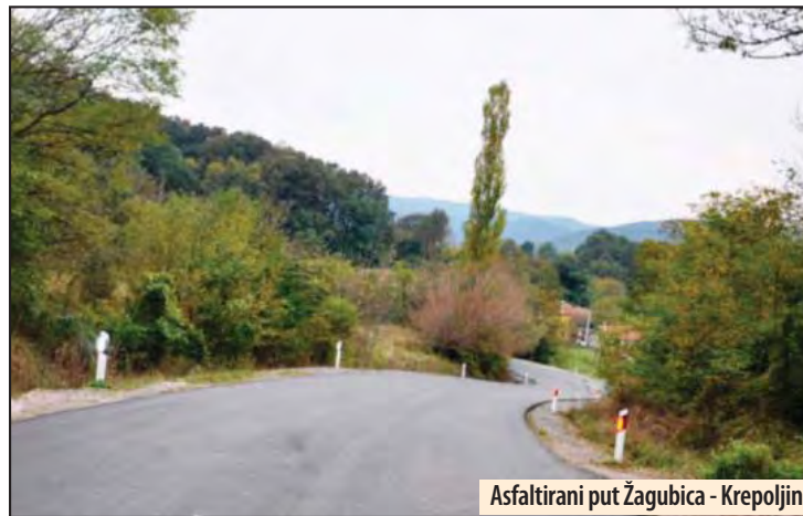
Asfaltirani put Žagubica - Krepoljin

Žagubica - Lokalna samouprava u Žagubici uspešno je poslovala u prošloj godini, jer su završeni i započeti brojni razvojni projekti. Među ispunjenim obećanjima datim građanima, prednjačila su ona vezana za oblast infrastrukture, jer je ona ključna za razvoj privrede i turizma.