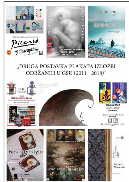
„DRUGA POSTAVKA PLAKATA IZLOŽBI ODRŽANIH U GSU (2011 - 2018)“