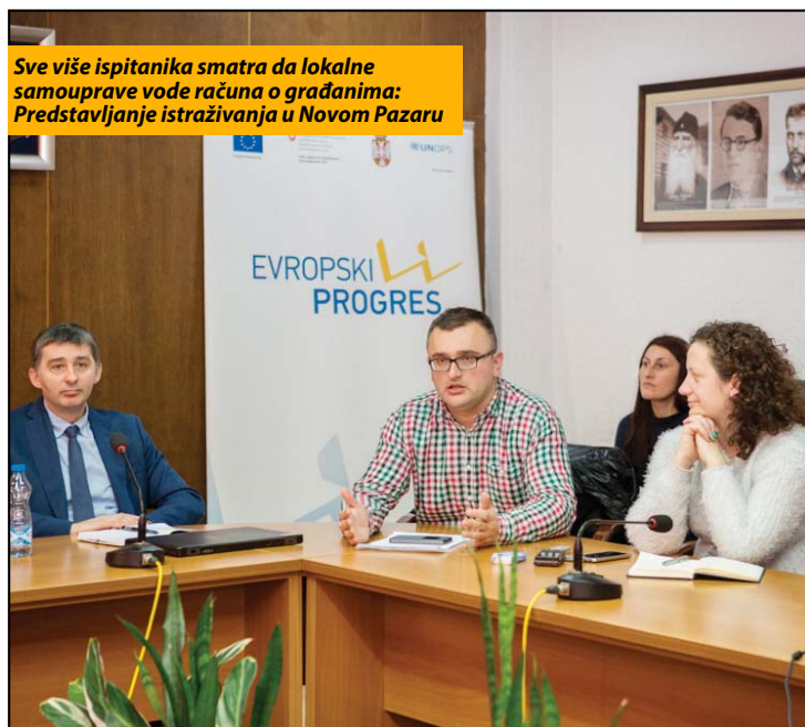
Sve više ispitanika smatra da lokalne samouprave vode računa o građanima: Predstavljanje istraživanja u Novom Pazaru

završavaju poslove u opštini i bolje ocenjuju rad opštinske administracije“, naglasio je Vujačić i dodao da je „istraživanje pokazalo da stanovništvo nešto bolje ocenjuje i životni standard. Sada 35 odsto ljudi kaže da živi dobro ili srednje i to jeste porast u odnosu na 2010. kada je taj procenat bio 25, ali šest odsto građana koji kažu da žive nepodnošljivo, signal je za lokalne i nacionalne vlasti, ali i razvojne programe da nastave podršku opštinama“.