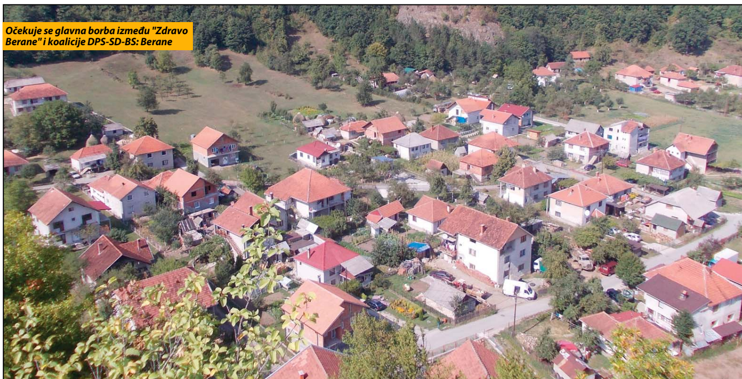
Očekuje se glavna borba između "Zdravo Berane" i koalicije DPS-SD-BS: Berane