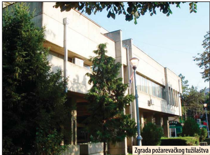
Zgrada požarevačkog tužilaštva

Ima i drugih solucija kao institucija poput oportuniteta gde tužilaštvo predlaže osumnjičenom da će odustati od gonjenja, ako ovaj prizna krivicu. Nakon priznanja određuje mu se novčana kazna koju uplaćuje u humanitarne svrhe, a tužilaštvo odbacuje prijavu. Sličnu mogućnost u sličnom slučaju, prošle godine iskoristio je Dejan Grujić Gari iz Drmna, koji je bio okrivljen da je pretio gradonačelniku Banetu Spasoviću. On je, nakon priznanja, uplatio određeni iznos novca i tužilaštvo je odbacilo prijavu protiv njega. Postoji i mogućnost da se sačini i sporazum o priznavanju krivice, gde bi osumnjičeni u zamenu za blažu kaznu, prihvatio predlog tužilaštva i priznao delo za koje se tereti, koji bi nadležni sud potvrdio. TPK NEWS