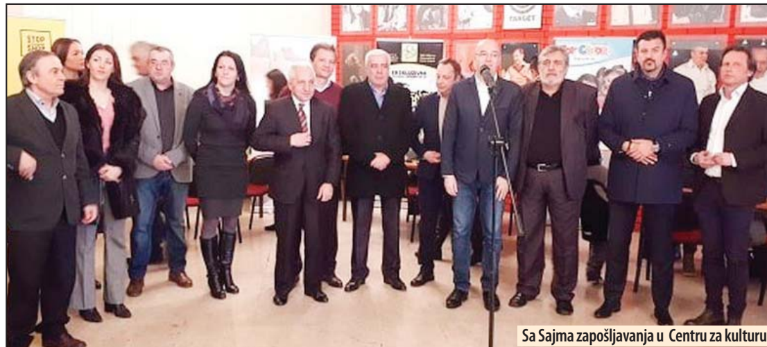
Sa Sajma zapošljavanja u Centru za kulturu

Požarevac - Nakon mnogo godina u Požarevcu će biti realizovana prva direktna investicija, vredna 10 miliona evra, čijom će realizacijom biti otvoreno oko 300 novih radnih mesta, pa je tim povodom, u Centru za kulturu održan sajam zapošljavanja za buduće radnike u kompanijama koje će poslovati u ritejl parku „Stop-shop“, čije otvaranje najavljeno za 19. april.