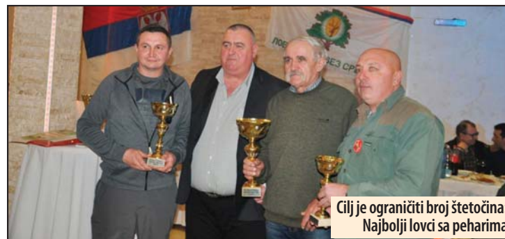
Cilj je ograničiti broj šetovača: Najbolji lovci sa peharima

Požarevac - Poslednje nedelje u februaru po deveti put je organizovana hajka „Lov na moravskog šakala“ u organizaciji Lovačkog udruženja „Resava“, koji čine sekcije iz Lučice, Prugova, Poljane i Vlaškog Dola, sa preko 250 članova. Ni pasje vreme, koje je doneo ledeni talas iz Sibira nije sprečilo veliki broj lovaca iz čitave Srbije i nekoliko gostiju iz Rumunije da prisustvuju ovom lovu.