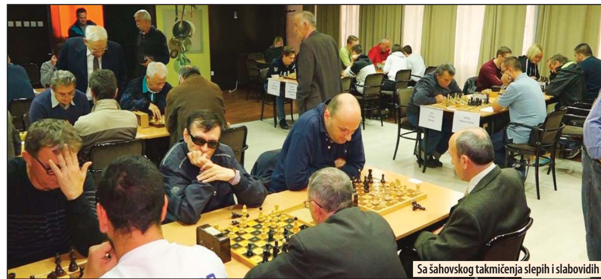
Sa šahovskog takmičenja slepih i slabovidih

Odluka komisije za vrednovanje prijavljenih programa