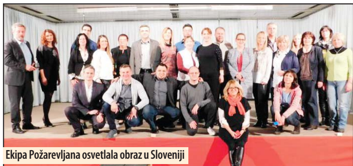
Ekipe Požarevljana osvetlala obraz u Sloveniji

Požarevac - Osnovna škola „Sveti Sava“ iz Požarevca učestvovala je na festivalu „Sa pozornice na pozornicu“ u školi „Leon Štukelj“ u Mariboru. Na festivalu su učestvovala škole iz Slovenije, Mađarske, Ukrajine, Hrvatske i Srbije. Požarevljani su se predstavili skraćenom verzijom predstave „Ribe na drvetu“, koja je dočekana sa velikim interesovanjem zbog teme koja je zajednička za sve i problematizuje poremećaje u govoru i pisanju, kao i odnose u trouglu učenik - nastavnik - škola, gde se nalazi i rešenje ovog problema.