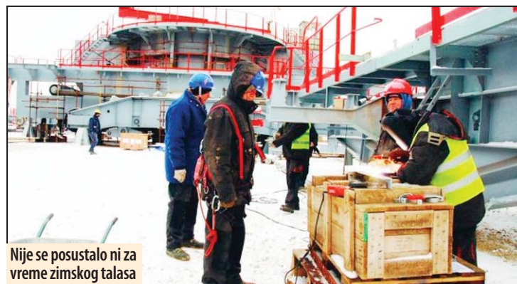
Nije se posustalo ni za vreme zimskog talasa

Odlično napreduju i radovi koji su u nadležnosti domaće kompanije „Goša