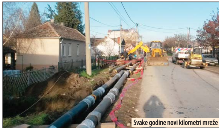
Svake godine novi kilometri mreže

Shodno zakonskim obavezama, i u ovoj godini biće nastavljani radovi na tehničkoj i biološkoj rekultivaciji degradiranih površina, i to pre svega na unutrašnjem odlagalištu kopa „Drmno“, ali i drugim lokacijama, kako je to definisano projektom dokumentacijom. U ovoj godini planirana su sredstva i za arheološka istraživanja na lokalitetu Vminacijum ispred fronta napredovanja rudarskih radova, za preseljenje arheoloških objekata. I dalje vlada veliko interesovanje za širenje toplifikacione mreže