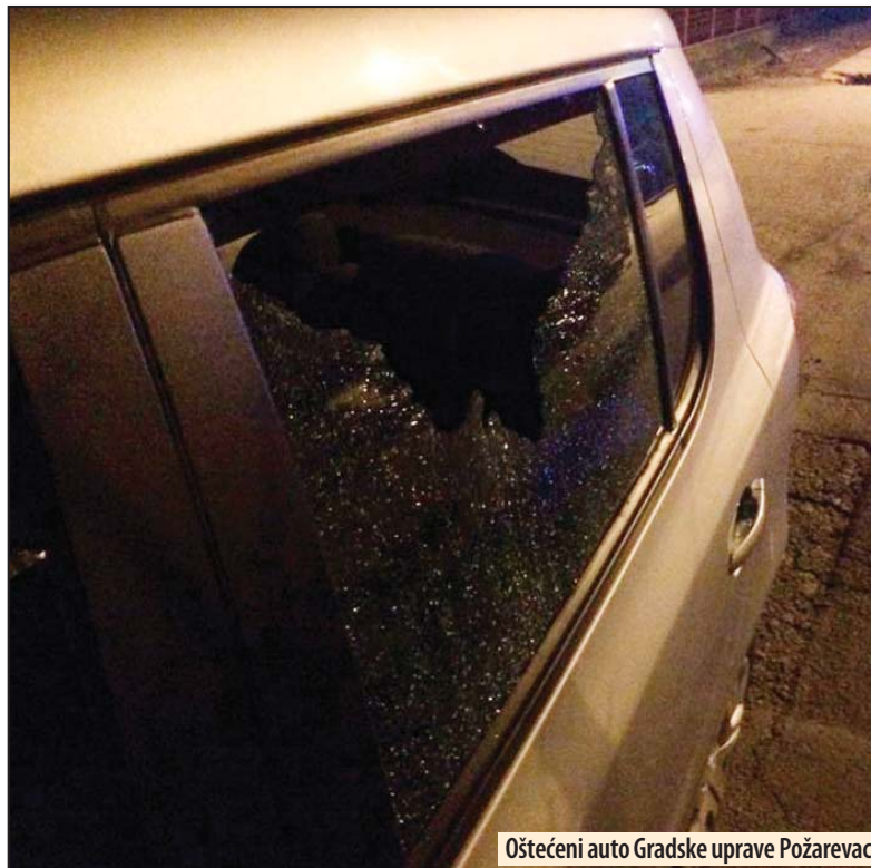
Oštećeni auto Gradske uprave Požarevac

„Ja sam vozio Ratarskom ulicom kako bih odveo kući Rašića, i na 150