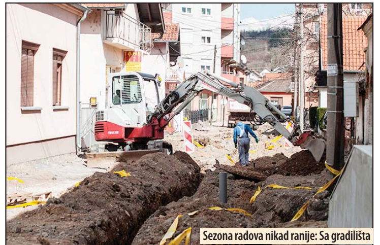
Sezona radova nikad ranije: Sa gradilišta

- Moj otac je bio levičar i to socijaldemokrata. I ja sam po opredeljenju socijaldemokrata, jer smatram da je to najpravednije opredeljenje ne samo u Srbiji, već i u svetu. Od kada je Dačić program SPS-a, koji je bio klasičan levičarski, promenio u socijaldemokratski, ta stranka me je još više privukla, tako da sam postao njen član i funkcioner, objašnjava on svoje ideološko opredeljenje. M. Veljković