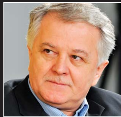
Piše: Radivoj Cvetičanin

Otkud on među njima? Rekao bih da odgovor nudi ova rečenica iz spomenutog predgovora: „Tada su /u ona tri dana/ govorili ljudi najrazličitijih profesija, i različitih shvatanja, ali u jednome svakako isti; u nemirenju sa fašizmom, u svojoj hrabrosti da to nemirenje javno ispoljavaju“. Do toga je njemu bilo stalo. Znao je (nije mogao da ne zna) da se nalazi među uglavnom tvrdokornim generalima, dogmatičnim stvaraočima, nekad čvrstoručkim političarima koji sasvim sigurno nisu marili Konstantinovića u njegovoj epohi posleratne književne avangarde. Nešto je drugo u tome času, međutim, važnije. Da se postavi, na primer,