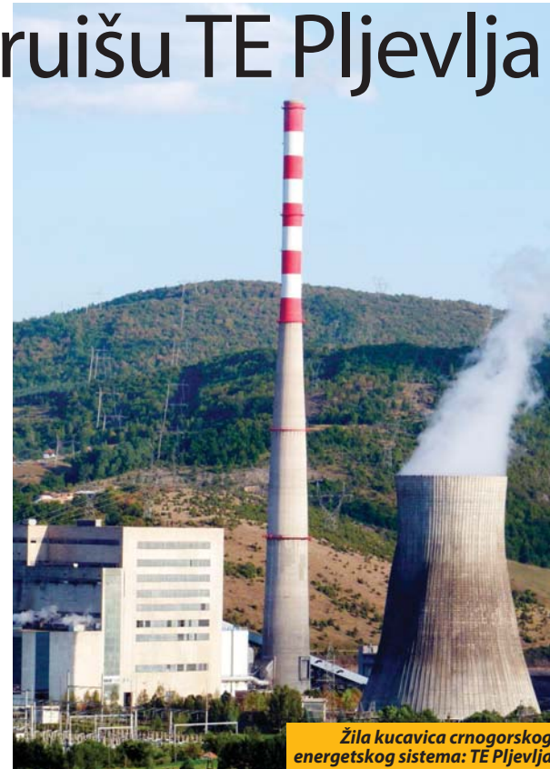
Žila kucavica crnogorskog energetskog sistema: TE Pljevlja

U konkurenciji je bilo još pet kompanija, a član skupštinskog Odbora za ekonomiju, finansije i budžet i poslanik DPS-a Filip Vuković je Dnevnom novinama kazao da je odluka EPCG ispravna, jer su njemačke firme iz oblasti termoelektrane u toj državi napravile najbolja rješenja u Evropi. „U posljednjih 15 godina u Njemačkoj je izgrađeno 30 termoelektrana i sve rade u skladu sa najnovijim rješenjima iz oblasti zaštite životne sredine, tako da ne sumnjam da će se takvi rezultati postići i u Cr-