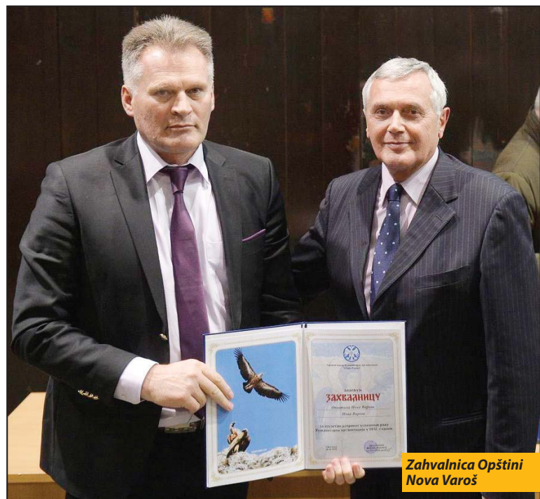
Zahvalnica Opštini Nova Varoš

Skupština Humanitarne organizacije „Stara Raška“