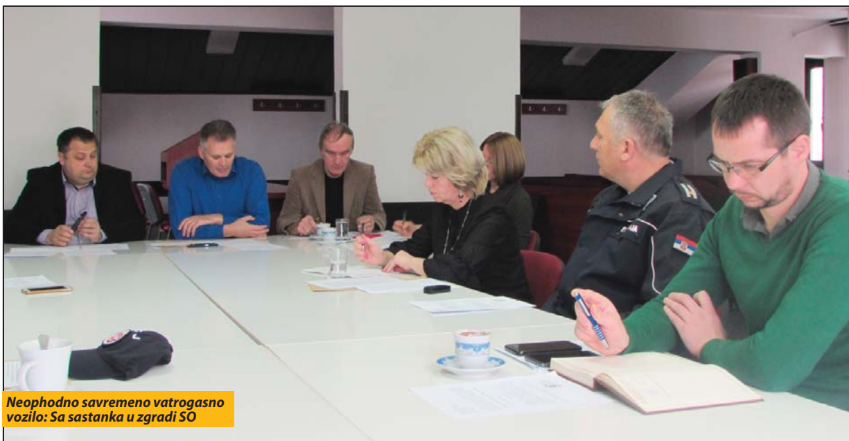
Neophodno savremeno vatrogasno vozilo: Sa sastanka u zgradi SO

jom investicije. Prvi tender za toplanu početkom prošle godine raspisala je opština Pljevlja, ali ga je Đačić poništio jer, kako je naveo, nijedna od četiri ponude nije bila ispravna. Nakon toga, Državna komisija za kontrolu javnih nabavki, po žalbi učesnika, poništila je tender jer je utvrdila da ugovor o javnoj nabavci nije u skladu sa uslovima utvrđenim tenderskom dokumentacijom. Pojedini opozicionari smatraju da se rok odlaze kako bi se polaganje kamena temeljca obavilo u toku kampanje za lokalne izbore, sredinom maja. C. D.