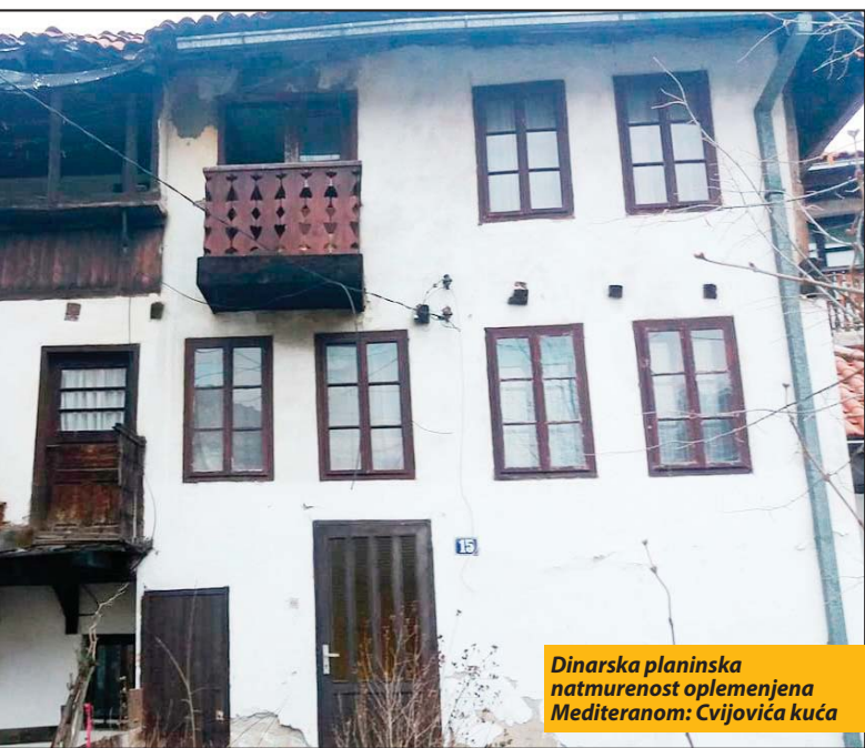
Dinarska planinska natmurenost oplemenjena Mediteranom: Cvijovića kuća

kao i pojedini zidovi prete da će se objekat u najvećem delu potpuno urušiti. Vlasnici ovog objekta ne poseduju finansijska sredstva za zaštitu ili obnovu dotrajalog građevinskog materijala. Postoji mogućnost prodaje objekta, ali to bi značilo najverovatnije rušenje i izgradnju novog objekta, što nadležni Zavod za zaštitu spomenika kulture u Kraljevu ne bi smeo da dozvoli, kaže Pušica.