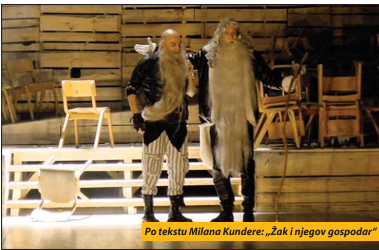
Po tekstu Milana Kundere: „Žak i njegov gospodar“

- Kako i sam Kundera kaže, on je samo uzeo i napravio varijaciju romana. Nije ovo adaptacija, nije dramatisacija, to je samo varijacija na određeno delo. I likovi iz drame su istovetni likovi koje je i Deni Didro napisao - rekao je nakon premijere režiser. Novopazaraska pozorišna publika, do sada, većinom je gledala vodvilje, pa je postavljanje predstave „Žak i njegov gospodar“ bila značajan iskorak, koji je prihvaćen ovacijama. Ova predstava će otvoriti 54. Festival profesionalnih pozorišta „Joakim Vujić“, koji će od 7.-15. maja biti održan u Novom Pazaru. S.N.