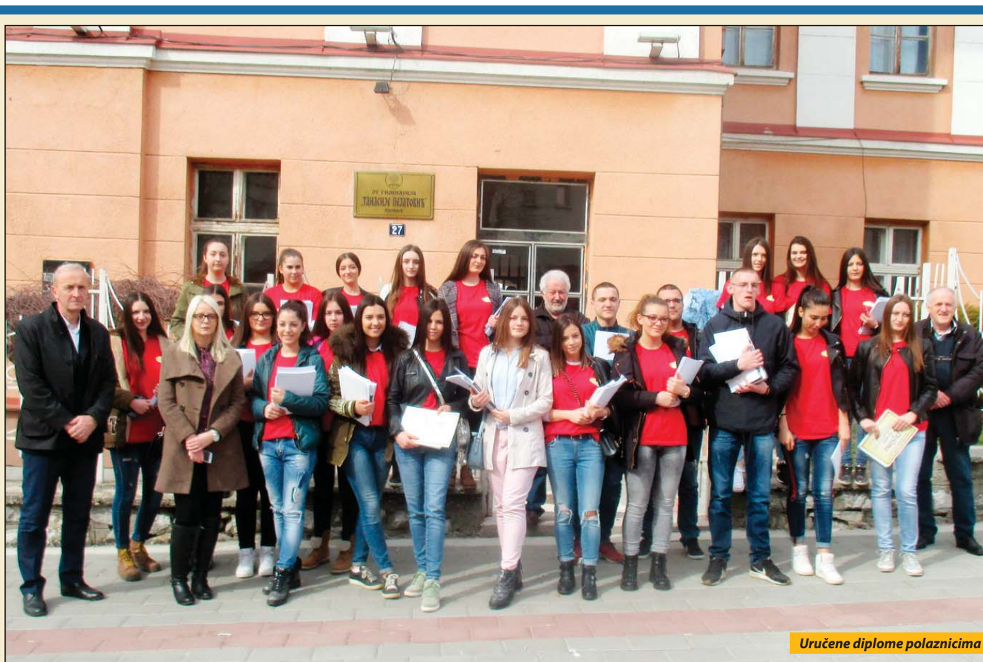
Uručene diplome polaznicima

Omladinski dijalog klub pljevaljskog „Bonuma“