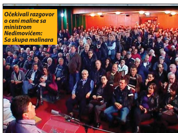
Očekivali razgovor o ceni maline sa ministrom Nedimovićem: Sa skupa malinara

Ministar je samo nagovestio da se može očekivati cena slična prošlogodišnjoj. Izneti su ostali detalji razgovora koji se odnose na obećanu pomoć proizvođačima maline, a to su naknada štete od elementarnih