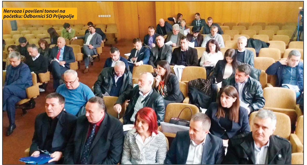
Nervoza i povišeni tonovi na početku: Odbornici SO Prijepolje

Ono što je takođe podržano bez rezerve je izrada Plana detaljne regulacije korita Mileševke i dela zaštićene okoline manastira Mileševa. Naime, kako je to detaljnije predloženo, sledeće godine je osam vekova manastira Mileševa, pa su predstavnici iz Prijepolja bili u Vladi Srbije gde je formiran tehnički odbor za obeležavanje ovog značajnog datuma. Javna preduzeća Putevi Srbije i Srbijavode već ubrzano pripremaju projekte kako bi se uradila obaloutvrda na reci od Bolnice do Mileševa, što uključuje i kultivisanje puta, pešačke staze i tako dalje. No, da bi se realizovala investicija potrebno je da opština obezbedi adekvatnu prateću građevinsku dokumentaciju kojoj prethodi Plan detaljne regulacije za ovaj deo opštine, što