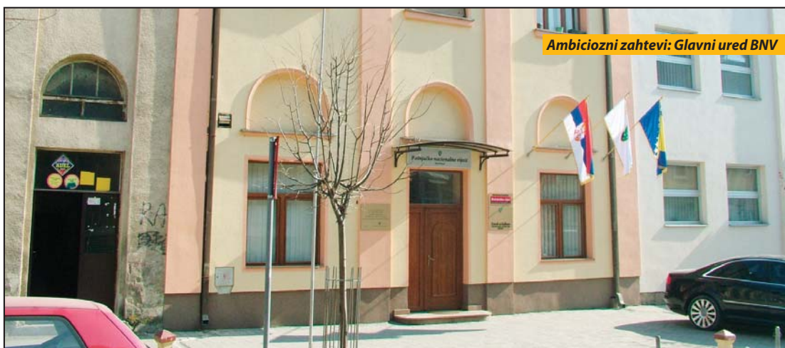
Ambiciozni zahtevi: Glavni ured BNV