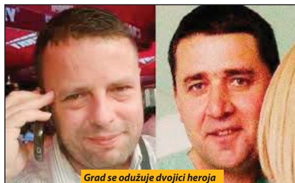
Grad se odužuje dvojici heroja

- Ovo je najmanje što grad može da uradi. Imamo obavezu da sačuvamo sećanje na plemenite ljude, kakvi su bili oni, prokomentarisao je inicijativu novopazarski gradonačelnik Nihat Biševac. U utorak se navršilo tri godine od helikopterske nesreće u kojoj je poginulo sedam ljudi. Helikopter Mi-17 Vojske Srbije, srušio se nešto pre ponoći 13. marta 2015. godine, u neposrednoj blizini aerodroma „Nikola Tesla“. Helikopter se vraćao iz Raške odakle je prevezio životno ugroženu beb