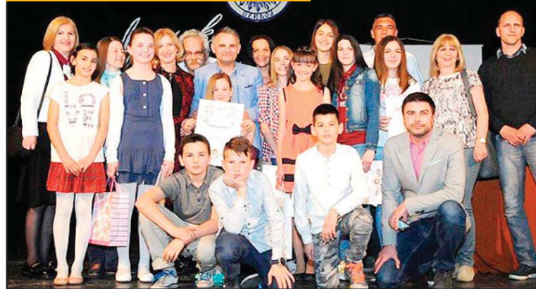
Jedan od najdugovečnijih poetskih festivala: Sa prošlogodišnjih Limskih večeri dečje poezije