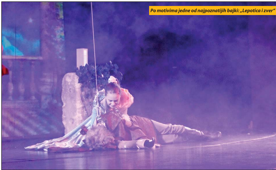
Po motivima jedne od najpoznatijih bajki: „Lepotica i zver“

Magija bajke „Lepotica i zver“ kao intrigantne alegorije veoma je popularna i sudeći po utiscima publike još uvek privlačna i za aktere i za gledaoce i to ne samo dečjeg uzrasta. Oni koji nisu gledali premijeru, već sutra će imati priliku da posle prve reprize ponese utiske o predstavi u kojoj je reditelj vešto koristio i savremene tehnološke mogućnosti i efekte kako bi dočarao raskošnost bajke, a scenografiju učinio što ekspresivnijom, uz zavidnu kostimografiju, što je svakako doprinelo i razigranosti malog glumačkog ansambla. I. H. D.