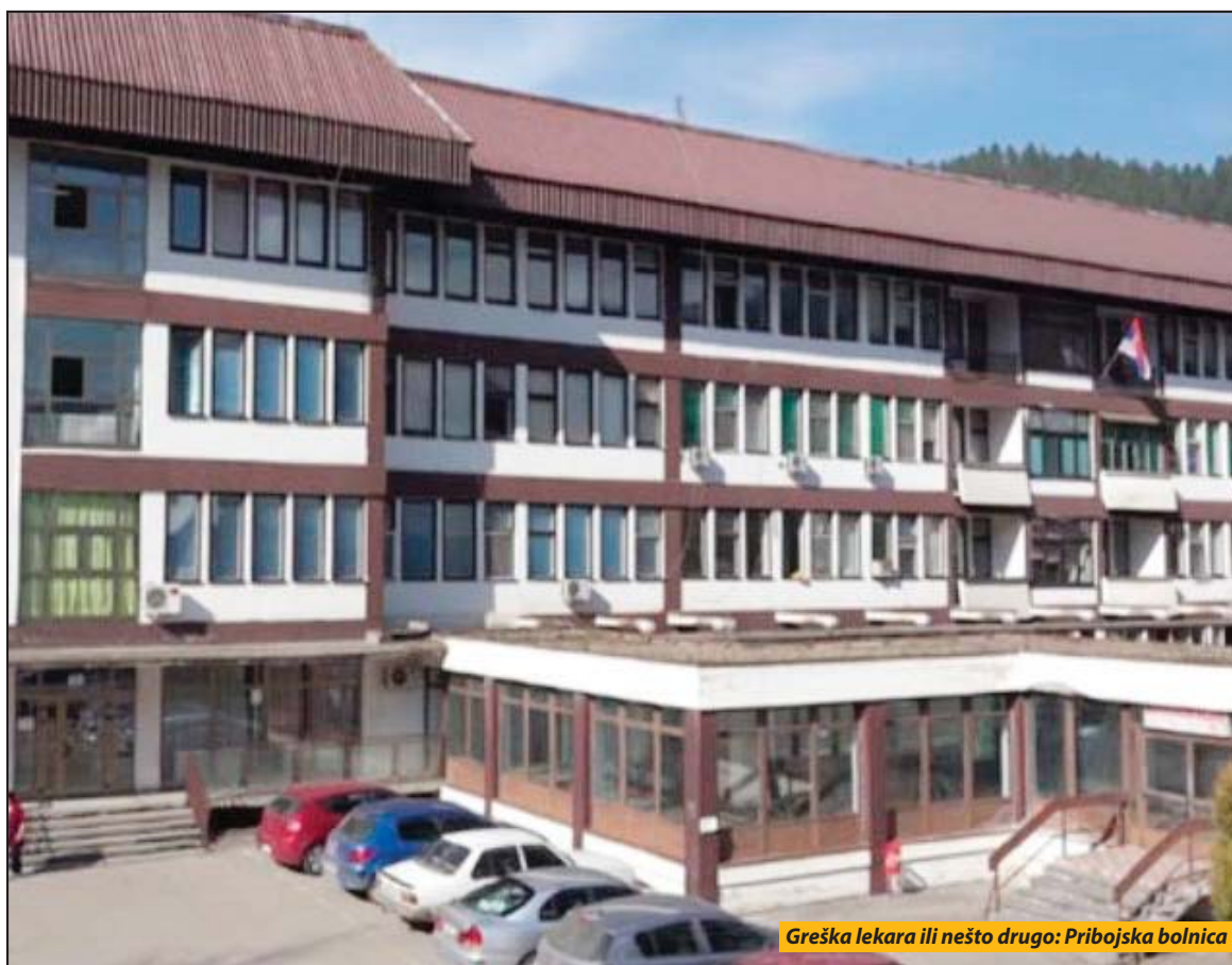
Greška lekara ili nešto drugo: Pribojska bolnica

Čekaju se izveštaji o smrti porodilje iz Priboja