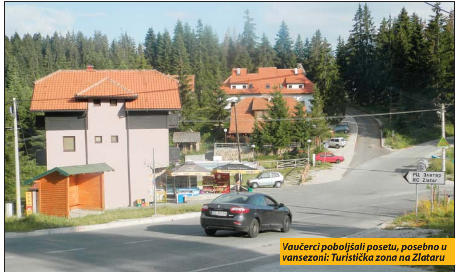
Vaučerci poboljšali posetu, posebno u vansezoni: Turistička zona na Zlataru

Prijavlivanje za korišćenje vaučera traje do 15. oktobra, a moraju biti realizovani najkasnije