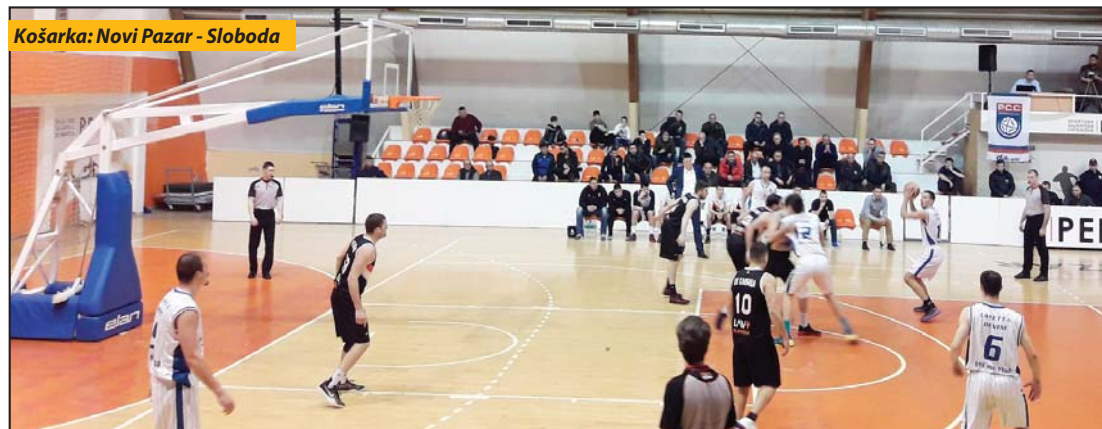
Košarka: Novi Pazar - Sloboda