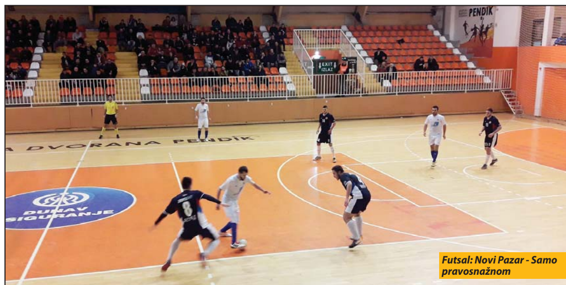
Futsal: Novi Pazar - Samo pravosnažnom

KMF Novi Pazar nije uspeo da nastavi seriju pobeda na svom parketu. U 18. kolu Prve futsal lige Srbije odigrao je nerešeno sa FON-om iz Beograda 1:1 (0:0). Gosti su povelili golom Petrova u 25. izjednačenje domaćem timu doneo je Tanasković tri minuta kasnije.