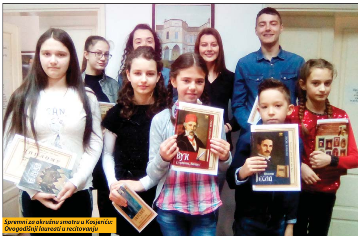
Spremni za okružnu smotru u Kosjeriću: Ovogodišnji laureati u recitovanju