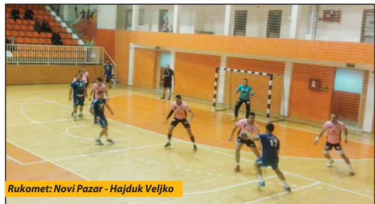
Rukomet: Novi Pazar - Hajduk Veljka

Jedna od najboljih utakmica viđenih jesenas u „Pendiku“ je ona koju su u poslednjem kolu rukometne Super B lige (Istok - Zapad) odigrale dve neporažene ekipe, Novi Pazar i Vranje. Derbi je samo na papiru poneo epitet duela dva najjača tima. Predvođeni Kaltakom, Rakićem, Međedovićem i ostalima, Novopazarci su lako izašli na kraj sa gostima (31:26), koje u tom meču nije predvodio trener Ljubomir Obradović, jer je tada kao selektor komandovao ženskoj reprezentaciji Srbije na Evropskom prvenstvu u Nemačkoj. Tom pobedom No-