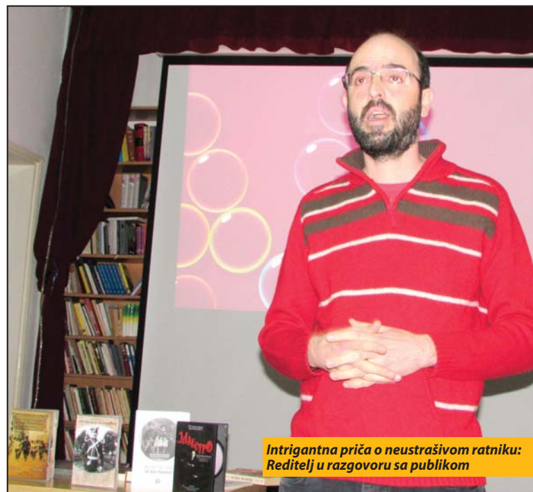
Intrigantna priča o neustrašivom ratniku: Reditelj u razgovoru sa publikom

U razgovoru sa publikom, autor se osvrnuo i na domaće serijale sa istorijskom potkom, ocenjujući ih kao umetnički nedefinisane i neistinite („Nemanjići - rađanje države“) i bez jasnog motiva otkud ideja da se ekranizuju odnosno reklamiraju fragmenti koji zapravo i nisu istorija („Senke nad Balkanom“). R. P.