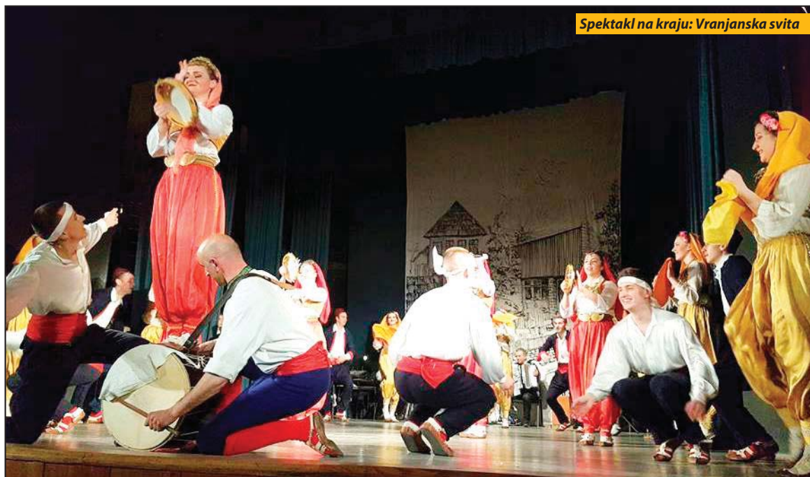
Spektakl na kraju: Vranjanska svita

Ako je suditi po programu kojim se ovdašnji KUD predstavio poklonicima folklora i izvornog pevanja, on nesumnjivo nastavlja da, kao čuvar narodnog blaga, pronosi slavi nekadašnjeg „Ineks napretka“, koje je za dvadesetak godina postojanja imalo izuzetno uspešne nastupe u zemlji i inostranstvu. Bogata tradicija nastavljena je nakon višegodišnje pauze u martu 2004. kada je obnovljen rad gradskog folklornog an-