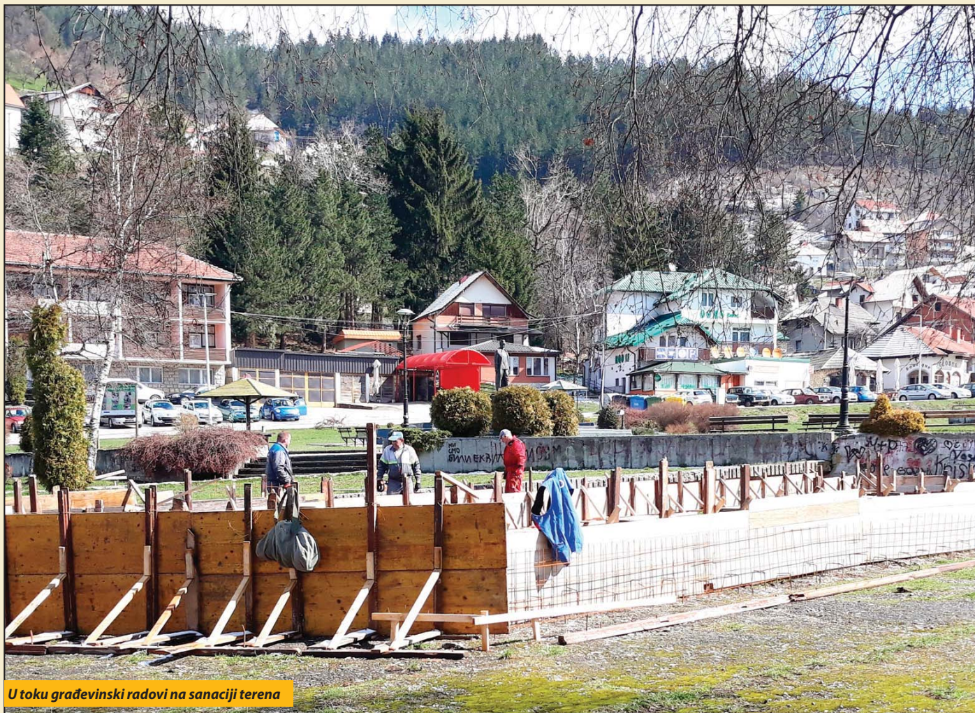
U toku građevinski radovi na sanaciji terena

Na Trgu u Novoj Varoši počela izgradnja igrališta za decu