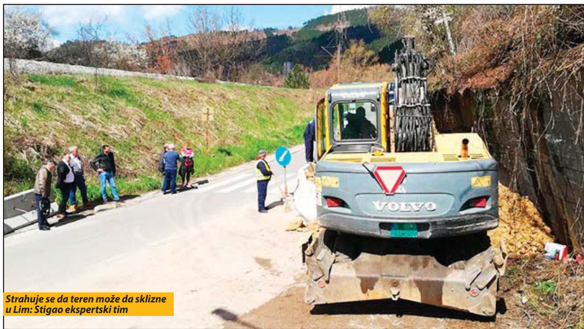
Strahuje se da teren može da sklizne u Lim: Stigao ekspertski tim

- Više, međutim, zabrinjava podatak iz istraživanja da se gotovo 60 odsto gra-