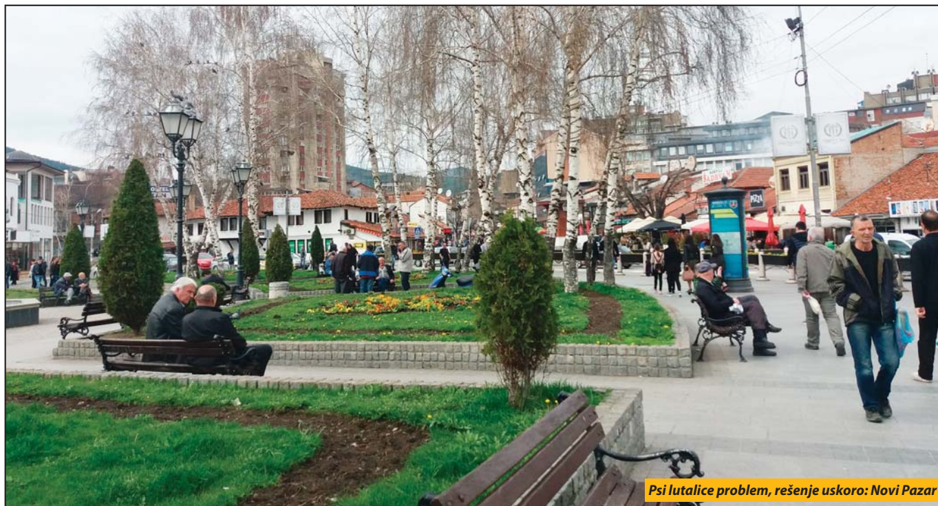
Psi lutalice problem, rešenje uskoro: Novi Pazar