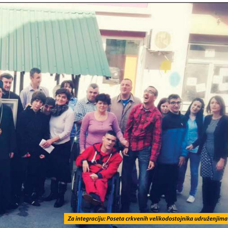
Za integraciju: Poseta crkvenih velikodostojnika udruženjima

uključimo u punoću života, da ne budu izostavljeni, bilo da su rođeni u nekoj bolesti ili da su neku bolest dobili na putu života.