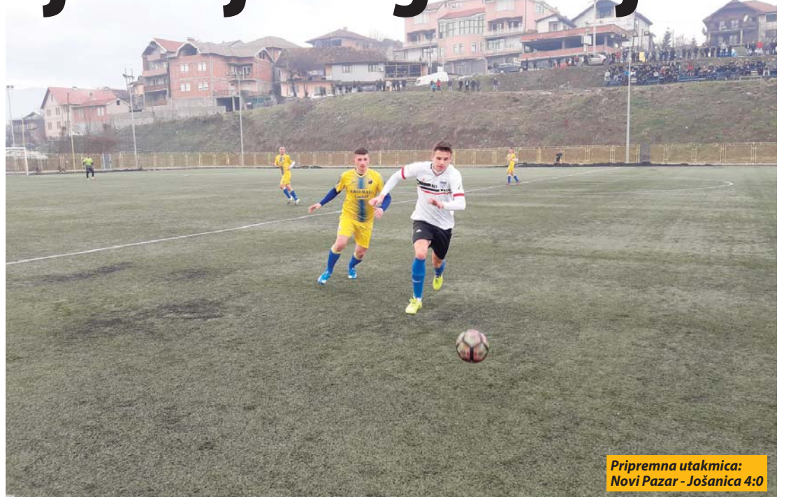
Pripremna utakmica: Novi Pazar - Jošanica 4:0