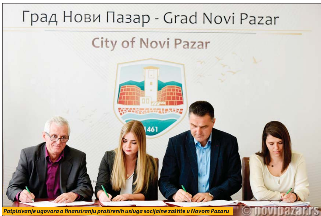
Potpisivanje ugovora o finansiranju proširenih usluga socijalne zaštite u Novom Pazaru