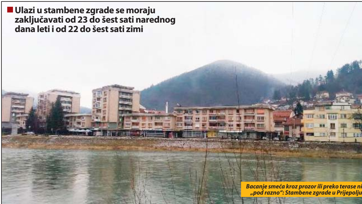
Bacanje smeća kroz prozor ili preko terase ni „pod razno“: Stambene zgrade u Prijepolju

■ Ulazi u stambene zgrade se moraju zaključavati od 23 do šest sati narednog dana leti i od 22 do šest sati zimi