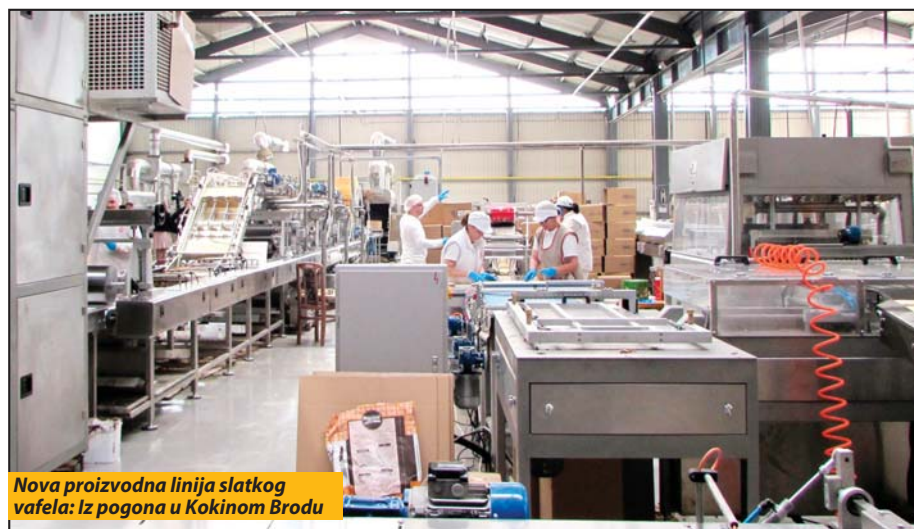
Nova proizvodna linija slatkog vafela: iz pogona u Kokinom Brodu

Trenutni obim proizvodnje napolitanki na mesečnom nivou je oko 300 tona (25 šlepera). Asortiman čini oko deset vrsta ovog slatkog vafela odličnog kvaliteta. „Joy napolitanke“, pro-