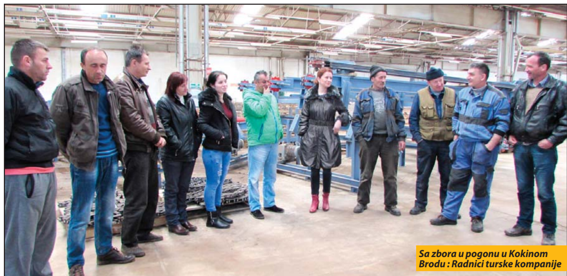
Sa zбора u pogonu u Kokinom Brodu: Radnici turske kompanije

Protestni skup radnika turske kompanije „Mercer trade“