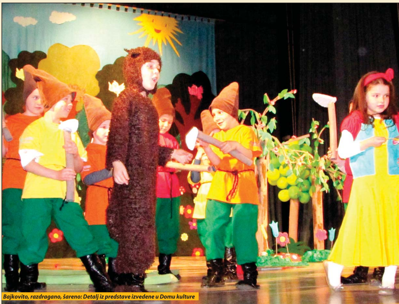
Bajkovito, razdragano, šareno: Detalj iz predstave izvedene u Domu kulture