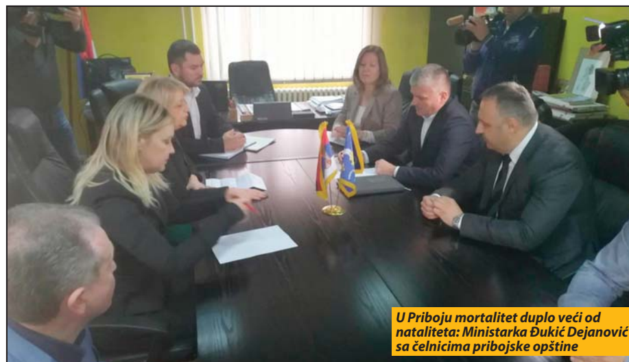
U Priboju mortalitet duplo veći od nataliteta: Ministarka Đukić Dejanović sa čelnicima pribojske opštine

U Priboju je duplo veći mortalitet od nataliteta, na hiljadu stanovnika, rodi se sedam beba dok 14 ljudi umre godišnje. Ministarka je taj podatak nazvala poražavajućim i rekla da se mere za poboljšanje tako loše demografske slike, koje se sprovo-