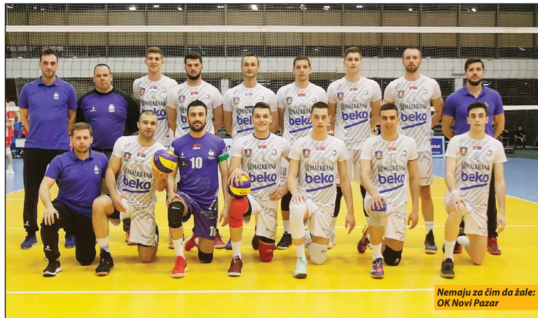
Nemaju za čim da žale: OK Novi Pazar

Pobedom u Novom Pazaru Vojvodina osvojila šampionsku titulu 15. put