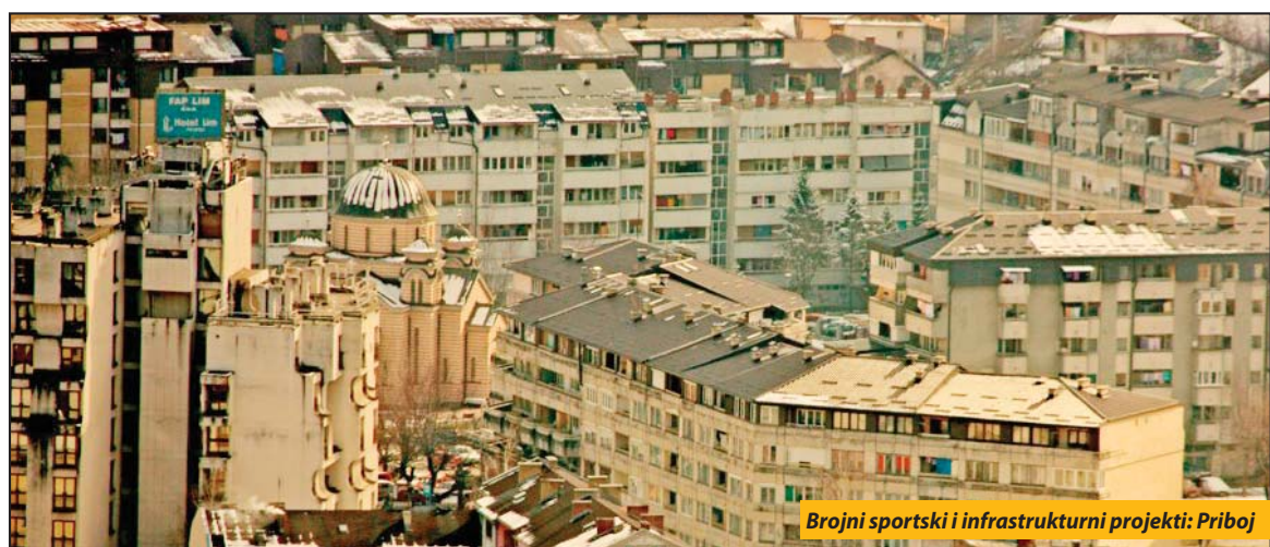
Brojni sportski i infrastrukturni projekti: Priboj

Priboj - Opština Priboj će ove godine, početkom jula, biti domaćin 55. Međuopštinskih sportskih igara. Ovo je sedmi put da se MOSI održavaju u Priboju. U okviru infrastrukturnih priprema ovih dana grade se i uređuju sportski tereni, ali i ostali gradski objekti.