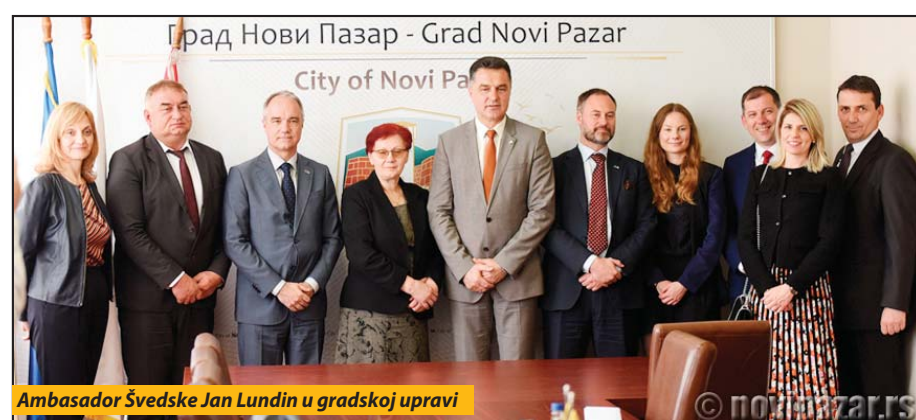
Ambasador Švedske Jan Lundin u gradskoj upravi

U gradskoj upravi, švedski diplomata je sa prvim ljudima grada razgovarao o političkim, ekonomskim i kulturnim aktuelnostima u ovom gradu, ali i o ljudima koji žive u Švedskoj a poreklom su sa ovih prostora. „Danas smo se upoznali sa potencijalima Novog Pazara i dogovorili u kojim oblastima možemo nastaviti saradnju“, rekao je ambasador Lundin nakon razgovora sa predstavnicima gradske uprave i dodao da su predstavnici grada boravili u Švedskoj na obuci o sistemu civilne zaštite u saradnji sa Stal-