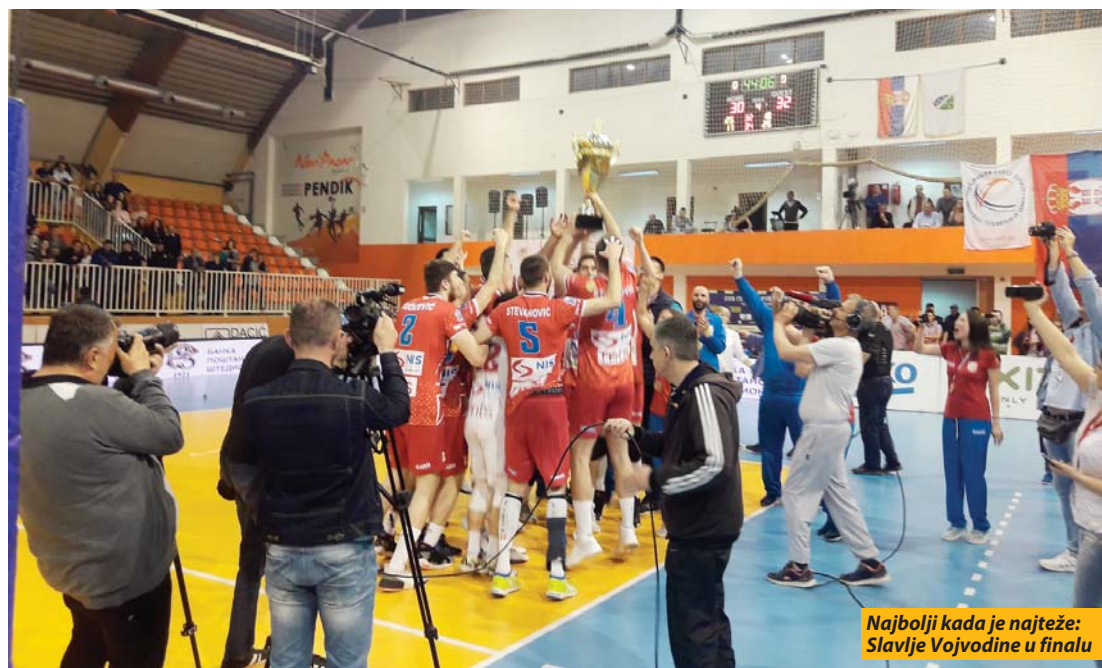
Najbolji kada je najteže: Slavlje Vojvodine u finalu

Način na koji je Novi Pazar u trećem meču nadvisio Vojvodinu nema kod koga nije proizveo nadu da je peti