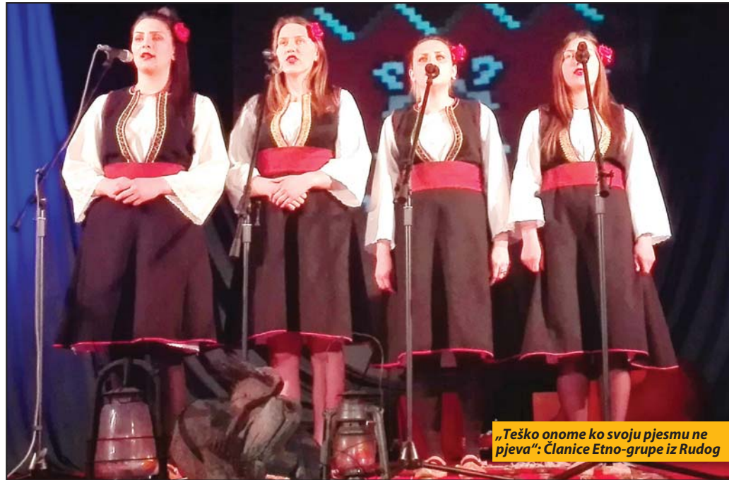
„Teško onome ko svoju pjesmu ne pjeva“: Članice Etno-grupe iz Rudog