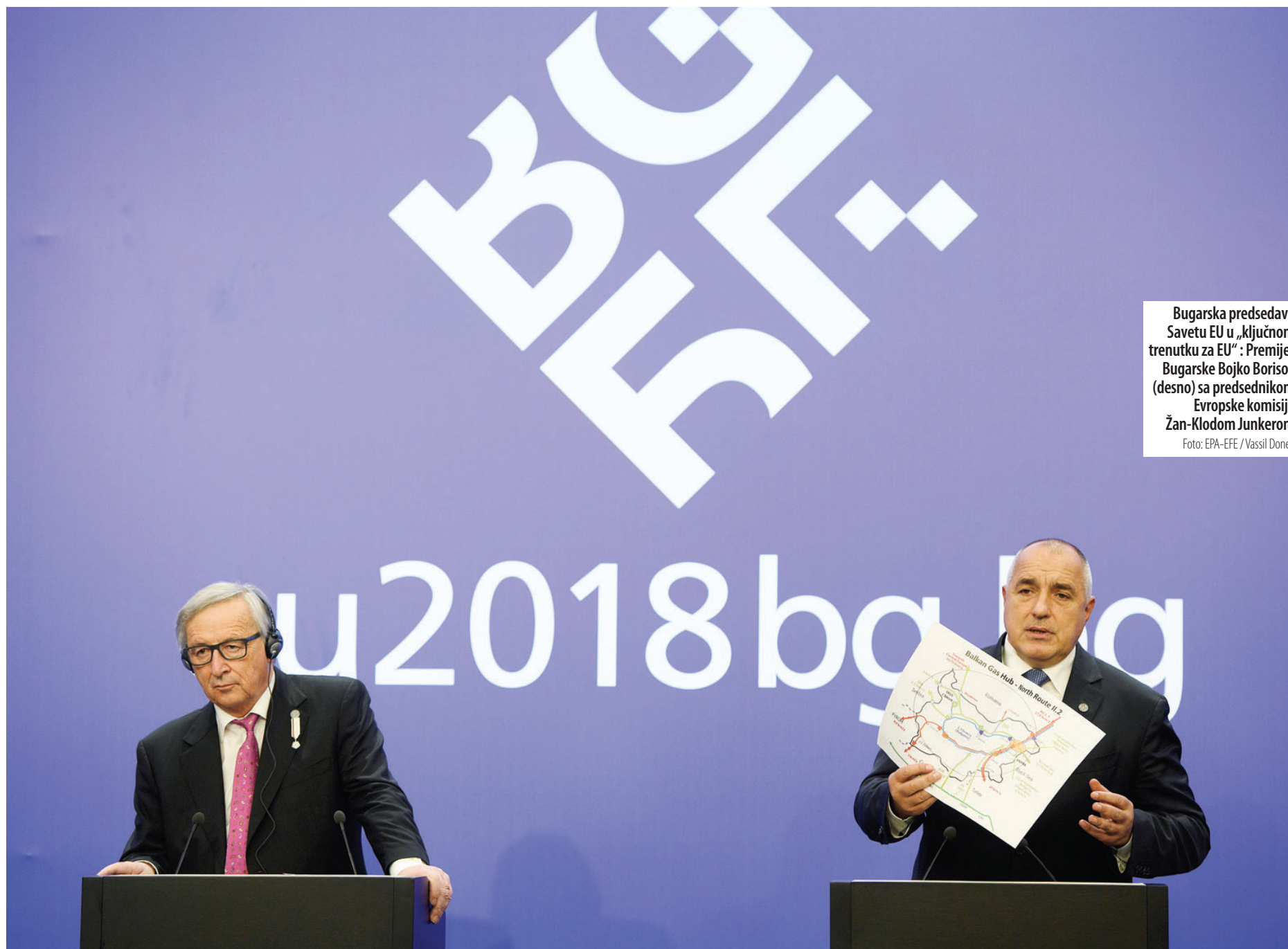
Bugarska predsedava Savetu EU u „ključnom trenutku za EU“: Premijer Bugarske Bojko Borisov (desno) sa predsednikom Evropske komisije Žan-Klodom Junckerom

POSEBNO IZDANJE POVODOM SAMITA EU – ZAPADNI BALKAN U SOFIJI • ČETVRTAK, 17. MAJ 2018.