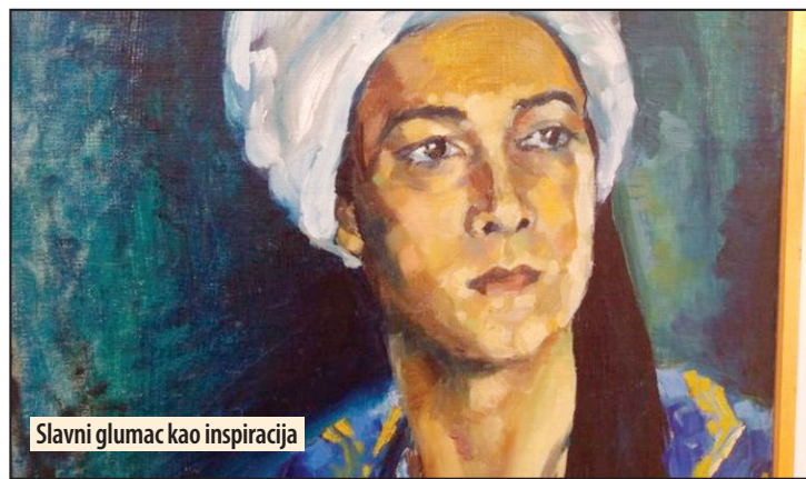
Slavni glumac kao inspiracija

Požarevački muzej i galerija „Barili“ 11. put u manifestaciji „Noć muzeja“