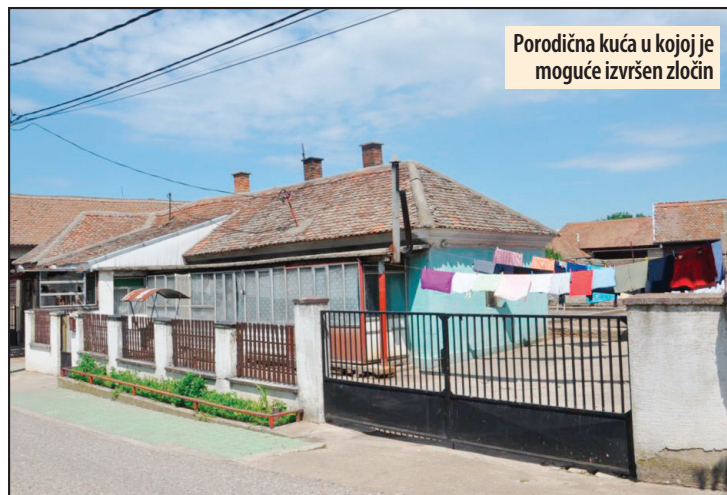
Porodična kuća u kojoj je moguće izvršen zločin

Posle hapšenja, policija je izvršila pretres njegove porodične kuće i uzela biološke dokaze, koji će se analizirati i koristiti na sudu. Posle istrage usledice podizanje optuženice, a onda zakazivanje glavnog pretresa u Višem sudu u Požarevcu