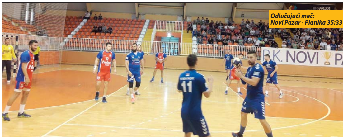
Odlučujući meč: Novi Pazar - Planika 35:33

Karakterom i temperamentom menja ekipu na bolje, oplemenjuje, nado-