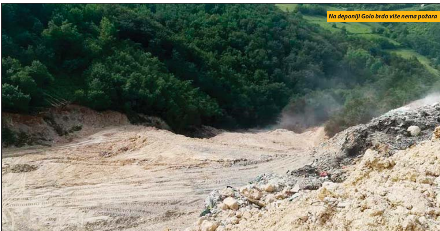
Na deponiji Golo brdo više nema požara