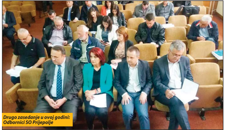
Drugo zasedanje u ovoj godini: Odbornici SO Prijepolje

grama od javnog interesa koje realizuju udruženja sredstvima budžeta kao i predlogu godišnjeg programa zaštite, uređenja i korišćenja poljoprivrednog zemljišta. Na ovoj sednici pono-