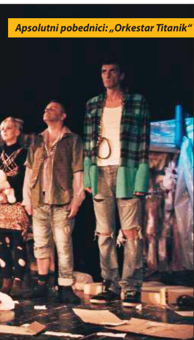
Apsolutni pobednici: „Orkestar Titanik“

živom „Tri poetike orijentalnog“, obuhvata 19 radova rađenih tehnikom akrilika na platnu i kombinovana tehnika na platnu. Zajednička inspiracija i motiv autorima su islamska umetnost i arhitektura. S. D.