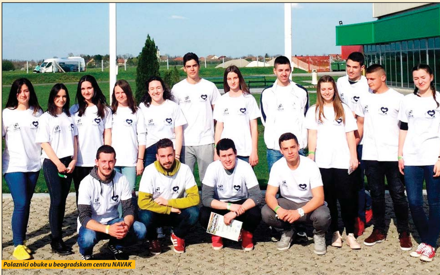
Polaznici obuke u beogradskom centru NAVAK

Mladi vozači iz Nove Varoši na poligonima Nacionalne vozačke akademije