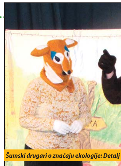
Šumski drugari o značaju ekologije: Detalj