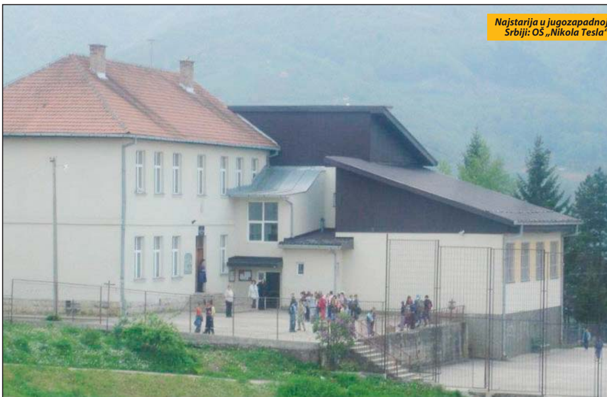
Najstarija u jugozapadnoj Srbiji: OŠ „Nikola Tesla“