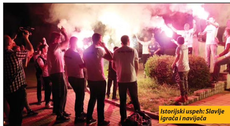
Istorijski uspeh: Slavije igrača i navijača

Možda je i bolje što se na ovakav način stiglo do Superlige. Da se pobeđivalo tako da se samo postavljalo pitanje krajnje gol razlike, verovatno, ni dimenzija ovog uspeha ne bi bila vrednovana na pravi način. Sad je najzanimljivije s kojim snagama će Novi Pazar od jeseni „na crtu“ Metaloplastici, Železničaru, Vojvodini, Zvezdi i Partizanu, ko od igrača odlazi, ko ostaje, ko dolazi, ko će biti trener. Da će do promena doći, odnosno da ih mora biti, to je svima jasno.