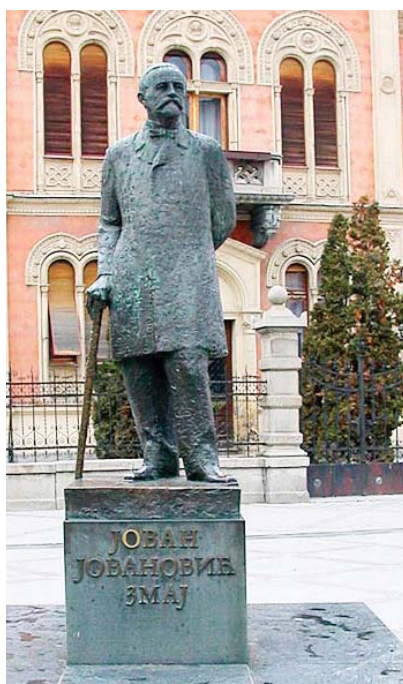
Spomenik Jovanu Jovanoviću Zmaju