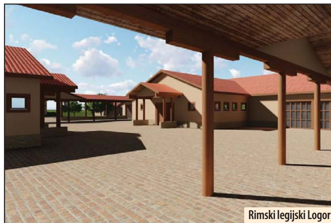
Rimski legijski logor