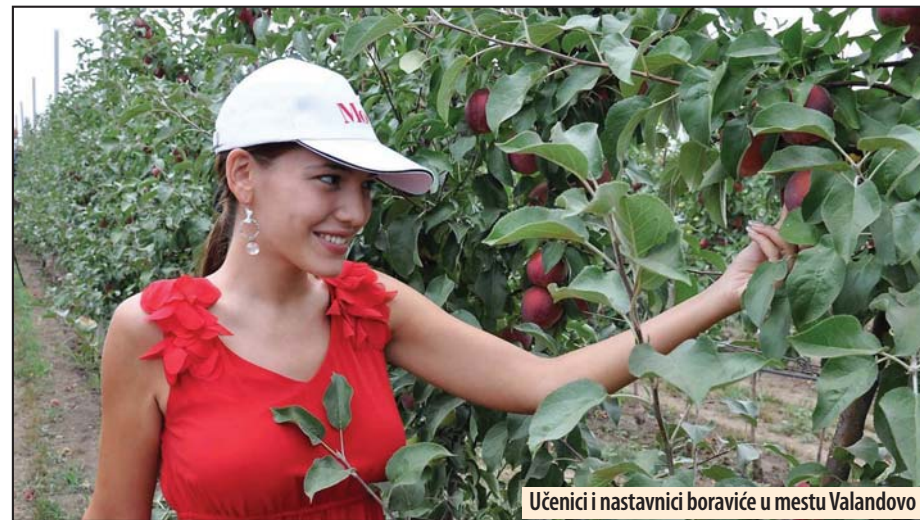
Učenici i nastavnici boraviće u mestu Valandovo

Projekat u okviru programa Erasmus plus finansira Evropska unija i organizuje se u partnerstvu sa organizacijom PRO-BIO iz Makedonije. Projekat traje do maja 2019. godine a angažovanje 12 učenika i 3 nastavnika planirano je u periodu od 10. do 24. septembra. Učenički koji učestvuju u projektu su iz odeljenja trećeg i četvrtog razreda obrazovnog profila poljoprivredni tehničar, nastavnici