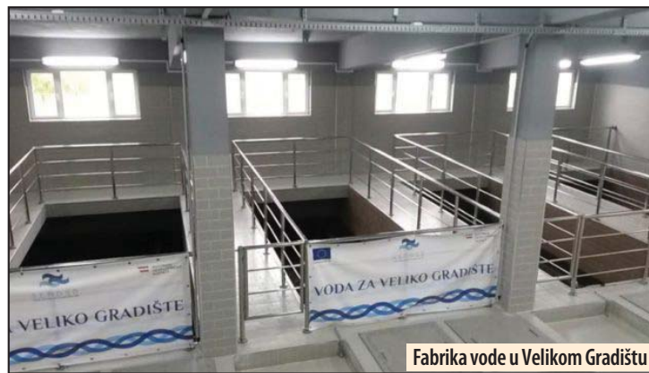
Fabrika vode u Velikom Gradištu

Veliko Gradište - Na području opštine Veliko Gradište, voda iz seoskih vodovoda zabranjena je za piće u Srednjevu, Kamijevu, Topolovniku, Kumanu i Tribrodu, zbog zdravstvene neispravnosti. Poslednja ispitivanja Zavoda za javno zdravlje Požarevac, pokazala su da je voda iz ovih vodovoda fizičko-hemijski ili mikrobiološki neispravna, jer je u njima povećana vrednost nitrata ili su registrovane bakterije fekalnog porekla. Zbog toga se ne može koristiti za piće i pripremu hrane, već samo kao tehnička, za održavanje higijene. M. V.