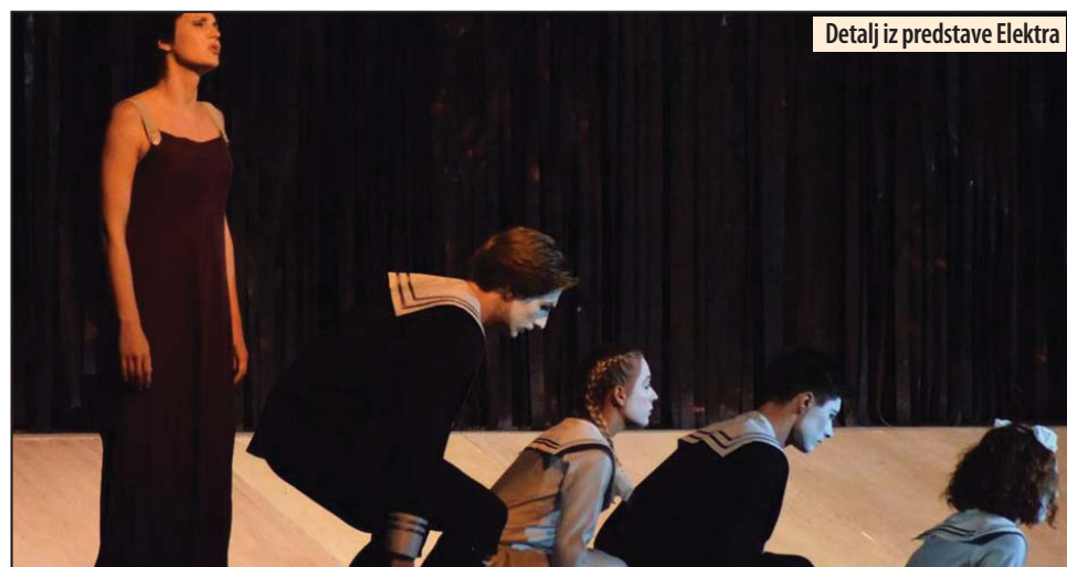
Detalj iz predstave Elektra