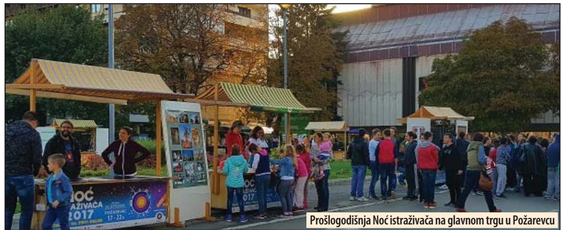
Prošlogodišnja Noć istraživača na glavnom trgu u Požarevcu

Ove godine Požarevac je u zvaničnom saopštenju za medije izostavljen sa liste gradova gde će se održati ova manifestacija, međutim na zvaničnom sajtu ove manifestacije, Požare-