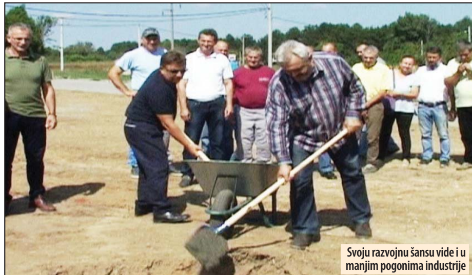
Svoju razvojnu šansu vide i u manjim pogonima industrije