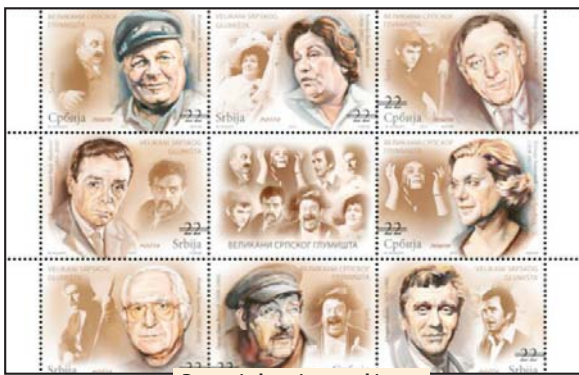
Poznati glumci na markicama