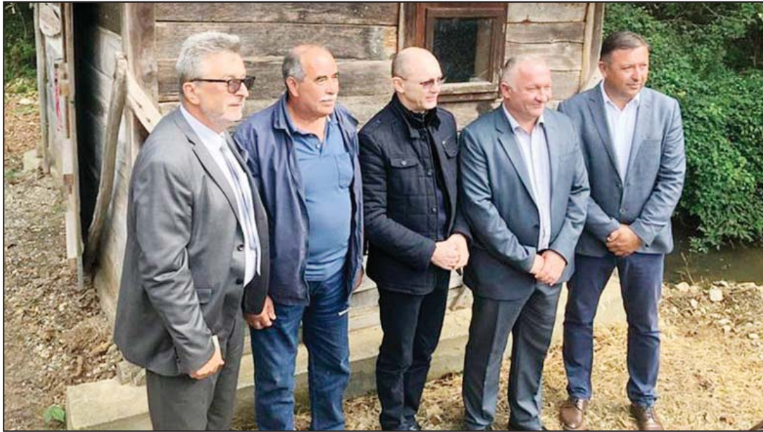
Ministar Goran Trivan posetio Opštinu Petrovac na Mlavi