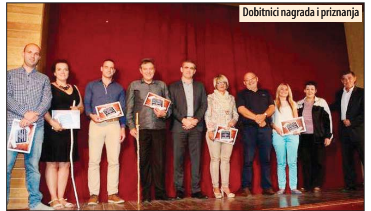
Dobitnici nagrada i priznanja

Nagrađeni najbolji na Festivalu amaterskih pozorišta „Štap i kanap“