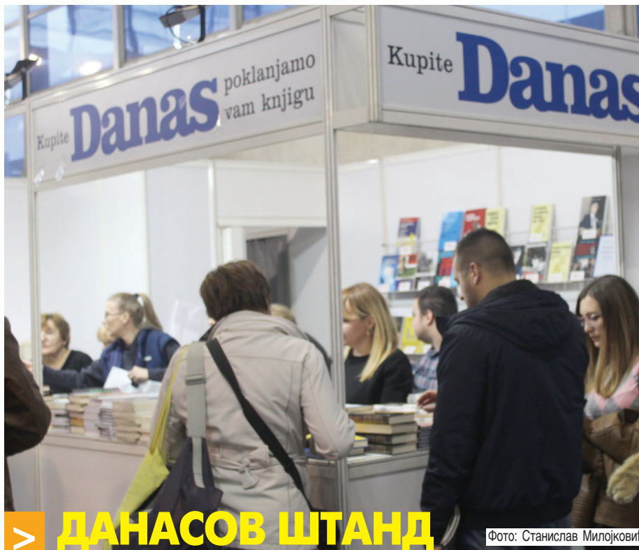
ДАНАСОВ ШТАНД ове године у Хали 2 Београдског сајма