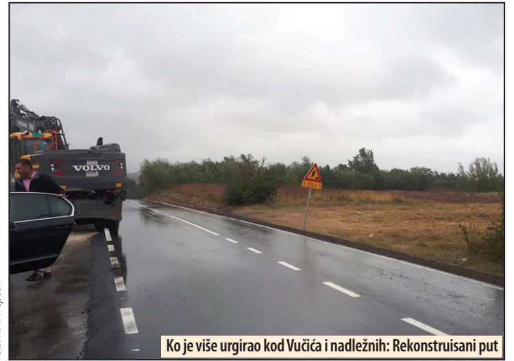
Ko je više urgirao kod Vučića i nadležnih: Rekonstruisani put