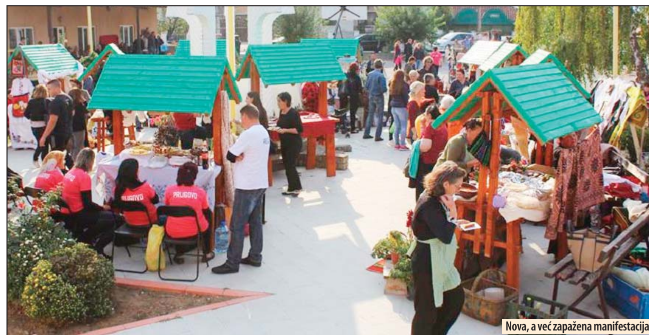
Nova, a već zapažena manifestacija

U prepodnevnom časovniku učesnici takmičenja u pripremanju svadbarskog kupusa zagrejali su svoje kotliče i stavili kupus na krčkanje. U 15 časova otvorena je izložba udruženja iz čitave Srbije koja su na štandovima uređenim u tradicionalnom duhu predstavili najdragocennije stvari njihovog zavičaja. Vez, tkanice, kolveke, grnčarija i naravno, naj-