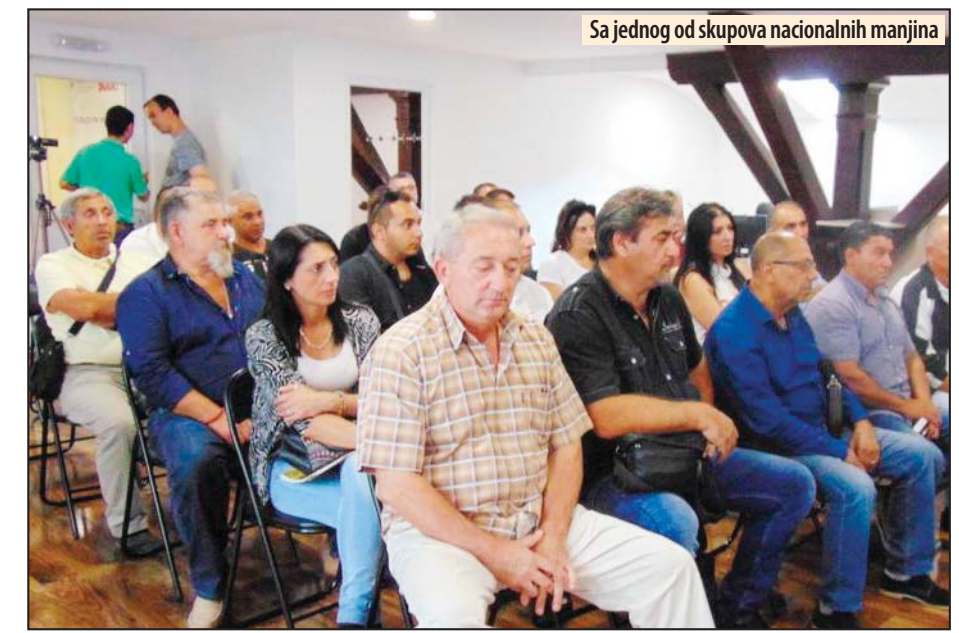
Sa jednog od skupova nacionalnih manjina

naca (3) i po jedan Ukrajinac i Egipćanin. Na teritoriji Gradske opštine Kostolac druga nacionalna manjina po broju upisanih u poseban birački spisak su Slovenci (26), a potom Rusi (14), pa Grci (9), Vlasi (6), Albanci (3) i jedan pripadnik rumunske nacionalne manjine. Z. V.