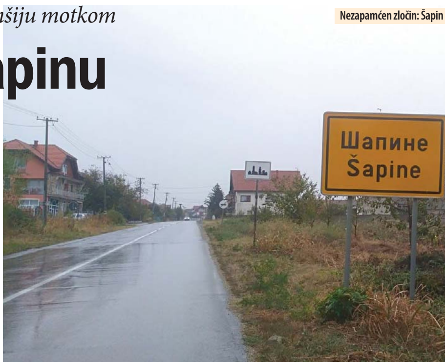
Nezapamćen zločin: Šapin

Uhapšeni Mladen nekad je bio dobar majstor, bavio se zidarsko-fasaderskim poslom.