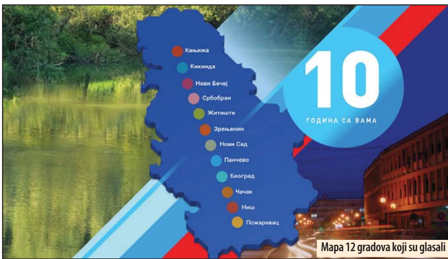
Mapa 12 gradova koji su glasali

Požarevac - Kompanija NIS donela je odluku o obustavi glasanja za projekte u 12 gradova Srbije, zbog uočenih neregularnosti. Građani iz tih gradova izjašnjavali su se glasanjem koje projekte žele da se realizuju u njihovim gradovima, u okviru programa „Zajednici zajedno 2018“.