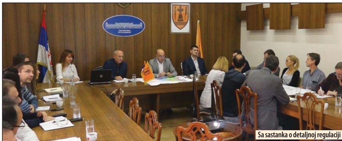
Sa sastanka o detaljnoj regulaciji

- Sa ovim planom grad u budućnosti neće imati problem sa električnom energijom, neće imati problem sa brzim izdavanjem građevinskih dozvola, kako za porodične stambene zgrade, tako i za privredne objekte. Insistirali