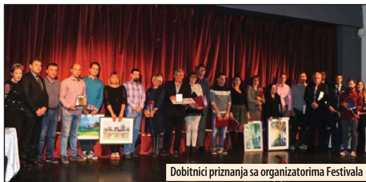
Dobitnici priznanja sa organizatorima Festivala

Poštovaoci pozorišne umetnosti bili su u prilici da vide deset predstava u takmičarskoj konkurenciji. Raznovrsnost repertoara, glumačka uverljivost i maštovite rediteljske zamisli ostale su prepoznatljiva odlika FEDRASA. Publika se susrela sa obiljem likova, dramskih zapleta i rediteljskim idejama, što je sve obogatilo i opravdalo smisao, razloge i cilj opstajanja i trajanja ovog jedinstvenog festivala.