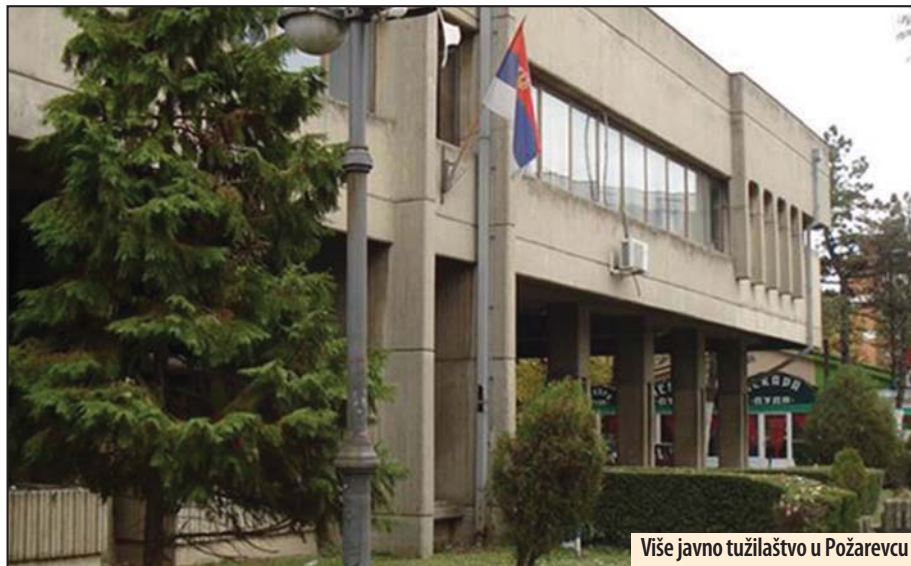
Više javno tužilaštvo u Požarevcu