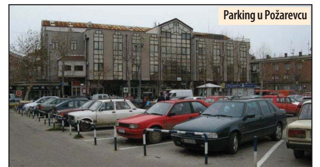
Parking u Požarevcu

Osim na ovoj lokaciji, zatvoreni parkinzi nalaze se još u Sindićevoj ulici, kod zelene pijace „Krug“, kod Osnovnog suda i kod Centra za kulturu. Na njima ima ukupno 300 mesta, plus još 900 na brojnim uličnim parkinzima, što iznosi 1.200. Međutim,