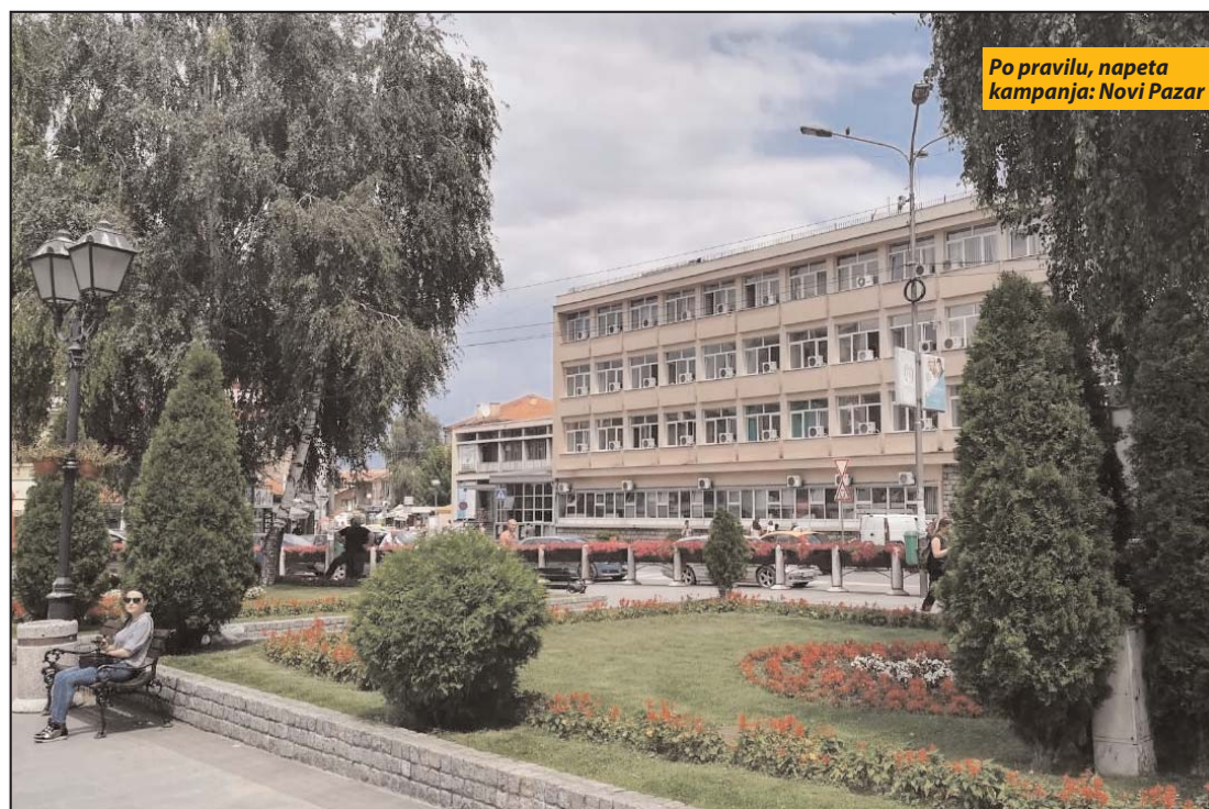
Po pravilu, napeta kampanja: Novi Pazar