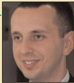
Piše: Teo Taranis

U jednoj od svojih pesama regionalno popularni B-H bend "Dubioza kolektiv" primećuje da nas "teraju na izbore svake dvije godine". U gust raspored izbora na različitim nivoima Srbija je ove godine uspela da "ugura" izbore za nacionalne savete nacionalnih manjina. Uz napomenu da se, za razliku od nekih drugih, ovi izbori odvijaju u pravilnim vremenskim razmacima - na četiri godine, prilika je to da se, s jedne strane, kod manjinskih zajednica stvori privid učešća u procesu donošenja odluka "o sebi i za sebe" i da se, na drugoj strani, većinskoj zajednici, uz svesrdnu medijsku podršku, skrene pažnja sa aktualnih društvenih problema usmeravanjem na političke "ratove" unutar manjinskih zajednica.