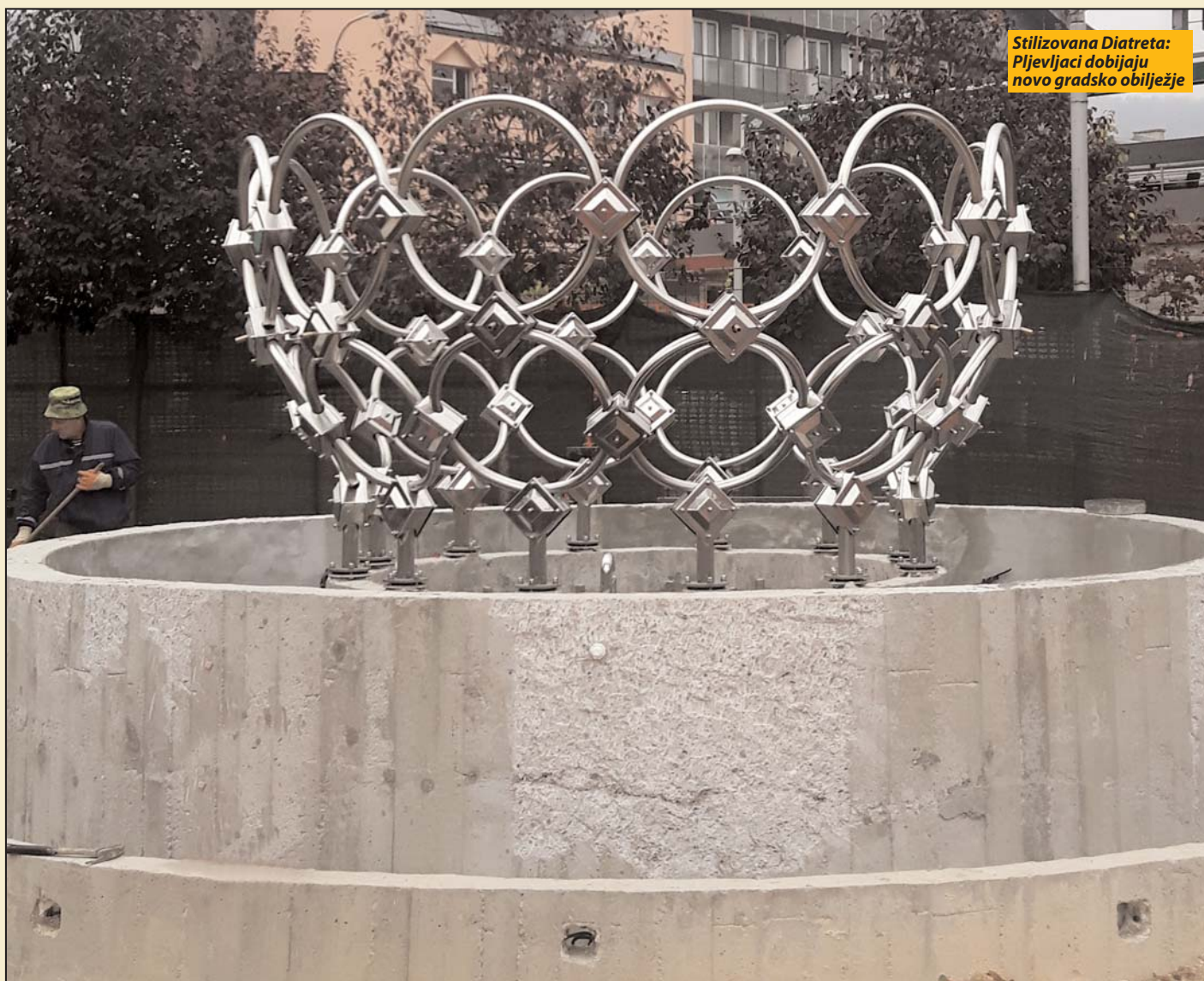
Stilizovana Diatreta: Pljevljaci dobijaju novo gradsko obilježje

Radovi počeli pre tri godine privedeni kraju