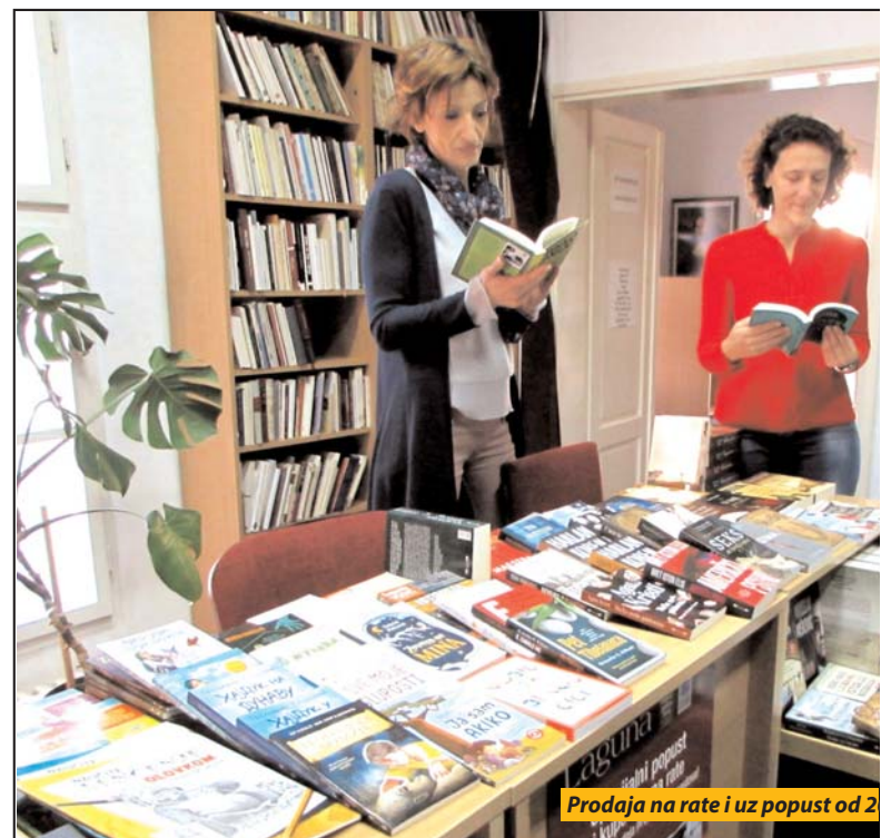
Prodaja na rate i uz popust od 2