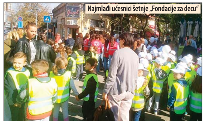
Najmlađi učesnici šetnje „Fondacije za decu“

Izložba za ljubitelje maketarstva i minijatura