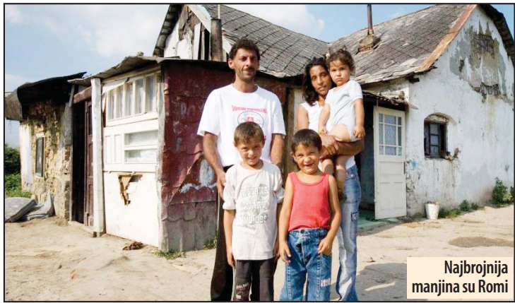
Najbrojnija manjina su Romi

ćić će da se glasa na dva izborna mesta i to u Požarevcu u prostorijama Mesne zajednice Radna mala, a u Kostolcu u prostorijama Gradske opštine. Ovom prilikom izdvajamo da je do sada upisan broj birača najbrojnijih nacionalnih manjina