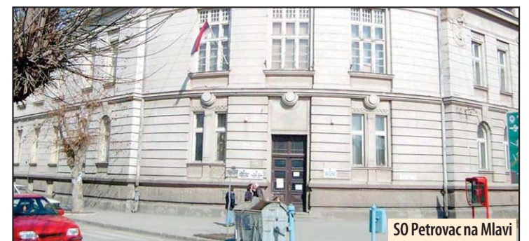
SO Petrovac na Mlavi