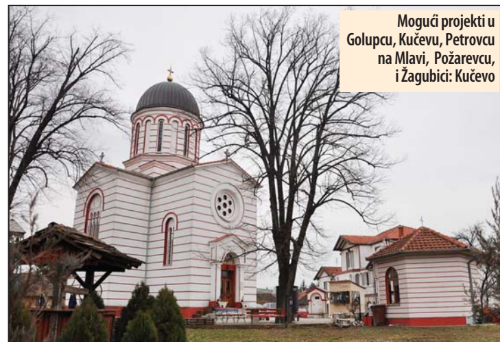
Mogući projekti u Golupcu, Kučevu, Petrovcu na Mlavi, Požarevcu, i Žagubici: Kučevo

Cilj informativne sesije jeste da se organizacije civilnog društva koje su registrovane u multietničkim opštinama Braničevskog, Borskog i Zaječarskog okruga, Golupcu, Kučevu, Petrovcu na Mlavi, Požarevcu, Žagubici, Boru, Majdanpeku, Negotinu i Boljev-