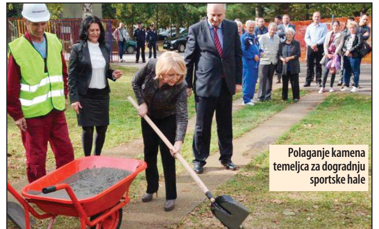
Polaganje kamena temeljca za dogradnju sportske hale

- SNS je ostvarila i te kako vidljive rezultate otkada je preuzela odgovornost vođenja države. Svake godina bila je godina napretka i imamo obavezu da i sledećih deset godina da svaka godina bude bolja od prethodne. Članovi SNS-a danas obeležavaju i slave Svetu Petku