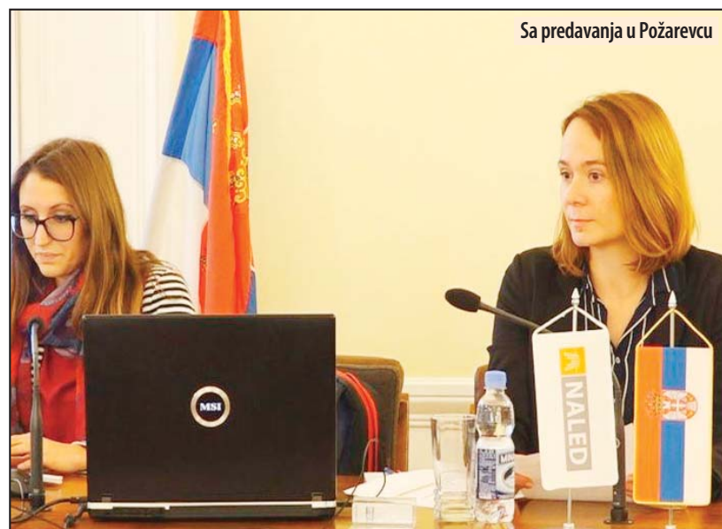
Sa predavanja u Požarevcu

skim poslovima u određenim delatnostima. Predavanje koje su organizovali Grad Požarevac i NALED, a namenjeno je poslodavcima iz oblasti poljoprivrede i sezonskim radnicima.