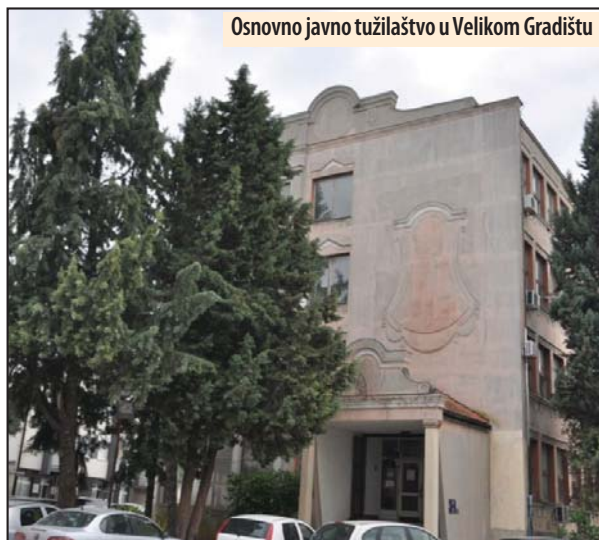
Osnovno javno tužilaštvo u Velikom Gradištu

Narednih dana sledi istraga, tokom koje će se saslušati svedoci i obaviti psihijatrijsko veštačenje osumnjičenog, da bi se utvrdilo da li je uračunljiv. Za krivično delo proganjanje zakonom je predviđena kazna do tri godine, a za polno uznemiravanje do šest meseci zatvora. Tužilaštvo i policija apeluju na građane koje je osumnjičeni uznemiravao da to i prijave, kao i da prijave bilo čija uznemiravanja, kako bi se vinovnici procesuirali na osnovu novog krivičnog dela - proganjanje, uvedeno u krivični zakon od ove godine. M. V.