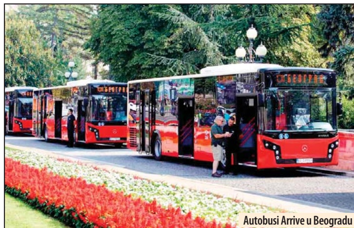
Autobusi Arrive u Beogradu

- Kao kompanija koja je deo Arriva Grupe, koja obezbeđuje transportne usluge najvišeg kvaliteta u 14 evropskih zemalja i godišnje ostvaruje oko 2,2 milijarde putovanja, imamo obavezu i od-