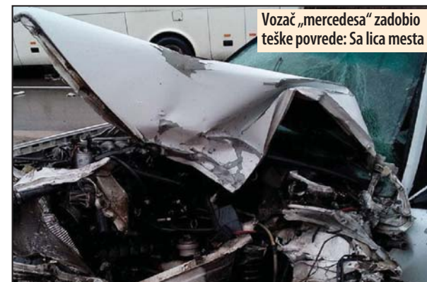
Vozač „mercedesa“ zadobio teške povrede: Sa lica mesta

Vozač automobila zadobio je teške povrede i kolima hitne pomoći prevezen je u petrovačku bolnicu gde mu je ukazana pomoć. Pored povredene noge, lekari su posumnjali da ima i unutrašnja krvarenja, te su ga poslali na dalje lečenje i dijagnostiku u beogradski urgentni centar. Deca koja su se nalazila u autobusu, kao i vozač auto-