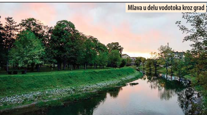
Mlava u delu vodotoka kroz grad