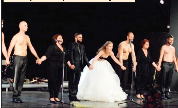
Priredili četiri pozorišna festivala, od toga jedan novi u Viminacijumu: Nakon predstave „Hasaganinica“