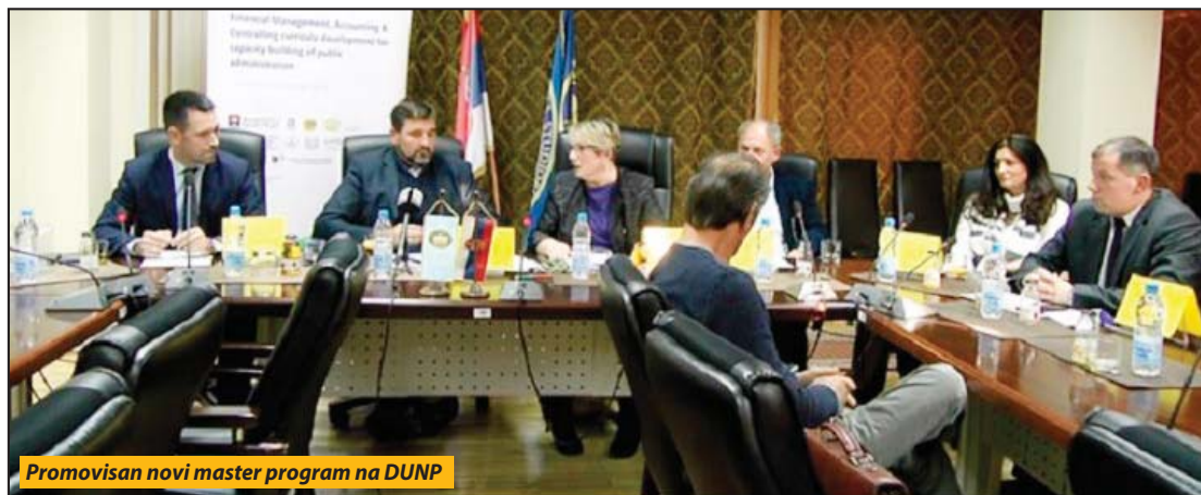
Promovisan novi master program na DUNP