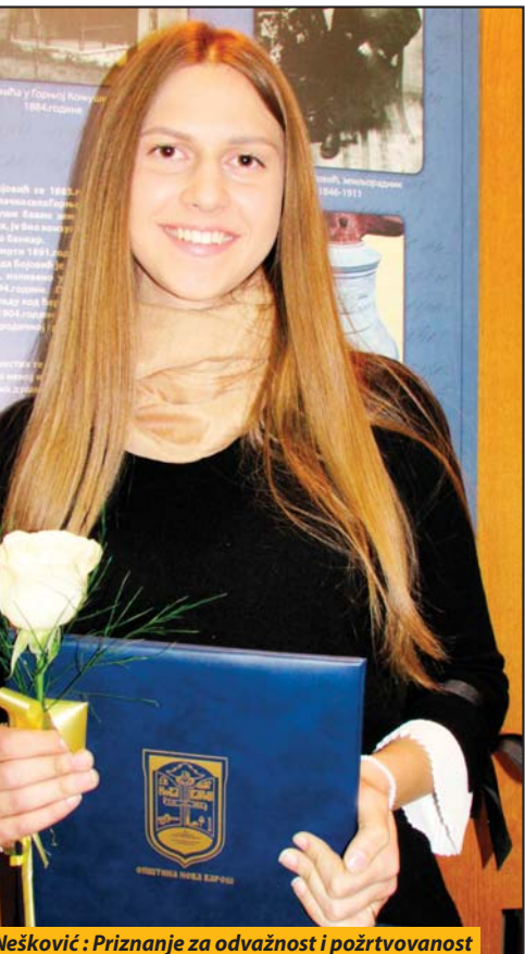
Nešković: Priznanje za odvažnost i požrtvovanost

■ Svojom prvom intervencijom učenice Medicinske škole položile ispit stručnosti i test humanosti