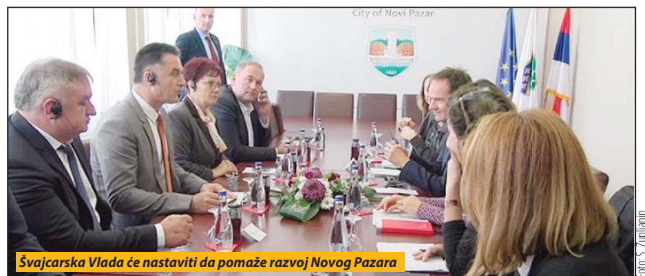
Švajcarska Vlada će nastaviti da pomaže razvoj Novog Pazara

zovaće se program Swiss PRO, u okviru kojeg će Novom Pazaru i Raški biti pružena podrška za unapređenje i poboljšanje internih procedura za finansiranje lokalnih projekata. U Novom Pazaru i Kraljevu kroz projekte socijalne uključenosti, biće podržani mladi iz osetljivih grupa, kako bi se unapredile njihove veštine i mogućnosti za zapošljavanje. U svih pet lokalnih samouprava Raškog okruga u toku je četvorogodišnji projekat, koji se završava sledeće godine, „Jačanje nadzorne funkcije i transparentnosti u radu Narodne skupštine“, čiji je cilj unapređenje rada odbornika i skupštinskih službi. SDC u sa-