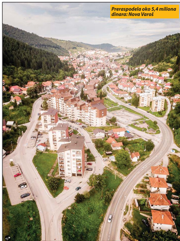
Preraspodela oko 5,4 miliona dinara: Nova Varoš