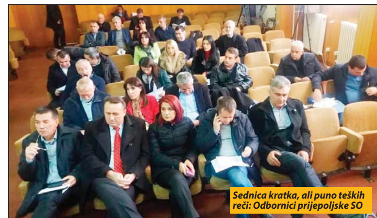
Sednica kratka, ali puno teških reči: Odbornici prijepoljske SO

hodna stavka se rebalansom ne menja već je reč samo o preraspodeli sredstava sa stavki koje neće biti izvršene do kraja godine. Jedna od onih vezana je za investiciju, put Kolovrat-Seljašnica za šta je iz budžeta isplaćeno do sada samo sedam miliona dinara. Značajna planirana sredstva prenose se u narednu godinu.