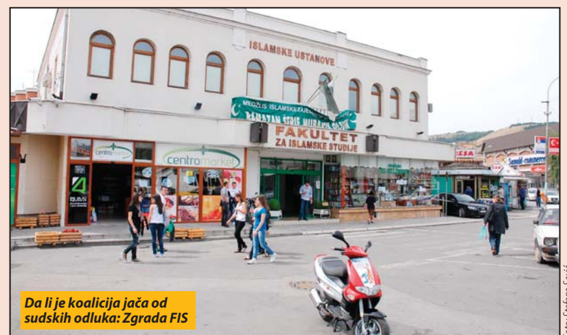
Da li je koalicija jača od sudskih odluka: Zgrada FIS