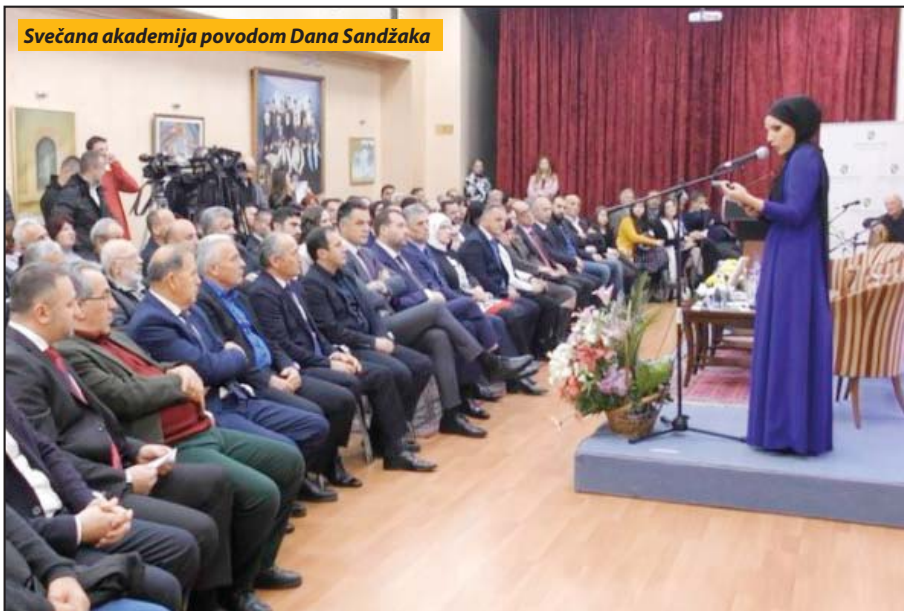
Svečana akademija povodom Dana Sandžaka