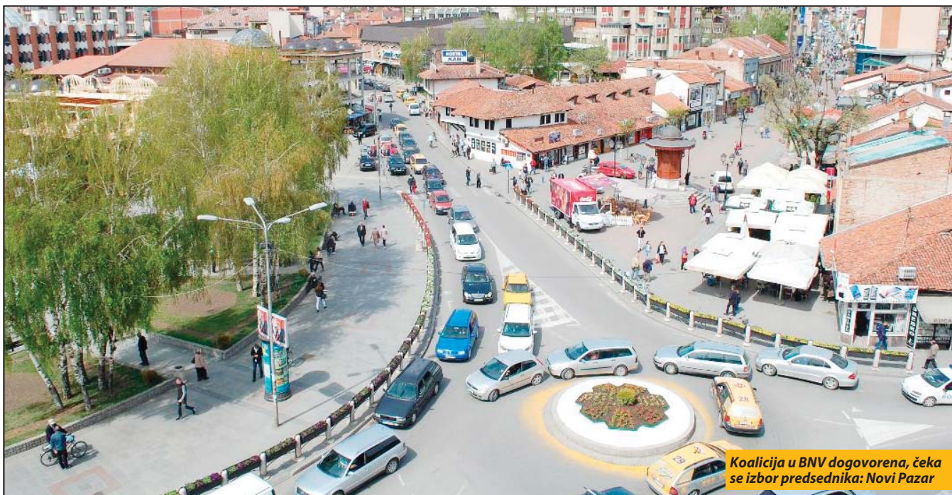
Koalicija u BNV dogovorena, čeka se izbor predsednika: Novi Pazar