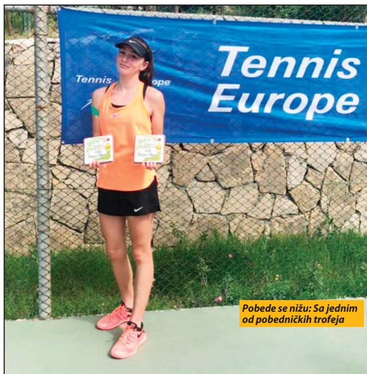
Pobede se nižu: Sa jednim od pobjedničkih trofeja

- Udaram snažno, asova bude četiri do pet po meču. Fajter sam, kao i moje ljubimice Serena Vilijams i Ana Ivanović.