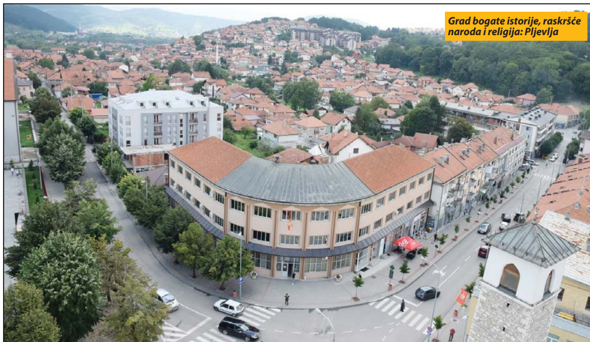
Grad bogate istorije, raskršće naroda i religija: Pljevlja