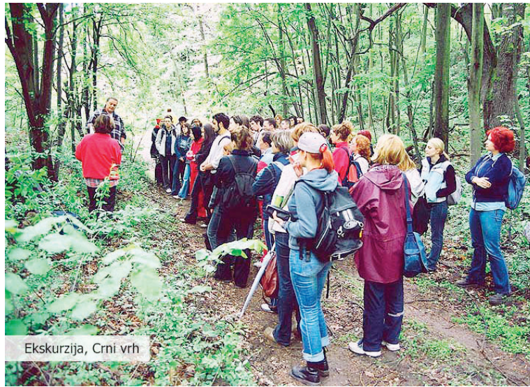
Ekskurzija, Crni vrh