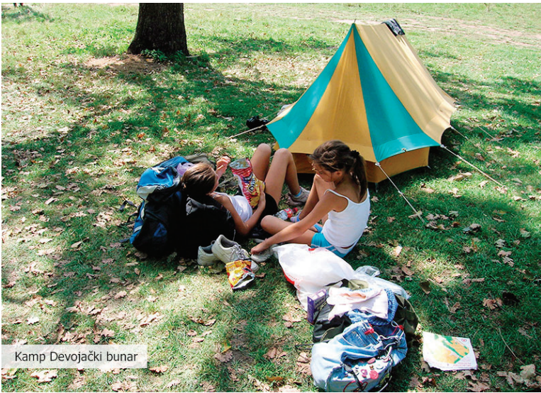
Kamp Devojački bunar

Ruta kreće od Francuske, preko Švajcarske, Nemačke, nastavlja se kroz Austriju, Slovačku, Mađarsku i Hrvatsku do Srbije, i dalje do Rumunije i Bugarske.