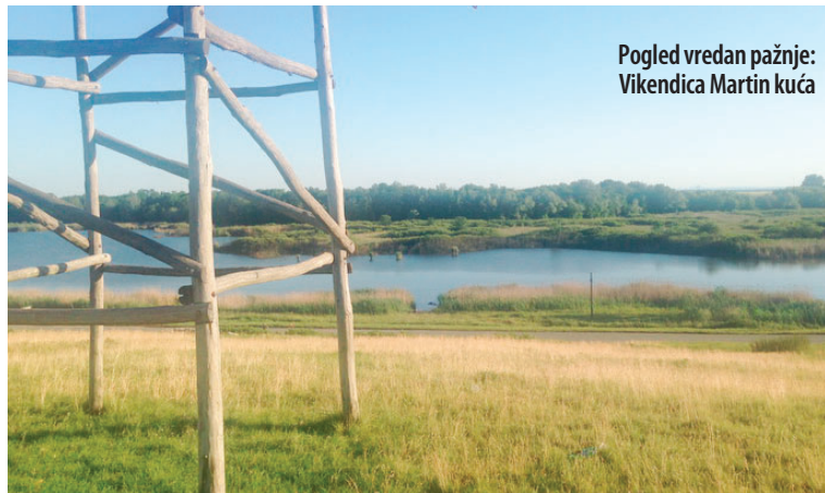
Pogled vredan pažnje: Vikendica Martin kuća