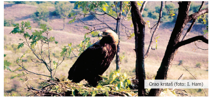
Orao krstaš

Životinjski svet Deliblatske peščare odlikuju peščarski insekti i vrste stepskih staništa: orao krstaš, stepski soko, tekunica, slepo kuće i stepski skočimiš. U šumskim staništima značajno je stalno prisustvo vukova, jelena, srna i divljih svinja, dok vodeni ekosistemi obale i ada Dunava predstavljaju gnezdišta ptica močvarica i privremena obitavališta ptica selica, dok je površina nezaleđenog Dunava masovno zimovalište divljih pataka i gusaka.