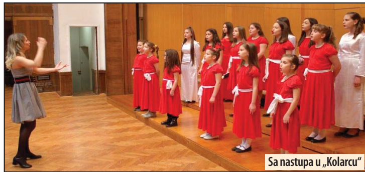
Sa nastupa u „Kolarcu“

gradu na Mlavi postoji 111 godina. Posle kulturnih predstava „Kako smo voleli druga Tita“, koja je igrana više od 140 puta i „Balkanskog špijuna“ igranog preko 50 puta, predstava „Mi čekamo bebu“ grabi krupnim koracima ka sličnim rekordima. Z. V.