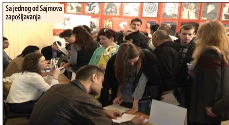
Sa jednog od Sajmova zapošljavanja

- Organizovaćemo još jednu obuku za osobe sa invaliditetom u Požarevcu. Obuka će biti za knjigovođe i uključena će biti pet lica. Obuka je počela 6. decembra, a prema planu traje 240 časova. Započeli smo i obuku za knjigovođe za pet lica u Požarevcu 29. oktobra