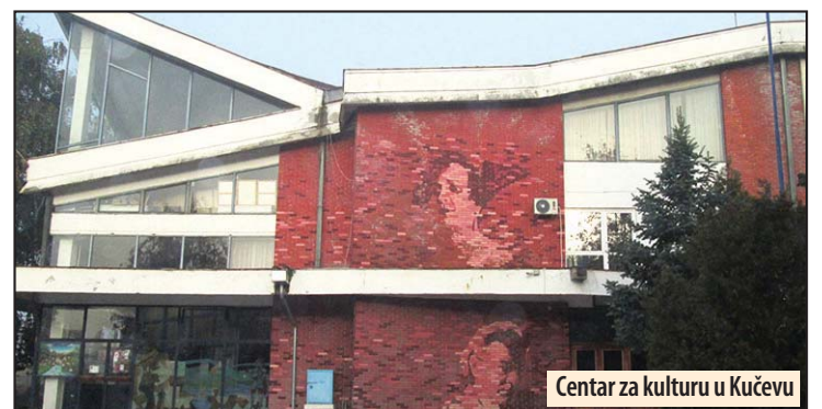
Centar za kulturu u Kučevu

Program će biti šarolik, kretaćemo se putevima klasike, džez, pop muzike, ali i izvornih narodnih pesama. Ulaznice za koncert mogu se kupiti u bilet servisu Centra za kulturu, a cena je 400 dinara. Sav prihod od prodatih ulaznica biće upotrebljen za unapređenje obrazovno-vaspitnog procesa. Drugu godinu za redom, novogodišnji koncert će se održati i u Malom Crniću, 26. decembra u sali FEDRAS-a, sa početkom u 19 časova, uz slobodan ulaz. M. V.