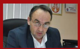
Direktor požarevačkog JP „Toplifkacija“ o poslovanju u 2018. godini

Godina petnaesta, broj 725, dodatak za Braničevski okrug