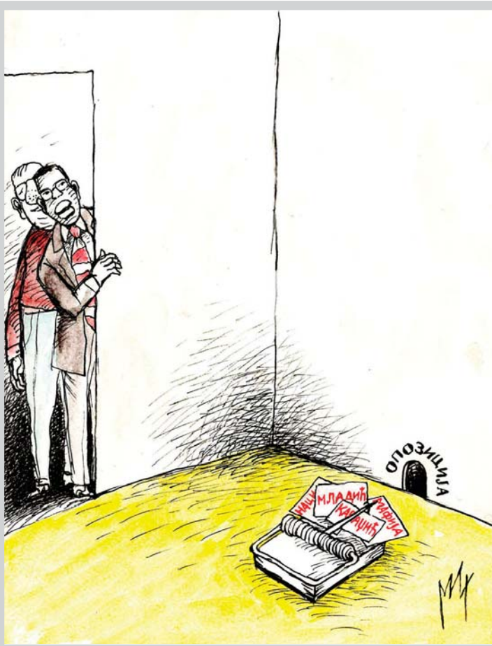
Ilustracija: M. Đerlek

Galerija „Milena Pavlović Barili“ uspešno čuva uspomenu na svetski poznatu slikarku