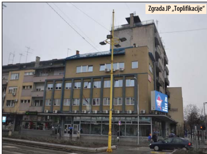
Zgrada JP „Toplifikacija“

Dobar raspored rudarskih mašina uoči zimske sezone na kostolačkim ugljenokopima?