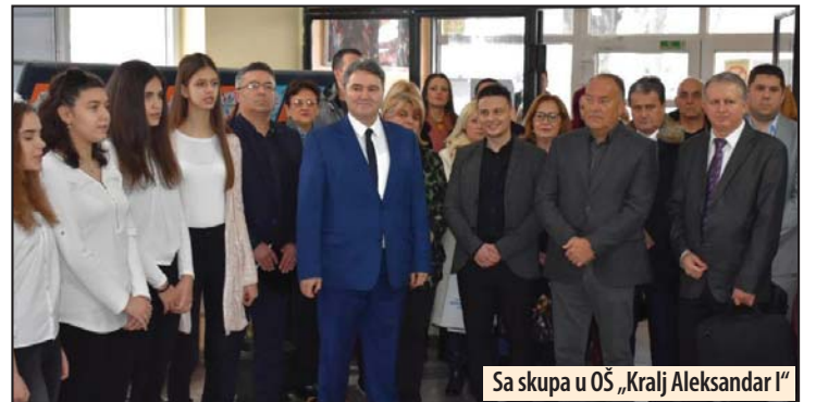
Sa skupa u OŠ „Kralj Aleksandar I“

- Krajem novembra 2018. godine registrovano 7.023 aktivnih tražioca zaposlenja, na teritoriji Braničevskog okruga. U istom periodu 2017. godine aktivnih tražioca zaposlenja je na našoj evidenciji bilo 8.351, a u godini pre, zapravo u istom periodu 2016. godine 9.139. onih koji traže posao, kaže direktorka Filijale NSZ kada je reč o evidenciji nezaposlenih.