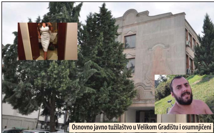
Osnovno javno tužilaštvo u Velikom Gradištu i osumnjičeni

Osnovno javno tužilaštvo u Velikom Gradištu