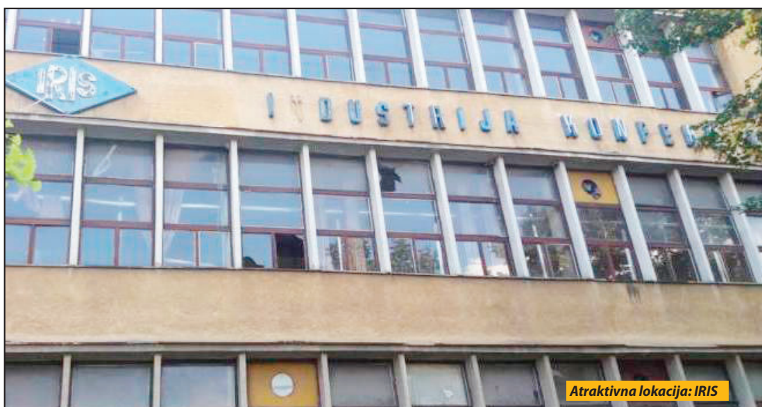
Atraktivna lokacija: IRIS

Agencija za licenciranje stečajnih upravnika oglas o prodaji Irisa objavila je 9. novembra prošle godine, pa je metodom neposredne pogodbe uz prikupljanje pisanih ponuda, u prostorijama Agencije, održana je prodaja stečajnog dužnika Industrije konfekcije, dugmadi i šnala „IRIS“ a.d. kao pravnog lica. No, moglo se samo konstatovati da