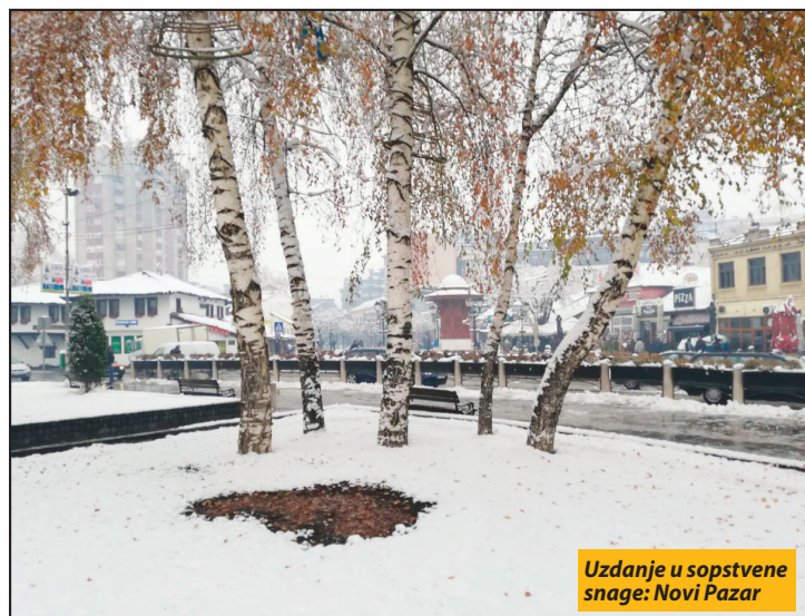
Uzdanje u sopstvene snage: Novi Pazar

Uzdanci privrednog razvoja, u ovom gradu, ostalo je oko 400 proizvođača tekstila i 50 proizvođača obuće. Prema poslednjim podacima objavljenim u dokumentu „Profil zajednice“, koji je uradila gradska uprava, novopazarski konfektionari godišnje proizvedu oko 10 miliona odevnih predmeta, od čega je skoro 70 odsto namenjeno izvozu. Prednjače džins odeva i dečija konfekcija. Kod ovih 400 poslodavaca zaposleno je 1.500 radnika. I u toj grani i dalje nedostaje oko hiljadu šivača. Kod 50 privatnih proizvođača obuće uposleno je tri hiljade radnika, koji go-