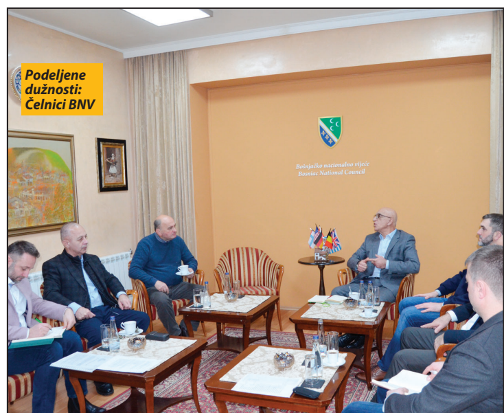
Podeljene dužnosti: Čelnici BNV