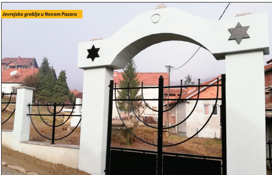
Jevrejsko groblje u Novom Pazaru