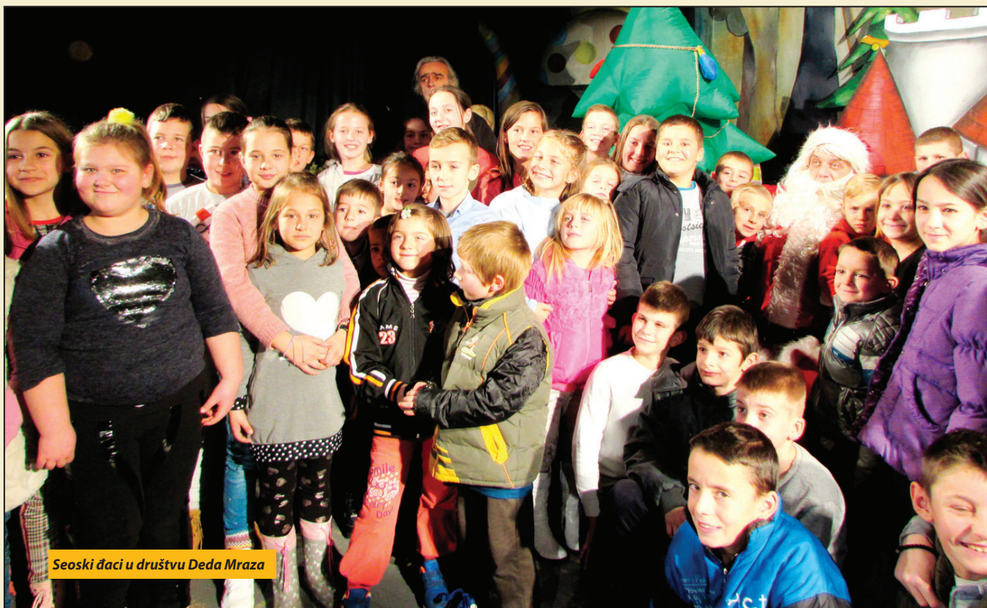
Seoski đaci u društvu Deda Mraza

NOVA VAROŠ - Prazničnu atmosferu osetili su ove godine i predškolci i osnovci iz seoskih škola. Za njih 140 Opština Nova Varoš obezbedila je poklon-paketiće sa slatkišima i školskim priborom, dok im je Dom kulture darivao pozorišnu predstavu „Novogodišnja bajka“ u izvođenju profesionalne trupe beogradskih glumaca.