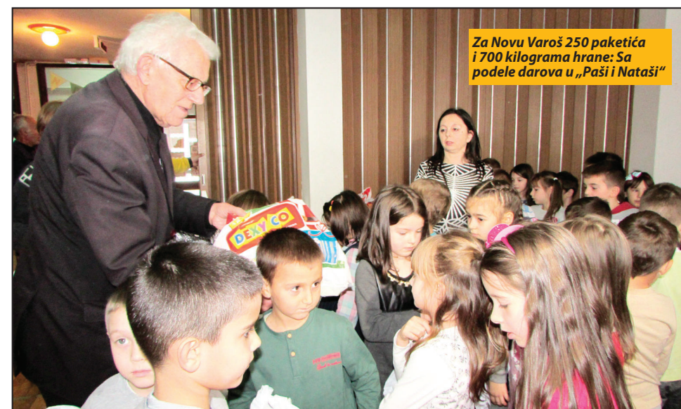
Za Novu Varoš 250 paketića i 700 kilograma hrane: Sa podele darova u „Paši i Nataši“

Humanitarna organizacija „Stara Raška“ ove godine proslavlja dve decenije uspešnog rada i postojanja, tokom kojih smo prikupili sredstva u iznosu od blizu 3,5 miliona evra. Jedna od naših najvažnijih humanitarnih misija je upravo akcija pomoći predškolskim ustanovama u ovom delu Srbije, koju sprovodimo već desetak godina unazad i zahvaljujući kojoj je vrtićima u Novoj Varoši, Pribo-