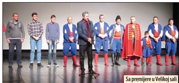
Sa premijere u Velikoj sali