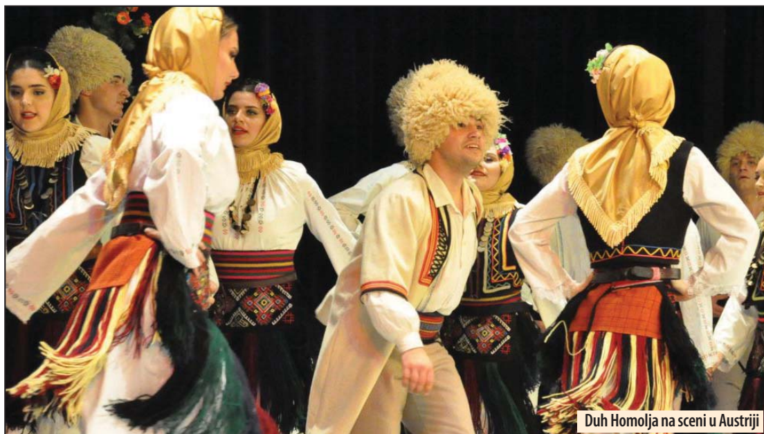
Duh Homolja na sceni u Austriji

Požarevljani i Žagubičani na proslavi Kulturno-sportskog društva u Beču