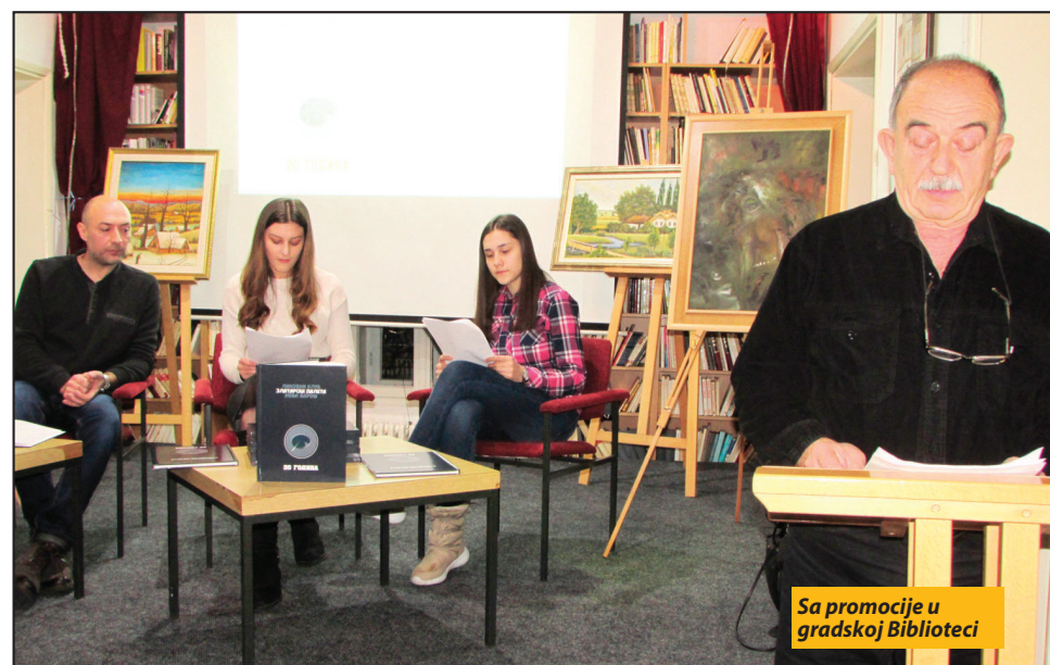
Sa promocije u gradskoj Biblioteci

Monografija je domaćim polkonicima slikarstva prvi put predstavljena pre desetak dana u gradskoj Biblioteci „Jovan Tomić“. Događaju su prisustvovali brojni Novovarošani, među kojima je najviše bilo aktivnih i počasnih članova udruženja. Svi oni ostavili su snažan pečat na lokalnoj umetničkoj sceni, ali i šire jer su mnogi od njih već prilično afirmisani i sa zvanjem akademskih slikara. Među korice monografije, prve ove vrste u nas, sabrane su biografije, dostignuća i osobenosti likovnog senzibiliteta i rukopisa tridesetak novovaroških slikara, kao i retrospektiva najznačajnijih aktivnosti Kluba sa uspešnom i dugom tradicijom.