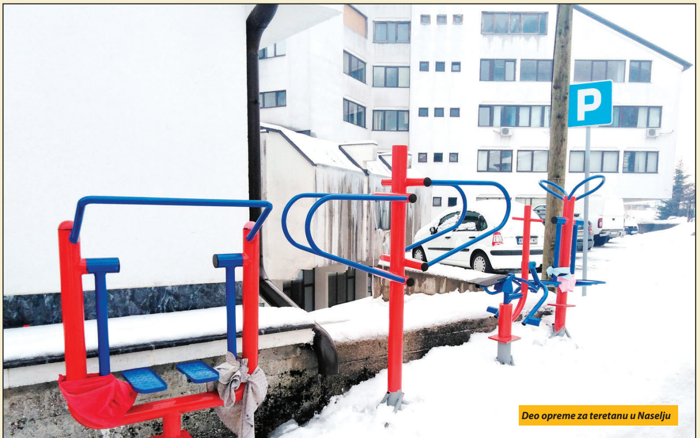
Deo opreme za teretanu u Naselju

Nova Varoš - Kraljevačka firma Kalkom dopremila je ovih dana u Novu Varoš opremu za teretanu na otvorenom, koju sredstvima od oko 2,1 miliona dinara, zajednički grade Ministarstvo omladine i sporta i Opština Nova Varoš. Novi sportsko-rekreativni mini-kompleks prostiraće se na površini od oko 80 kvadrata na lokaciji u neposrednoj blizini košarkaškog terena „Nemanja Nedović“ u Naselju. U lokalnoj samoupravi kažu da bi zemljani i betonski radovi na izgradnji teretane trebalo da započnu čim vremenske prilike to budu dozvolile, dok je postavljanje 11 sprava za