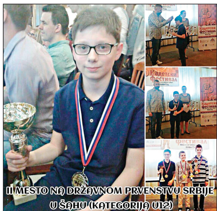
II MESTO NA DRŽAVNOM PRVENSTVU SRBIJE U ŠAHU (KATEGORIJA U12)