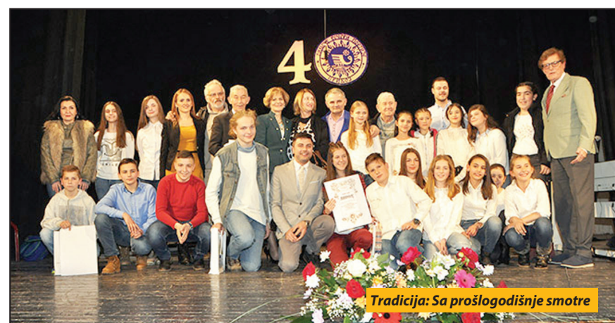
Tradicija: Sa prošlogodišnje smotre