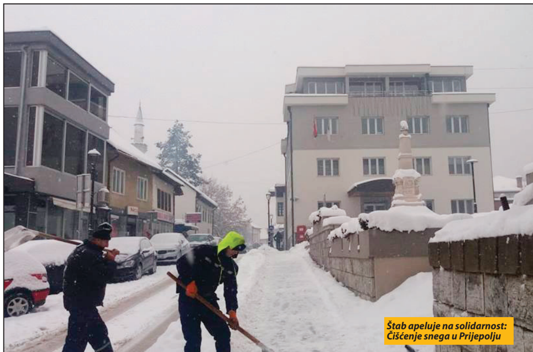
Štab apeluje na solidarnost: Čišćenje snega u Prijepolju

Prijepolje - Od početka ove godine sneg je skoro svakoga dana padao na području prijepoljske opštine. Na nedavnoj sednici Štaba za vanredne situacije, koji je zasedao u skladu sa svojim nadležnostima, zauzet je stav da ipak nije bilo uslova za proglašavanje vanredne situacije, ali je upućen apel javnim službama, mesnim zajednicama i građanima da pokažu maksimalnu odgovornost, svako u svom delokrugu, kako bi se lakše podnele posledice snega i relativno niskih temperature koje su povremeno iznosile i minus 15 stepeni.